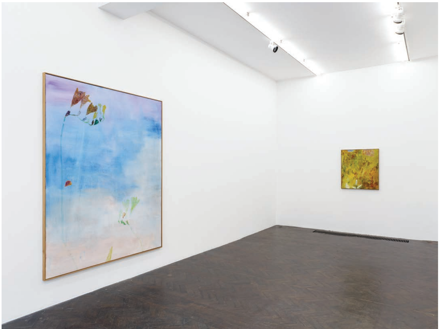
Installation view, 7 Hz Meessen De Clercq, 2022