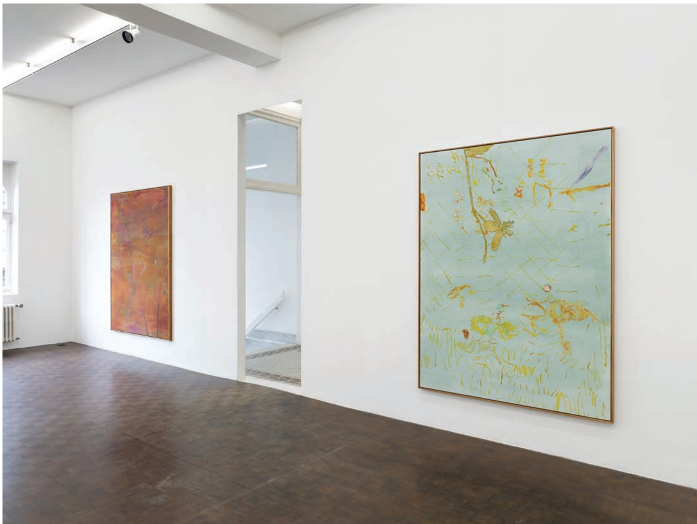
Installation view, 7 Hz Meessen De Clercq, 2022