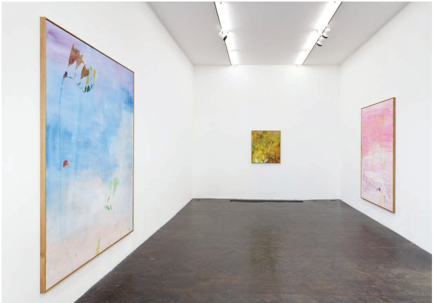
Installation view, 7 Hz Meessen De Clercq, 2022