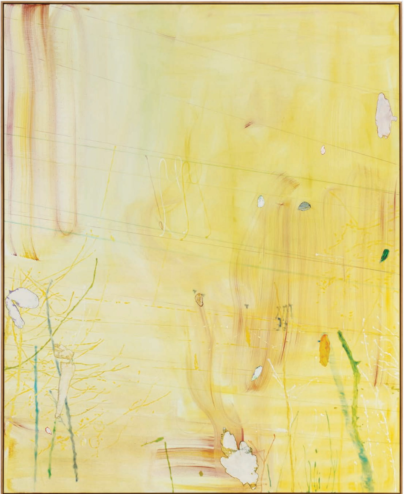
Benoit Platéus Electric Shells , 2022 Oil and collage on canvas 260 x 210 cm