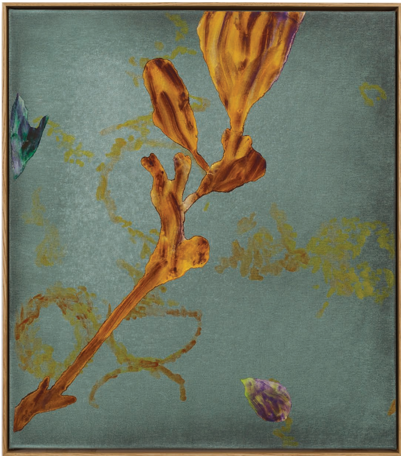
Benoit Platéus The Purple Oyster, 2022 Oil and collage on canvas 60 x 53 cm