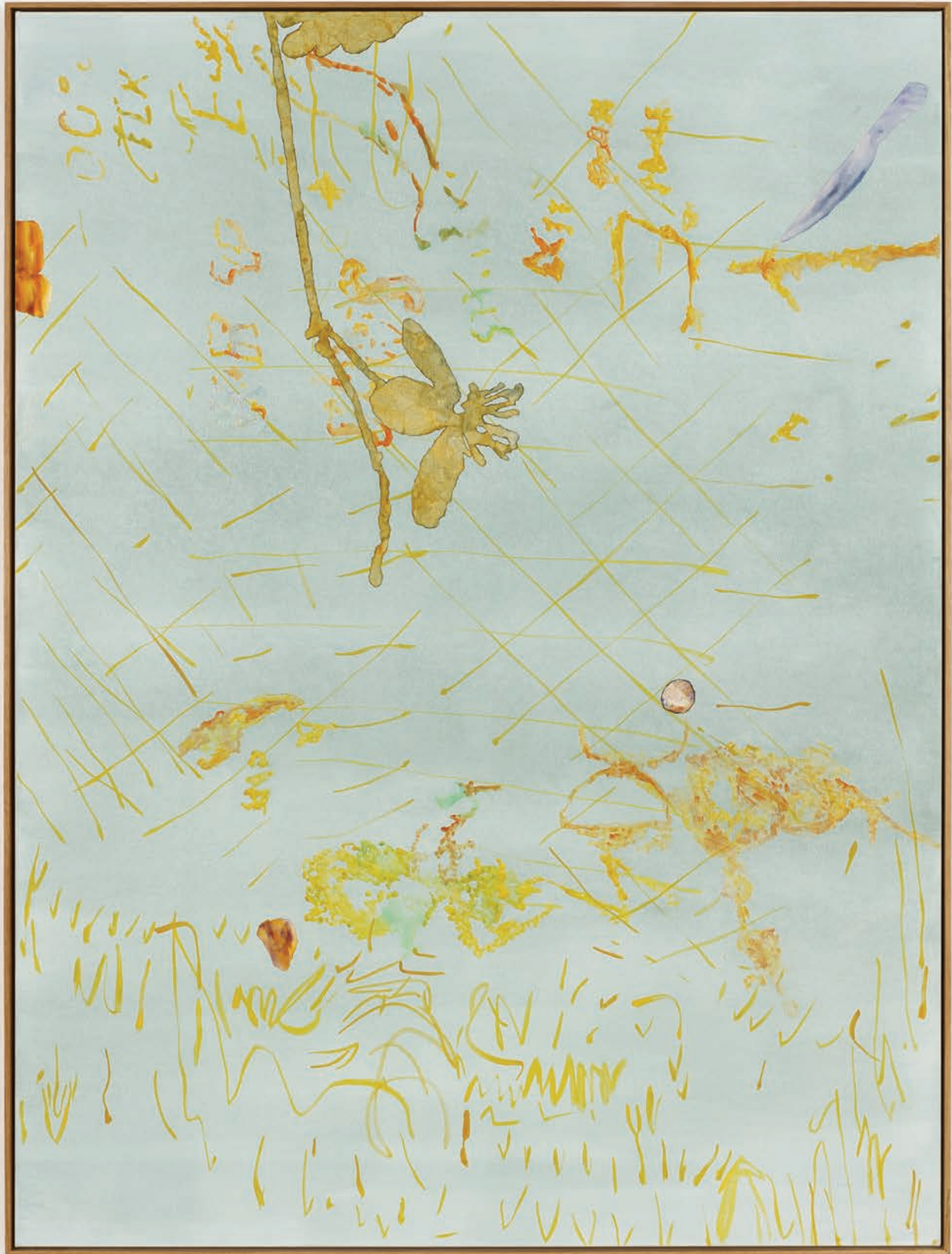
Benoit Platéus Zero G, 2022 Oil and collage on canvas 200 x 150 cm