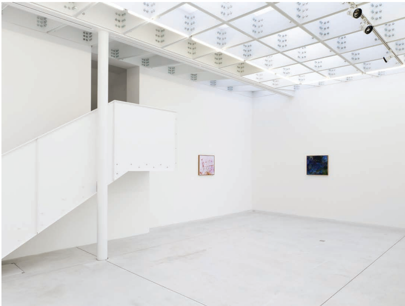
Installation view, 7 Hz Meessen De Clercq, 2022