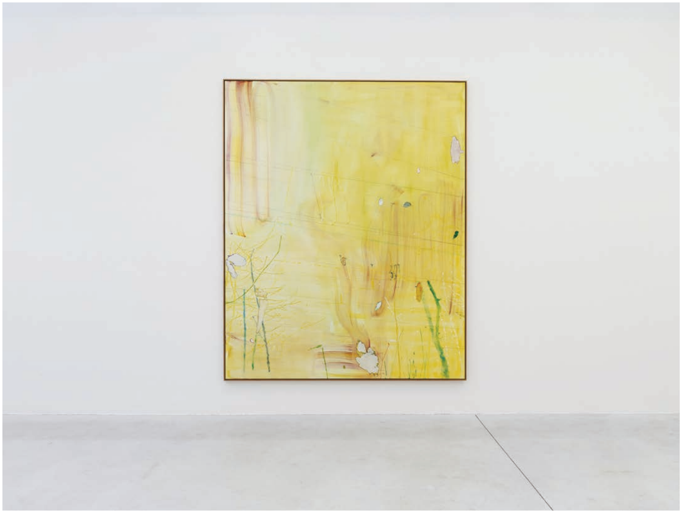
Installation view, 7 Hz Meessen De Clercq, 2022