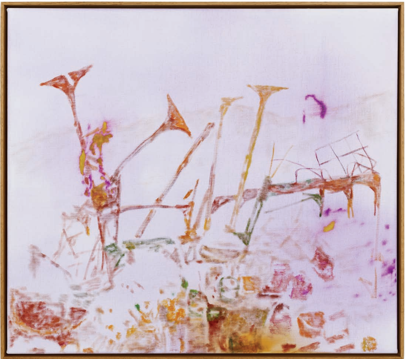
Benoit Platéus Distillée , 2022 Oil and collage on canvas 53 x 60 cm