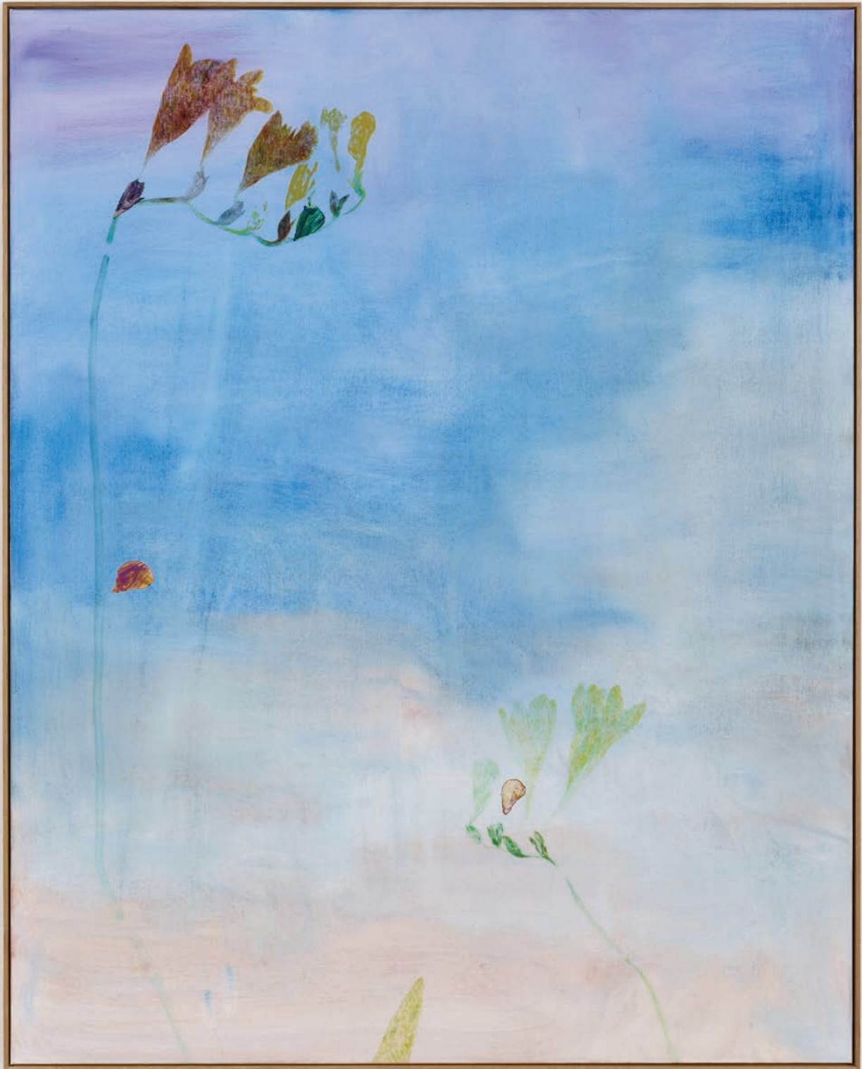
Benoit Platéus The Eccentric Oysters, 2022 Oil and collage on canvas 220 x 176 cm