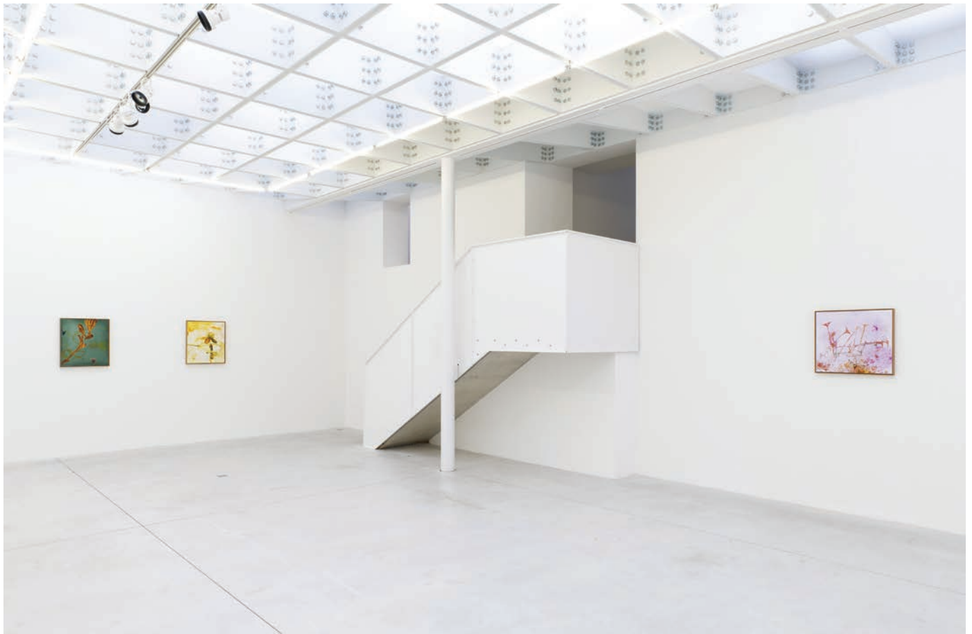
Installation view, 7 Hz Meessen De Clercq, 2022