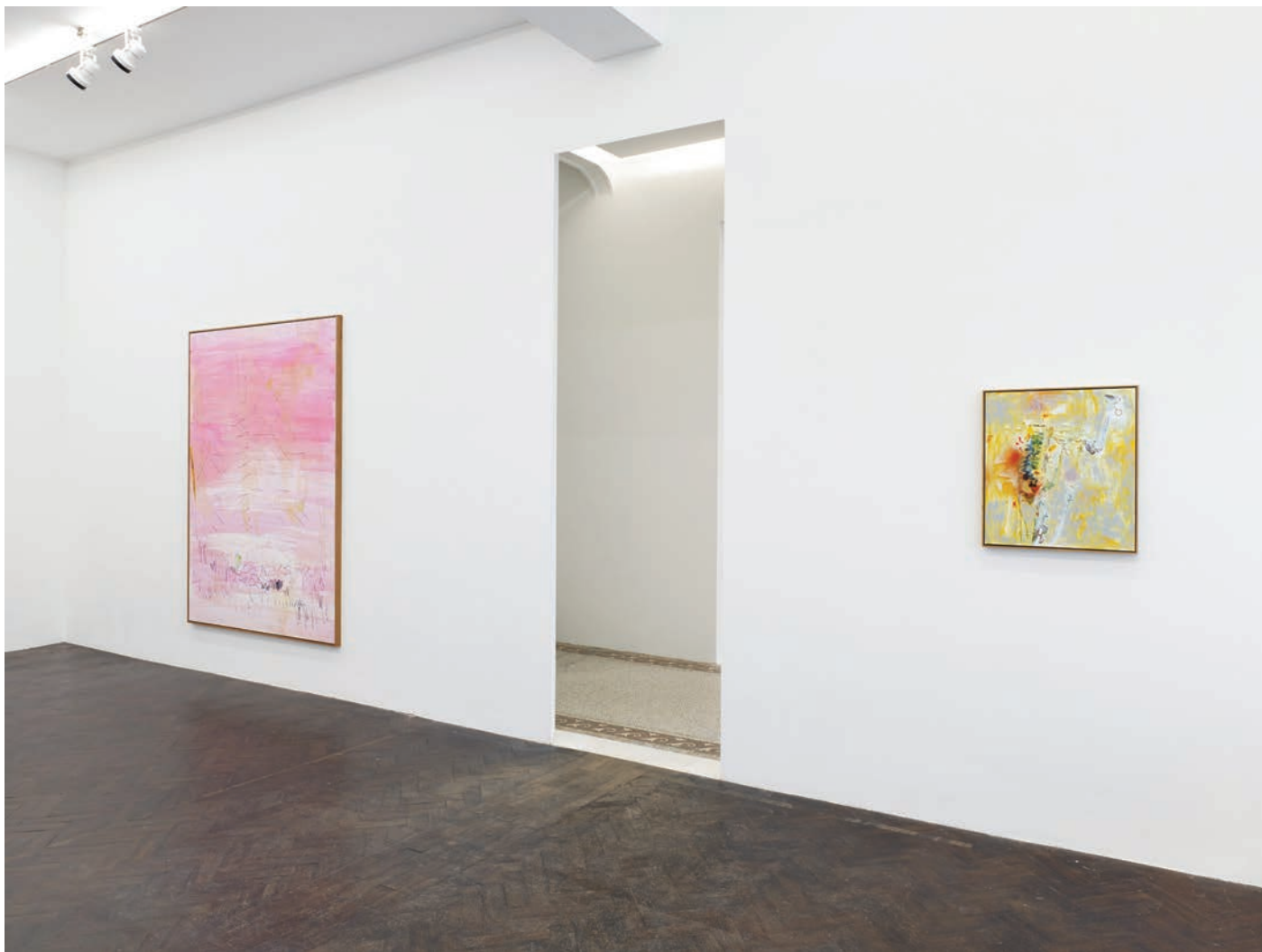
Installation view, 7 Hz Meessen De Clercq, 2022