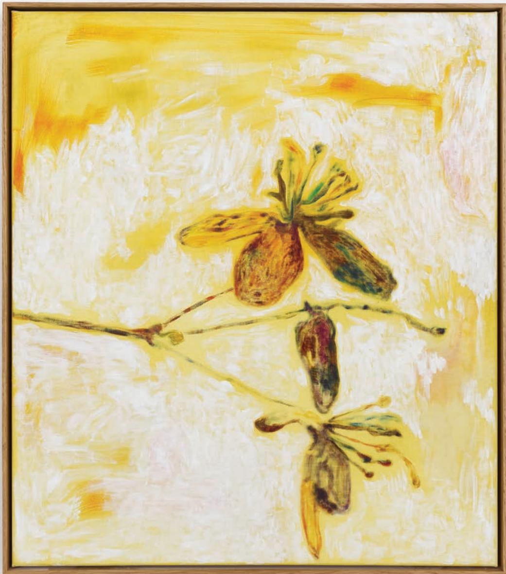
Benoit Platéus Le règne végétal , 2022 Oil and collage on canvas 60 x 53 cm