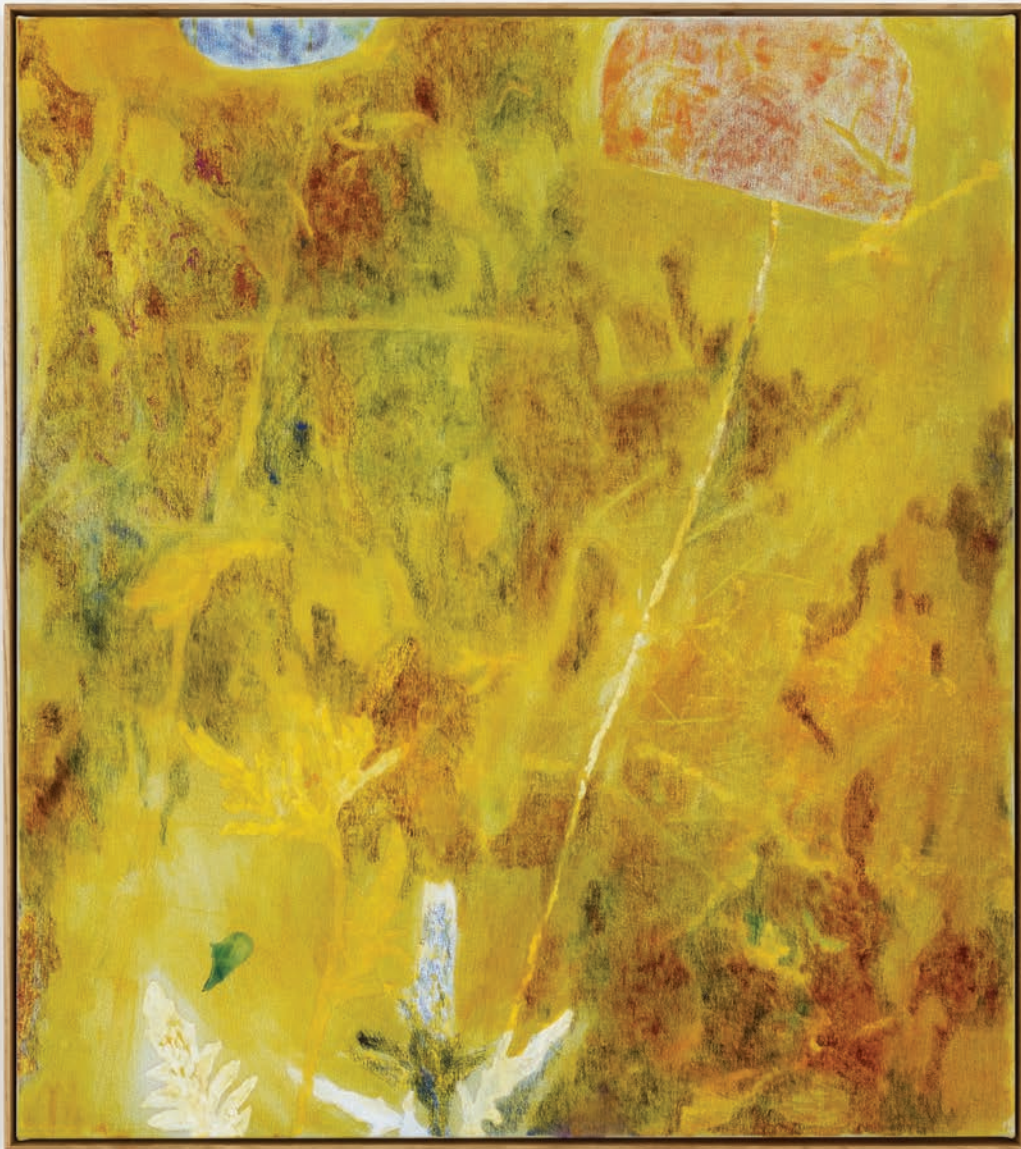
Benoit Platéus Le règne animal , 2022 Oil and collage on canvas 90 x 80 cm