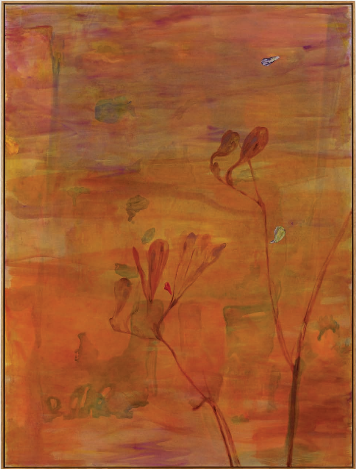
Benoit Platéus La comète saline , 2022 Oil and collage on canvas 200 x 150 cm