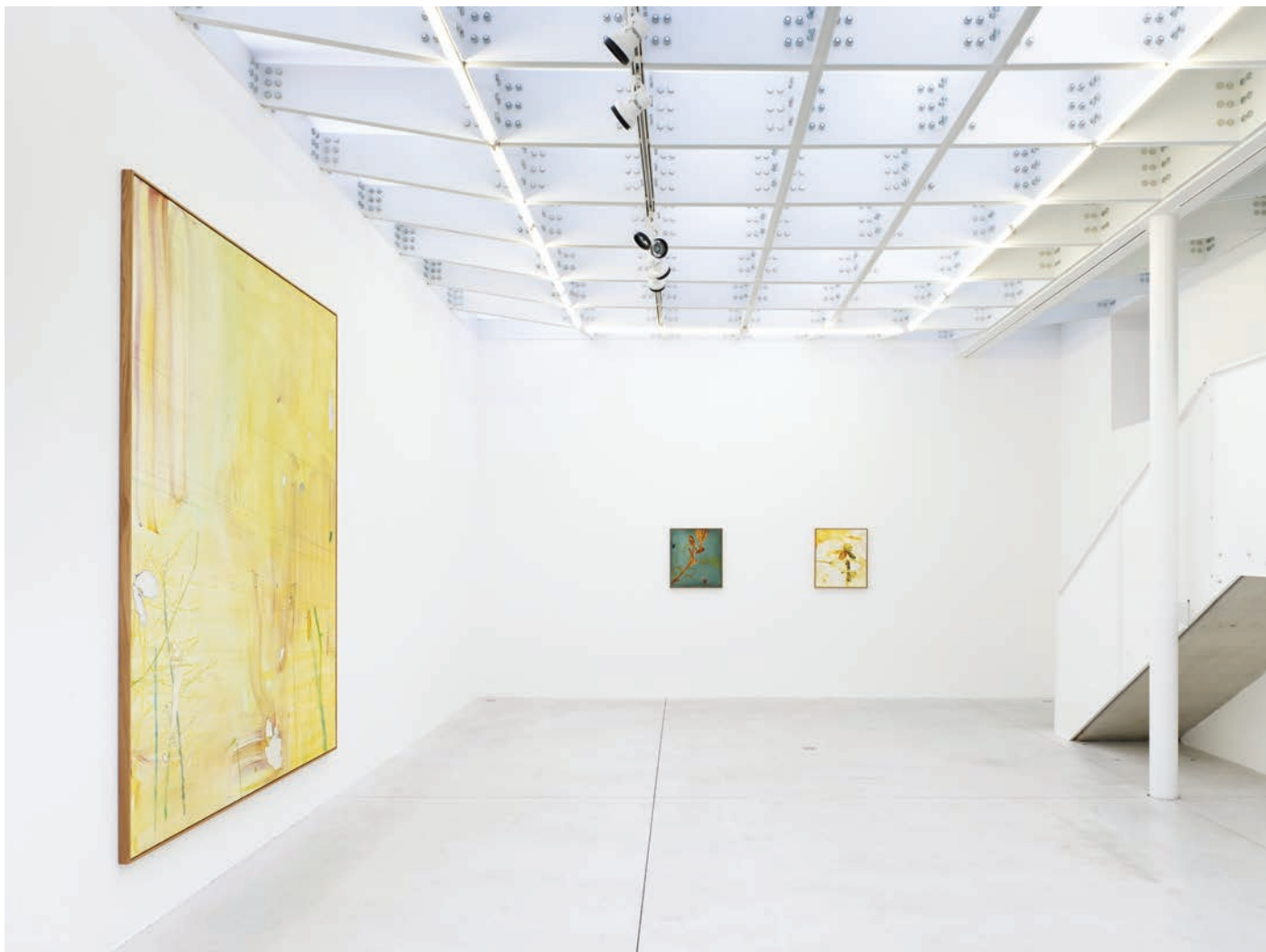
Installation view, 7 Hz Meessen De Clercq, 2022