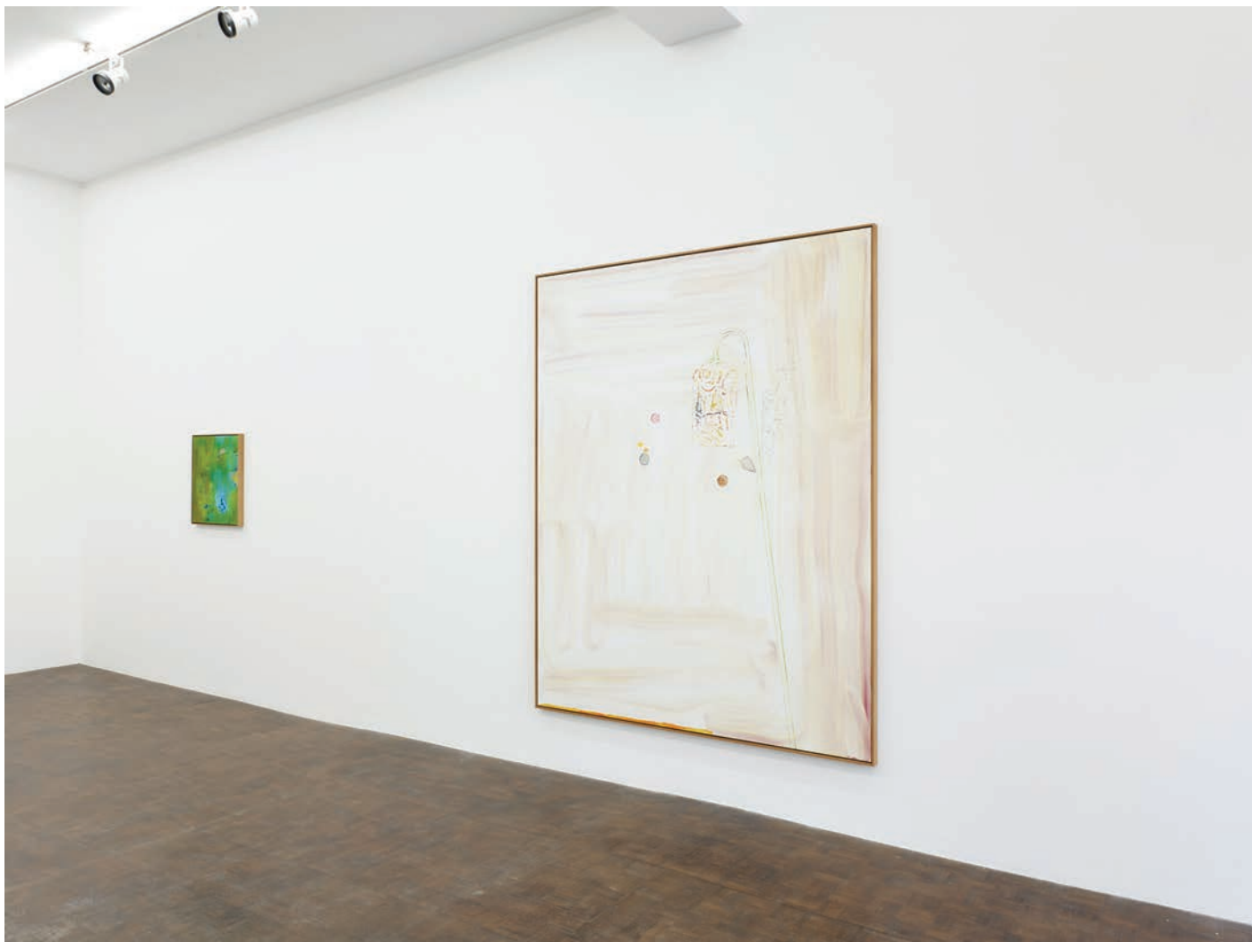
Installation view, 7 Hz Meessen De Clercq, 2022