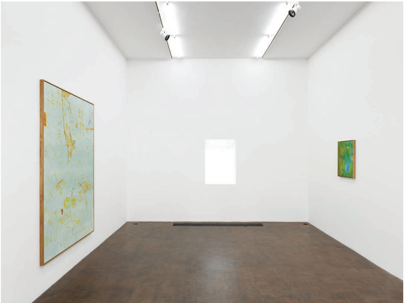
Installation view, 7 Hz Meessen De Clercq, 2022