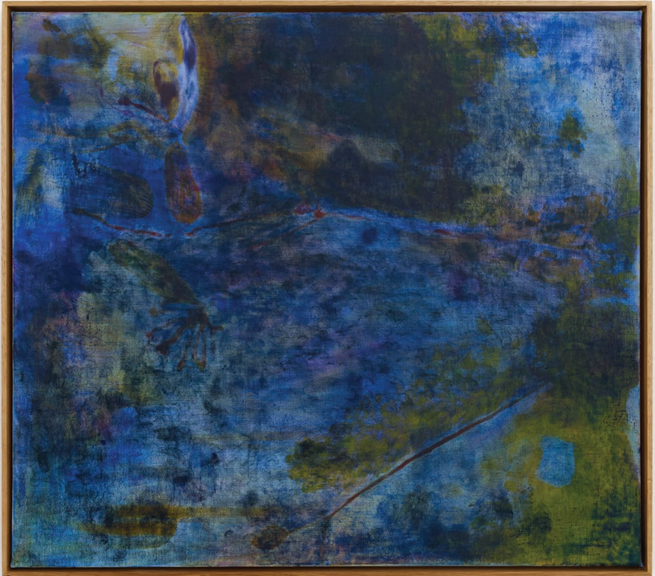
Benoit Platéus La sourde , 2022 Oil and collage on canvas 53 x 60 cm