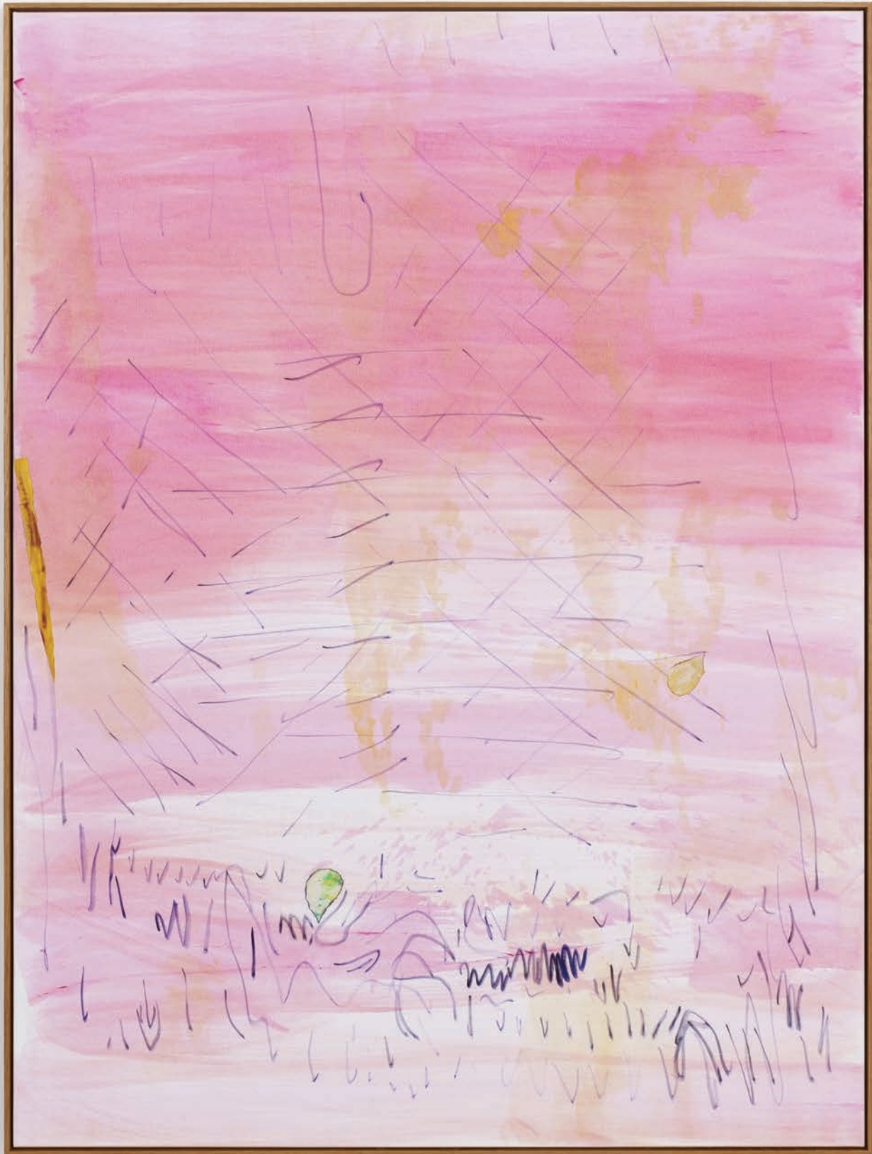
Benoit Platéus The Chinese Stick, 2022 Oil and collage on canvas 200 x 150 cm