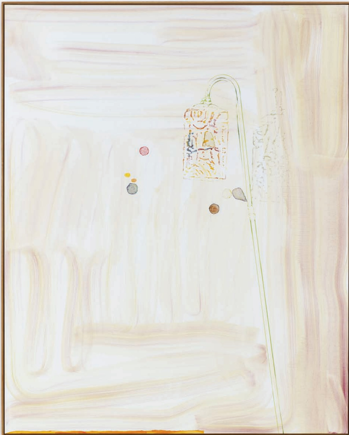
Benoit Platéus Lazy photons , 2022 Oil and collage on canvas 220 x 176 cm