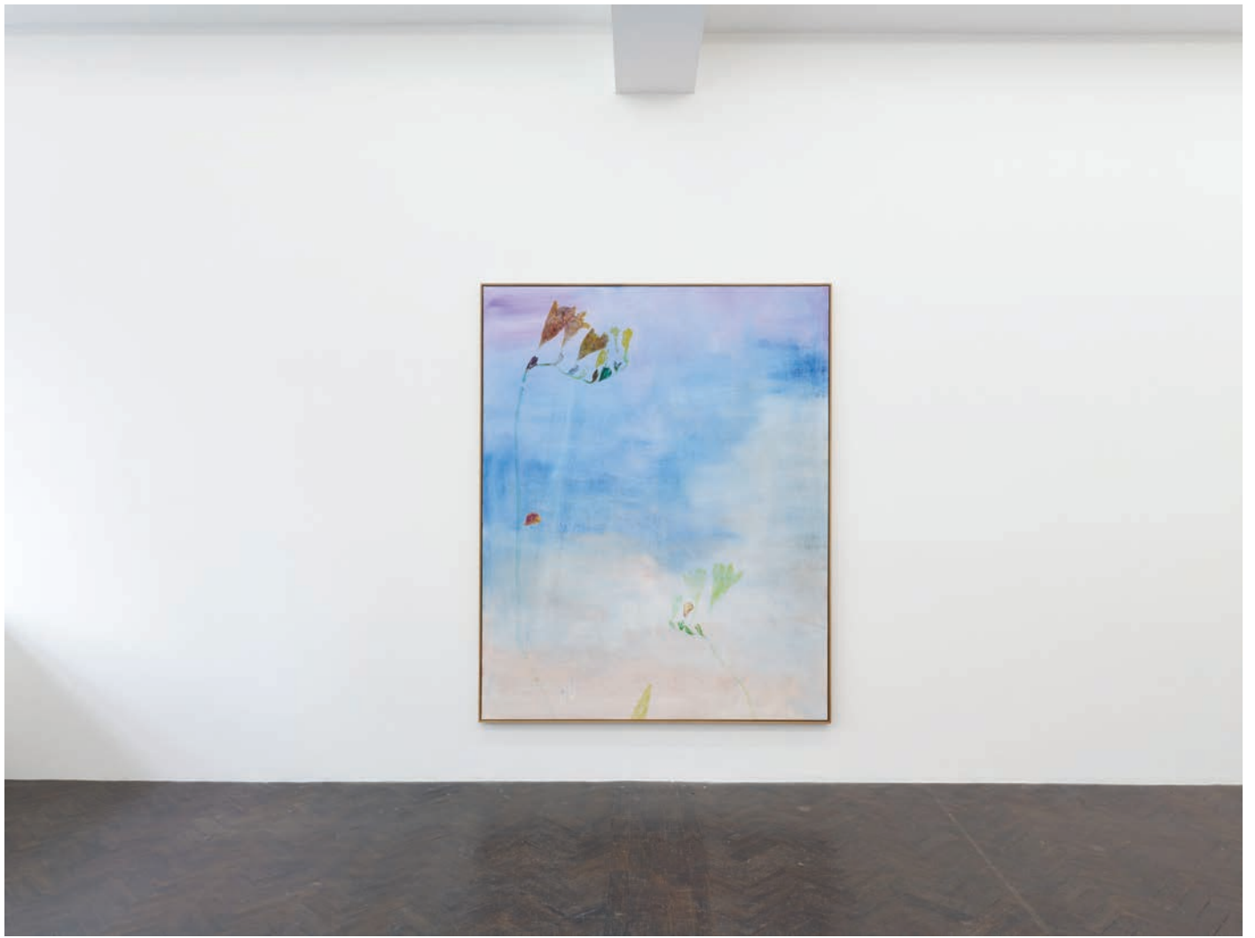
Installation view, 7 Hz Meessen De Clercq, 2022