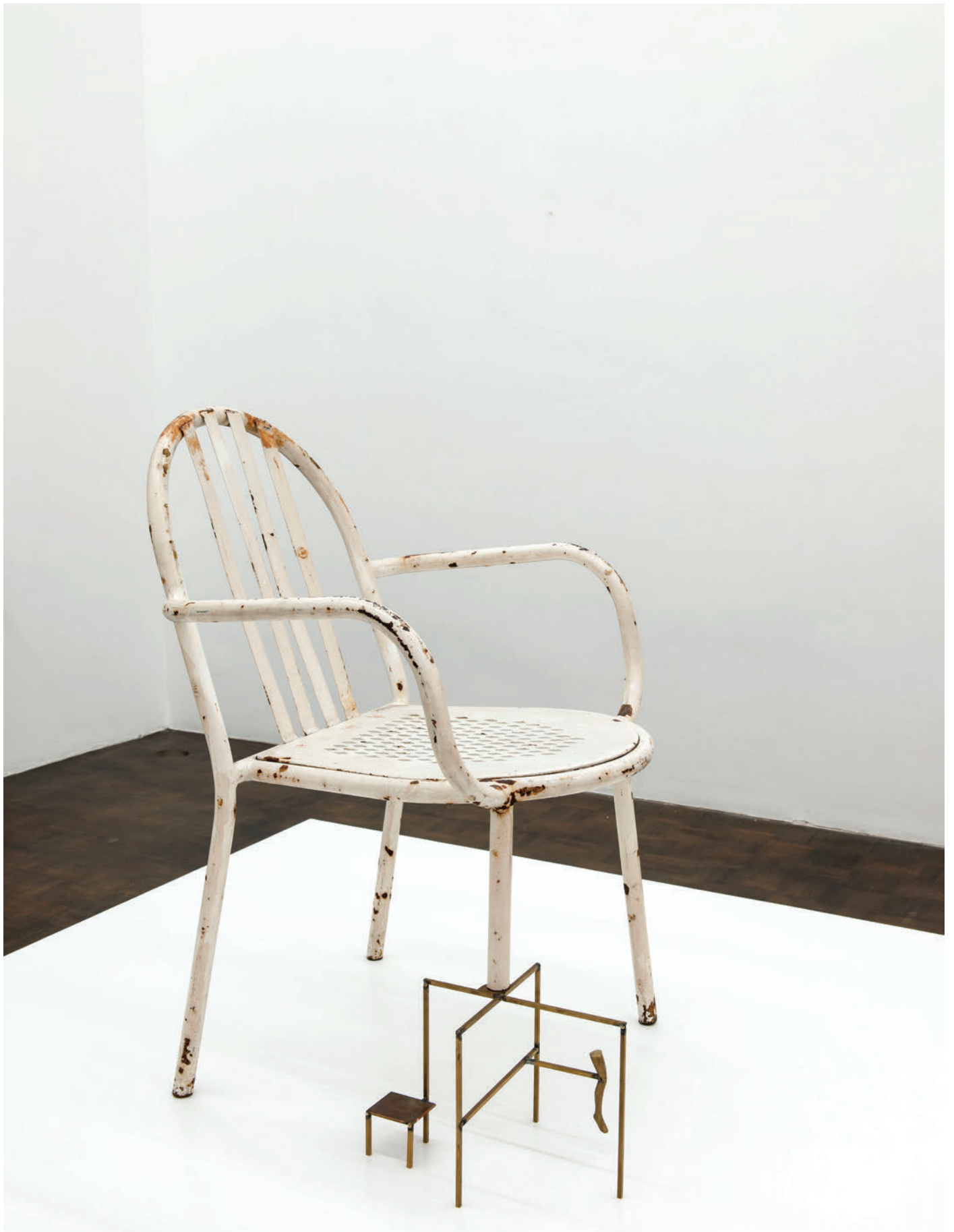
Benoît Maire Château, 2018 Painted metal, brass 114 x 150 x 150 cm