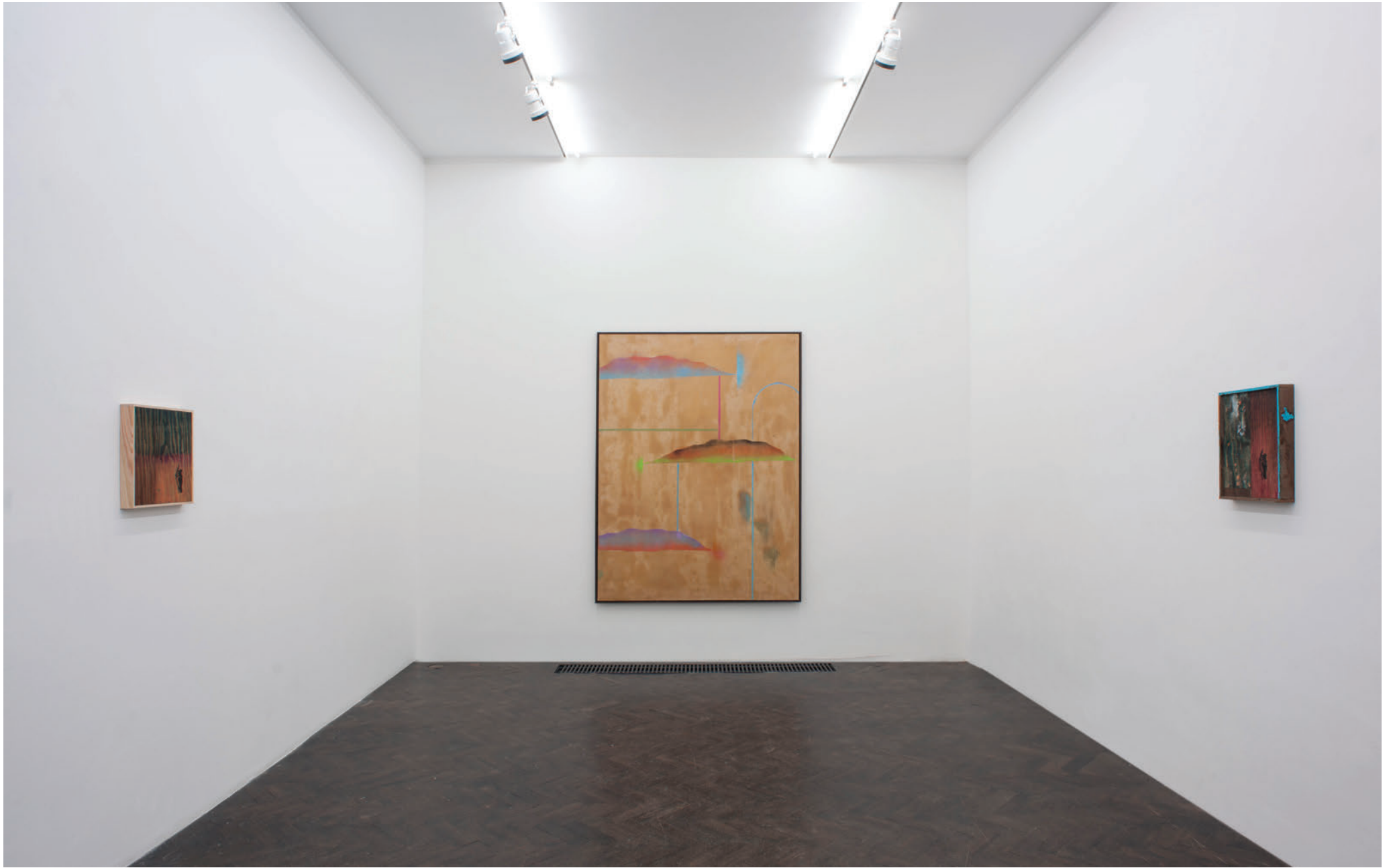
Exhibition view, My Horse for a shore , Meessen De Clercq