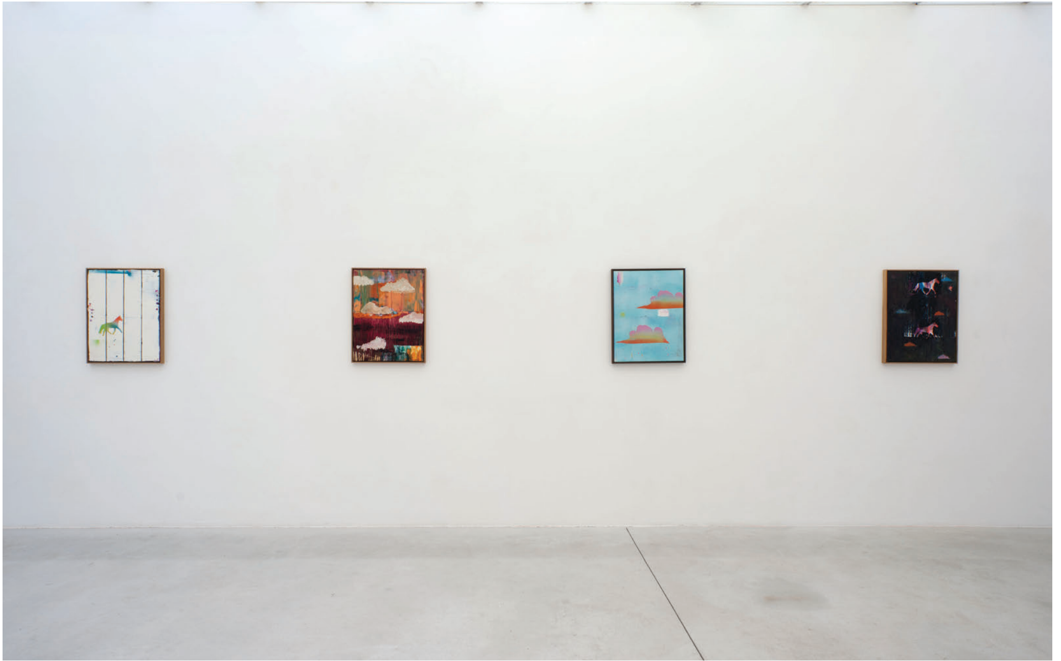
Exhibition view, My Horse for a shore , Meessen De Clercq