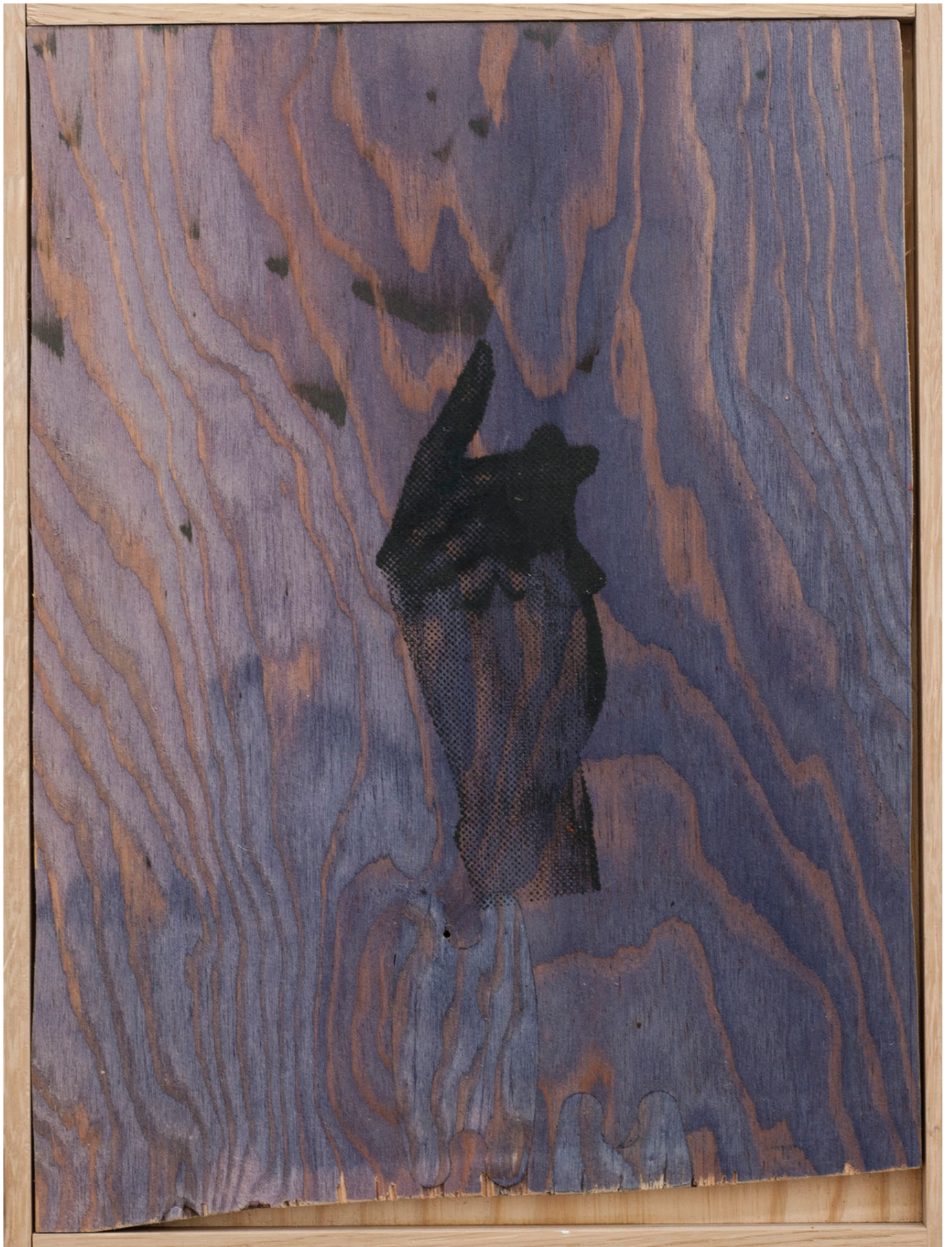
Benoît Maire Icône , 2020 Varnish on wood and oil silkscreen printing 45 x 34 x 5 cm