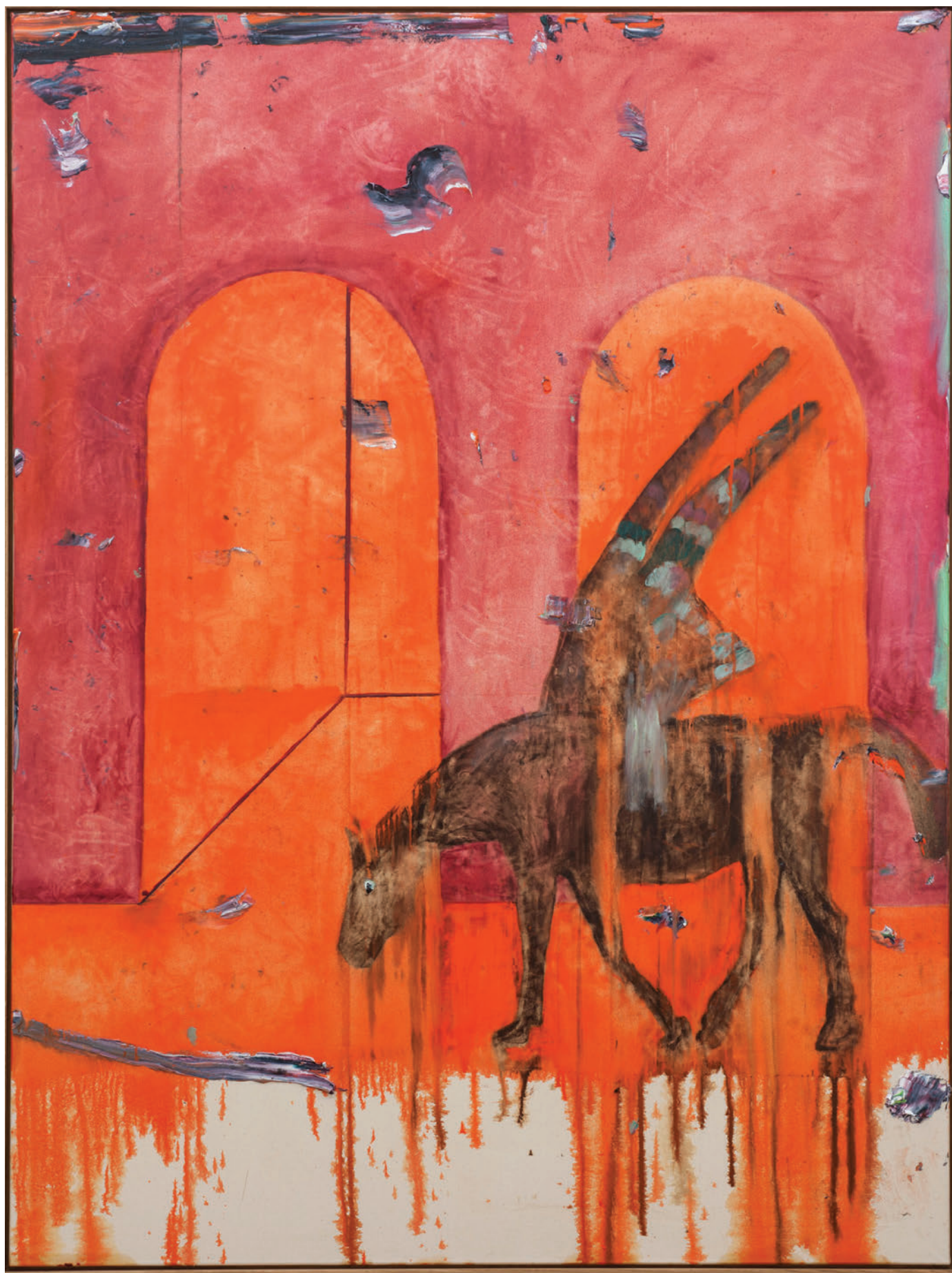
Benoît Maire Peinture de nuages, 2020 Oil on canvas 200 x 150 cm