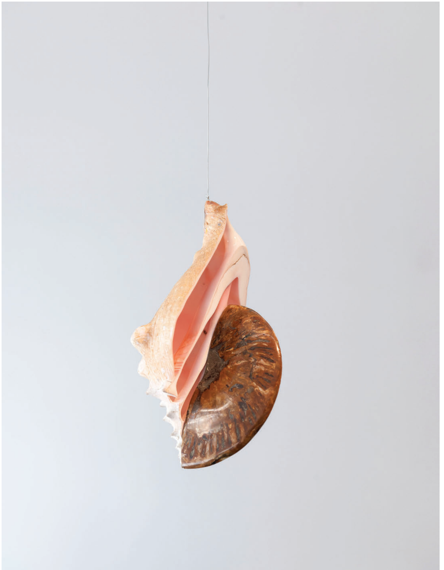
Benoît Maire Sphinx , 2019 Strombus giga, ammonite fossil 22 x 9 x 14 cm