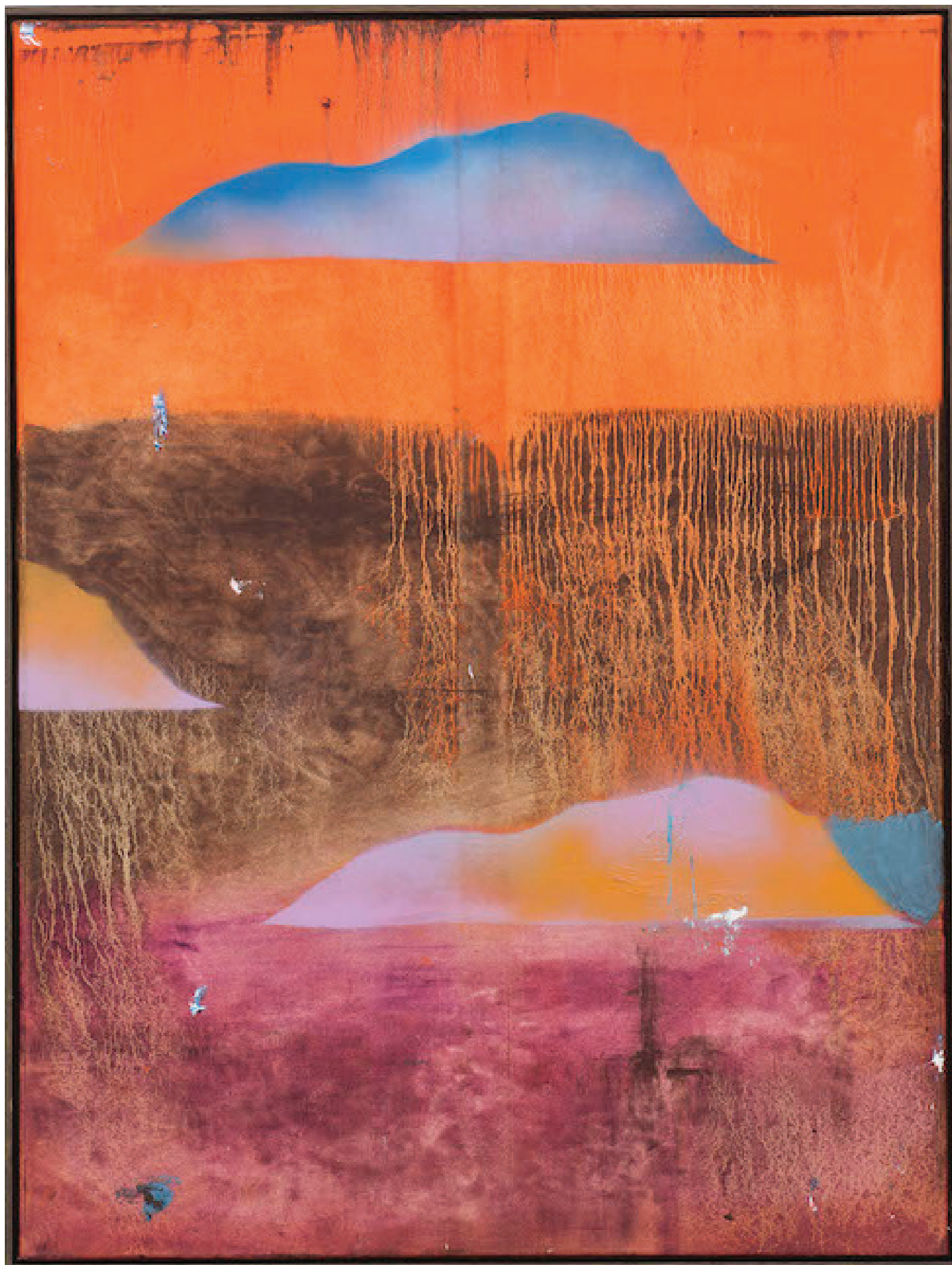
Benoît Maire Peinture de nuages, 2020 Oil on canvas 100 x 75 cm