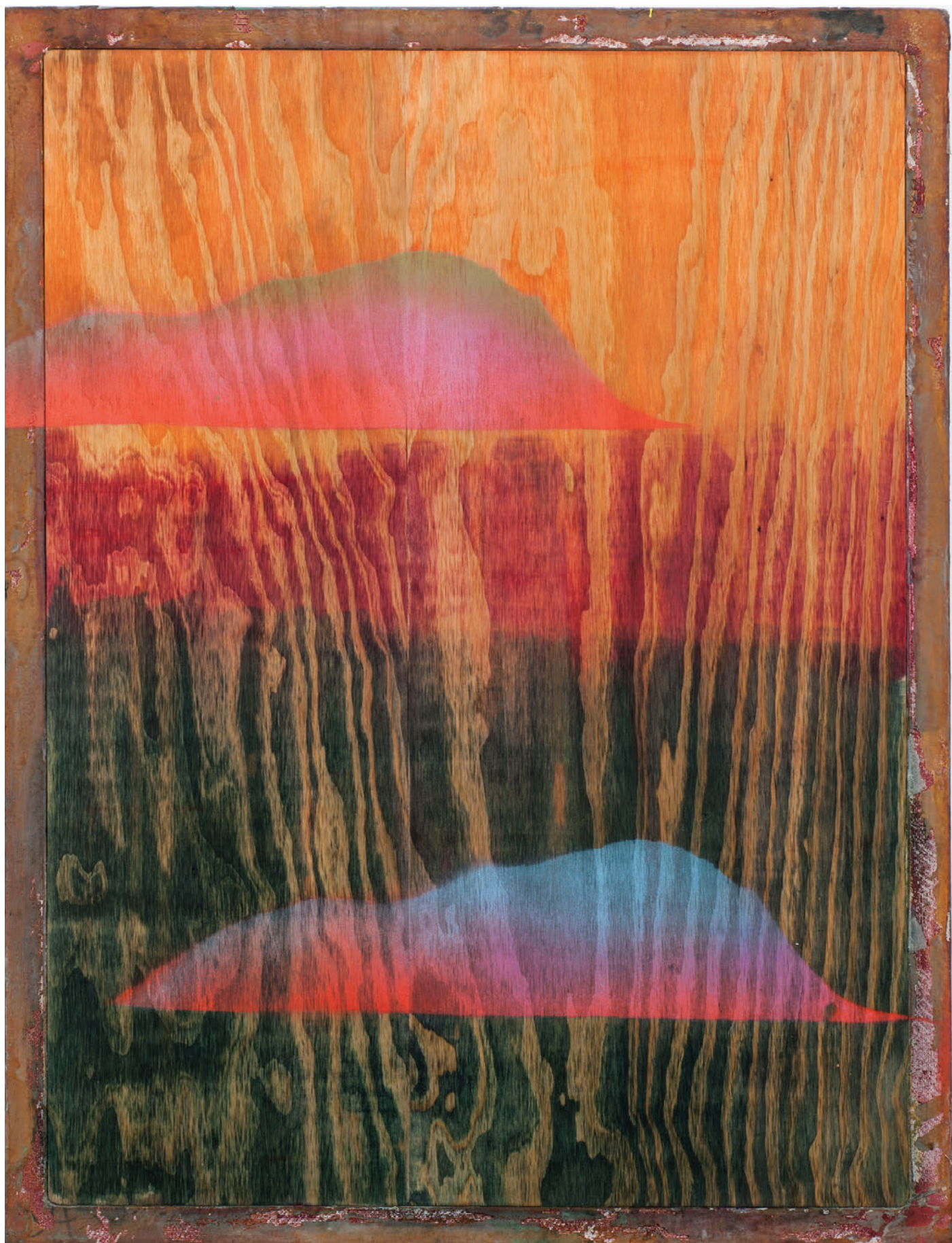
Benoît Maire Peinture de nuages, 2020 Oil painting on wood and silkscreen frame 86 x 66 cm