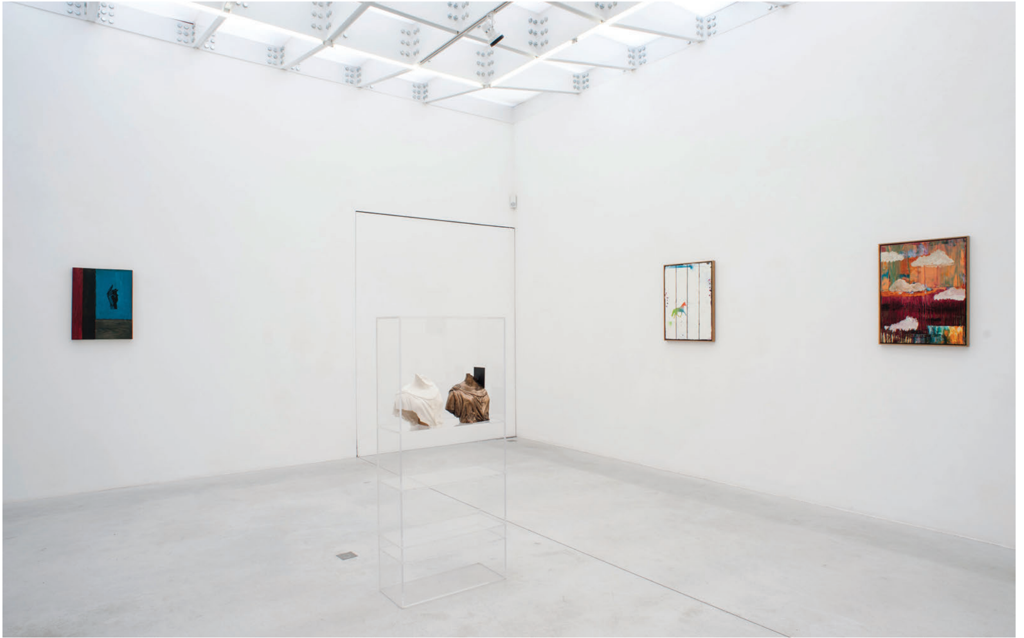
Exhibition view, My Horse for a shore , Meessen De Clercq