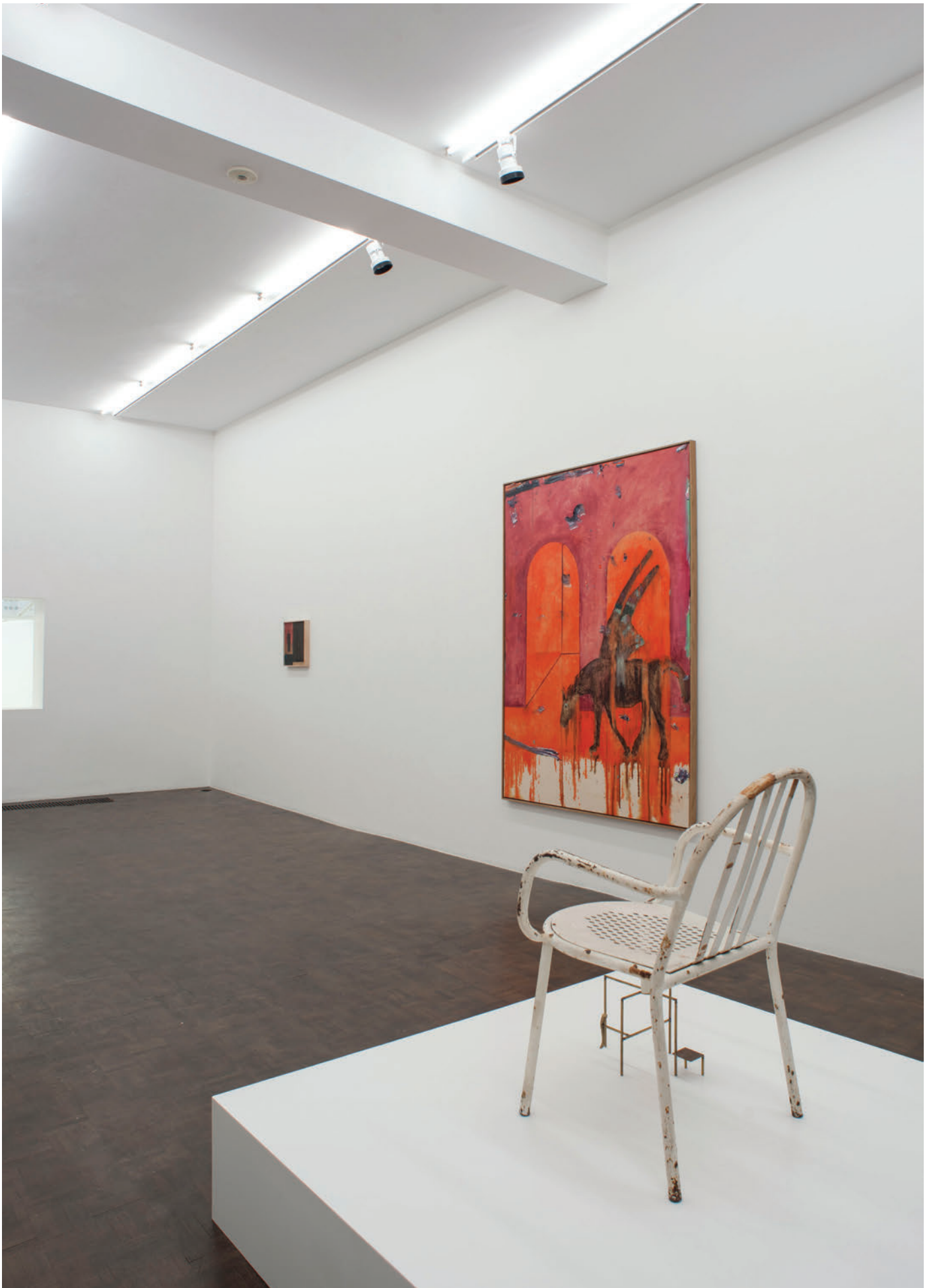
Exhibition view, My horse for a show , Meessen De Clercq