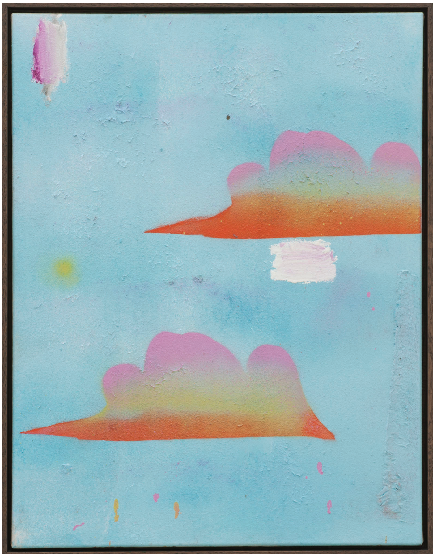
Benoît Maire Peinture de nuages, 2020 Oil on canvas 65 x 50 cm