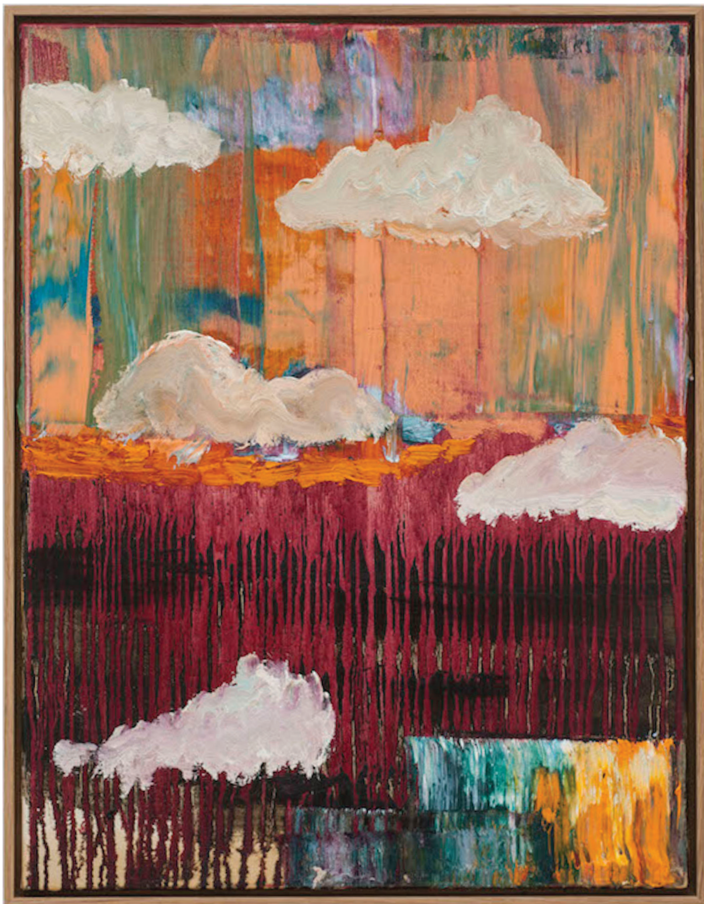
Benoît Maire Peinture de nuages, 2020 Oil on canvas 65 x 50 cm