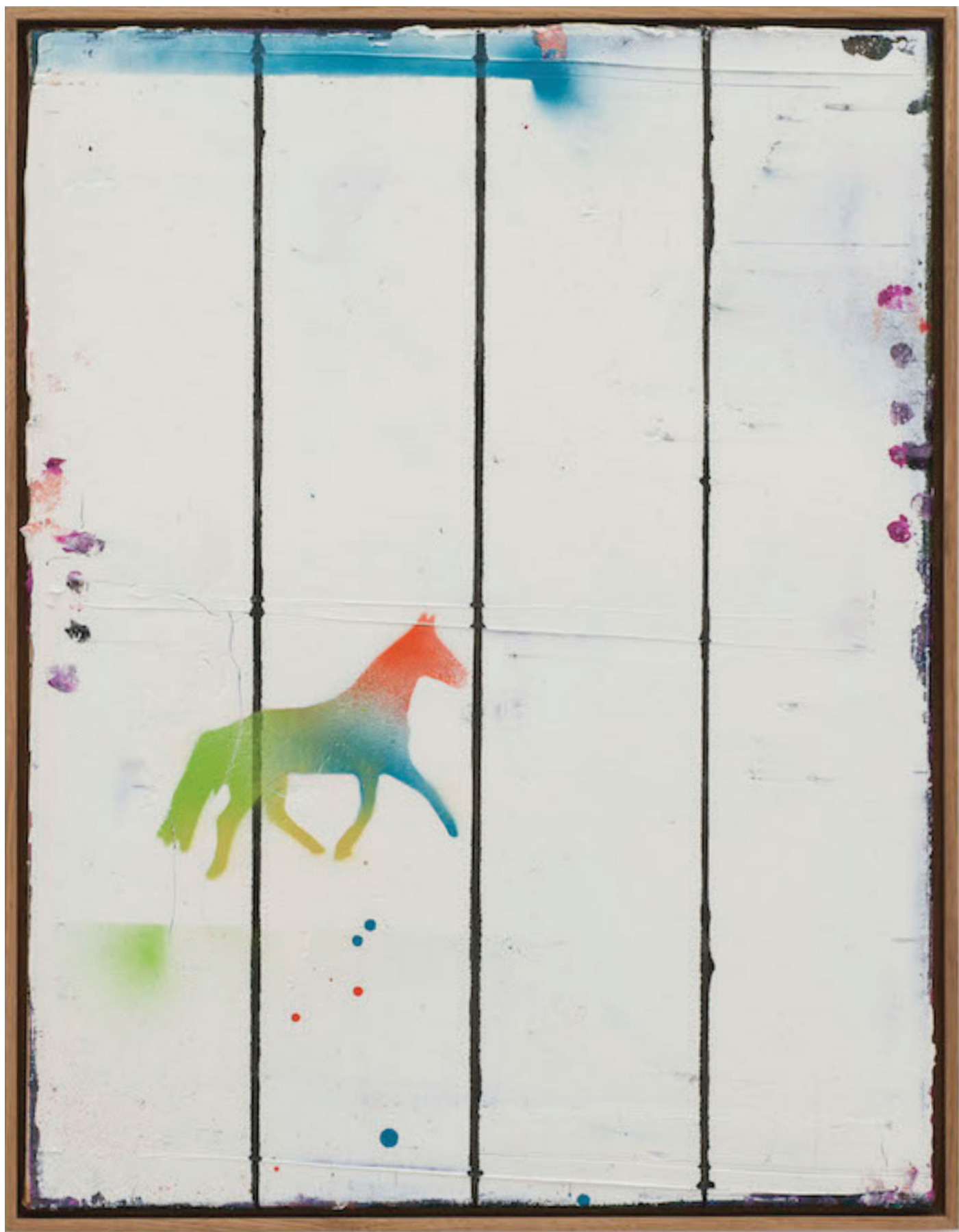
Benoît Maire Peinture de nuages, 2020 Oil on canvas 65 x 50 cm