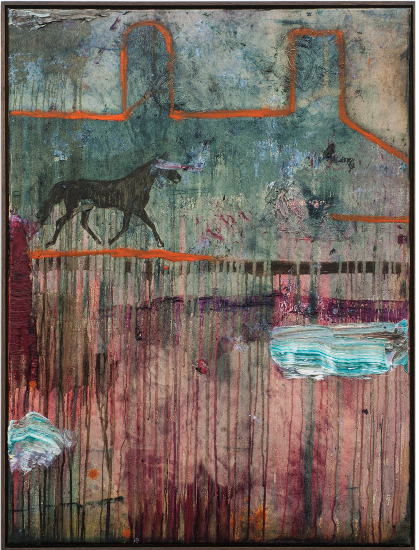
Benoît Maire Peinture de nuages, 2020 Oil on canvas 100 x 75 cm