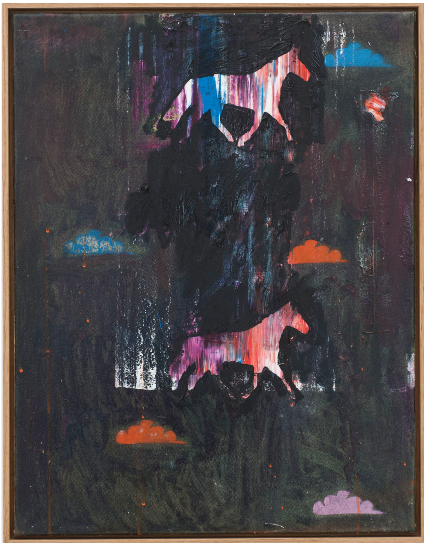
Benoît Maire Peinture de nuages, 2020 Oil on canvas 65 x 50 cm