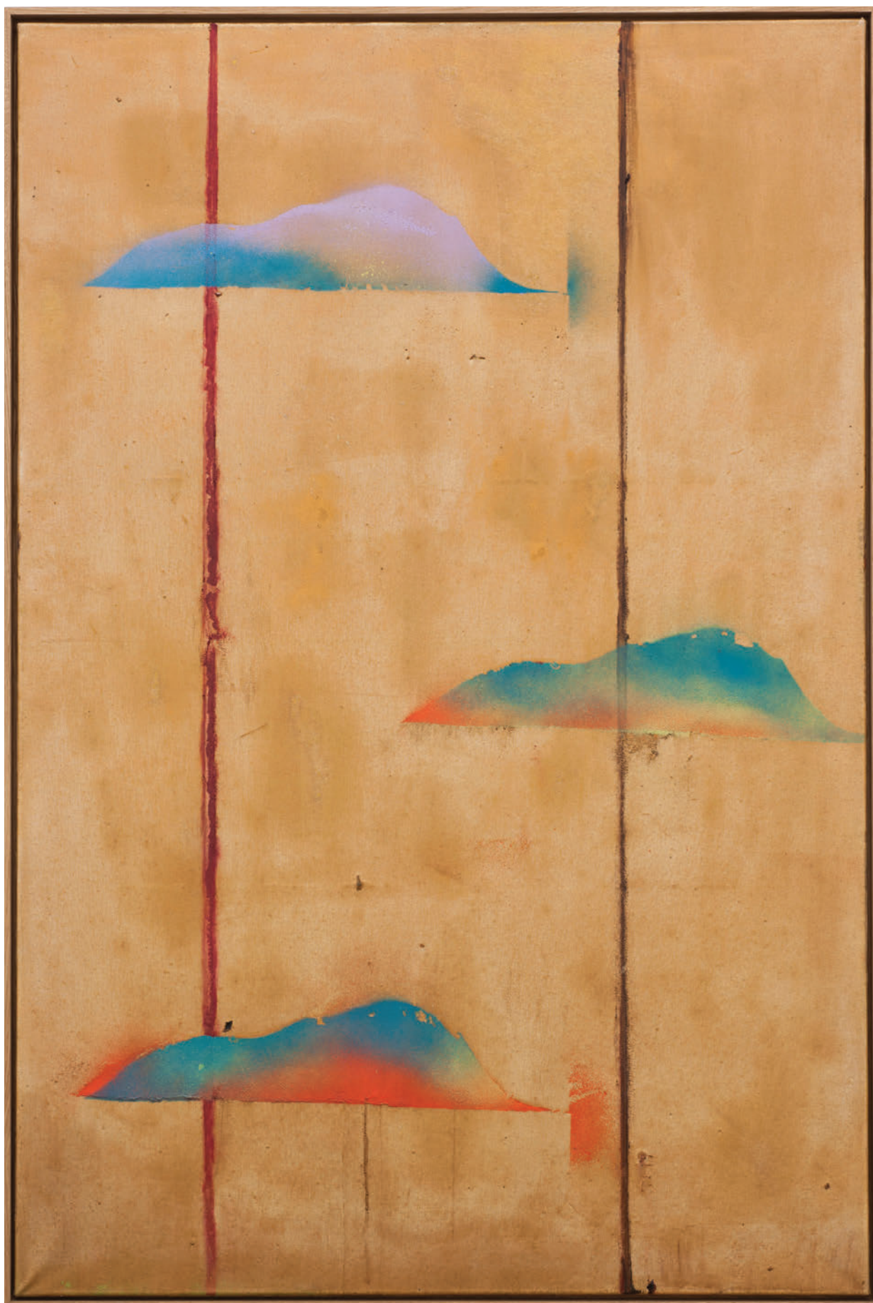
Benoît Maire Peinture de nuages, 2020 Oil on canvas 150 x 100 cm