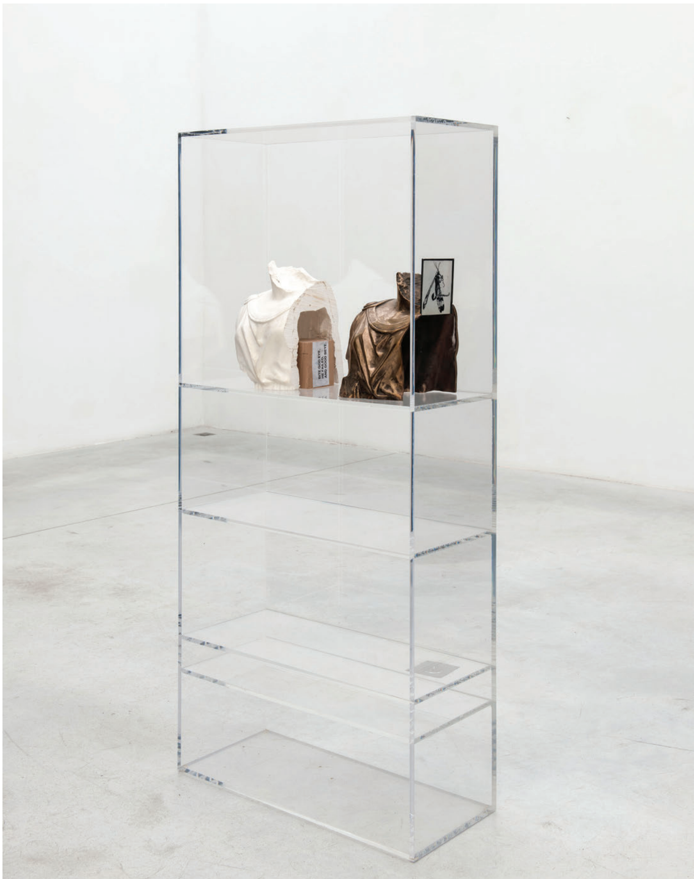
Benoît Maire Sans titre, 2020 Plexiglas, bronze, plaster 140 x 70 x 30 cm