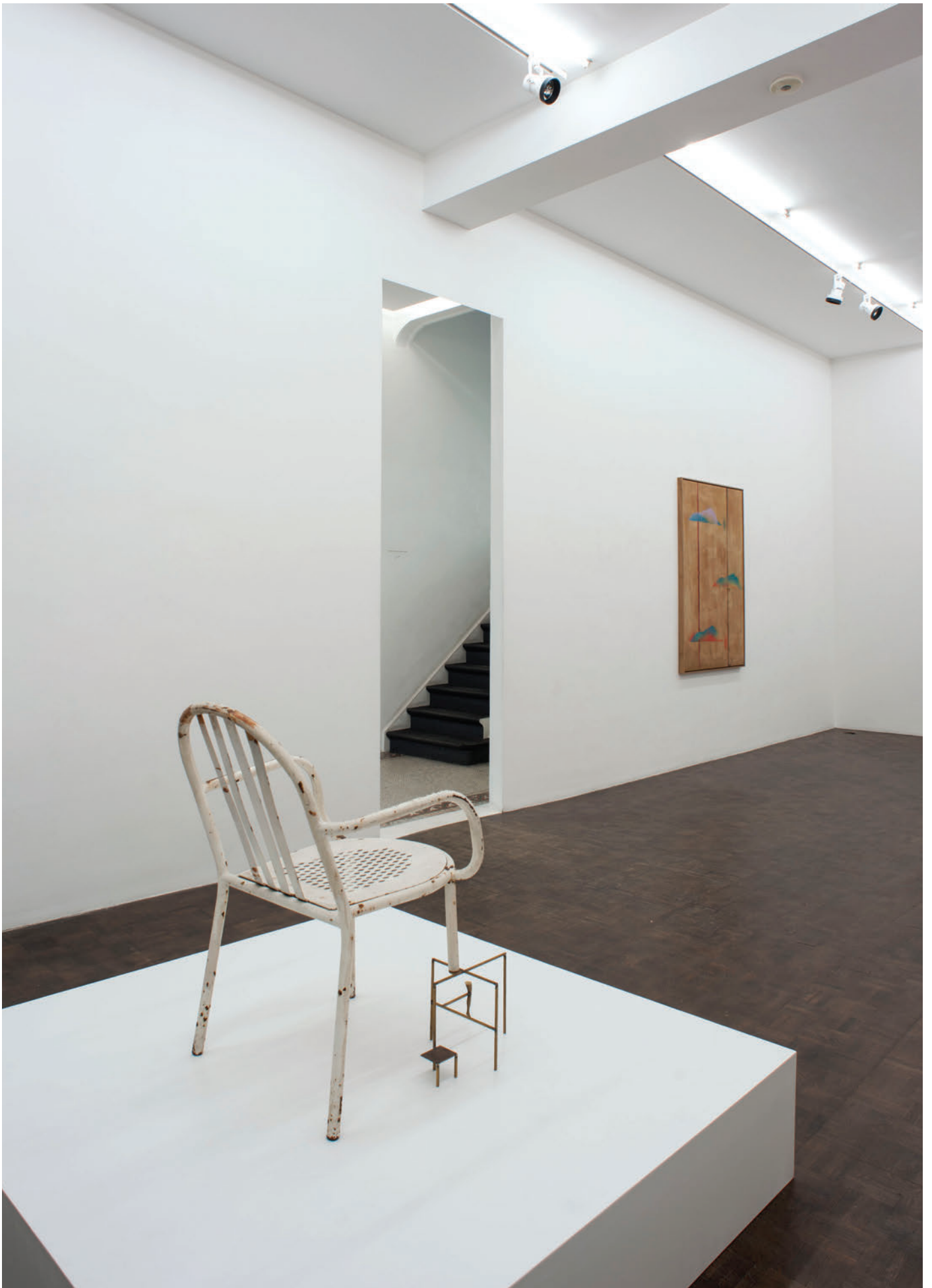
Exhibition view, My Horse for a shore , Meessen De Clercq