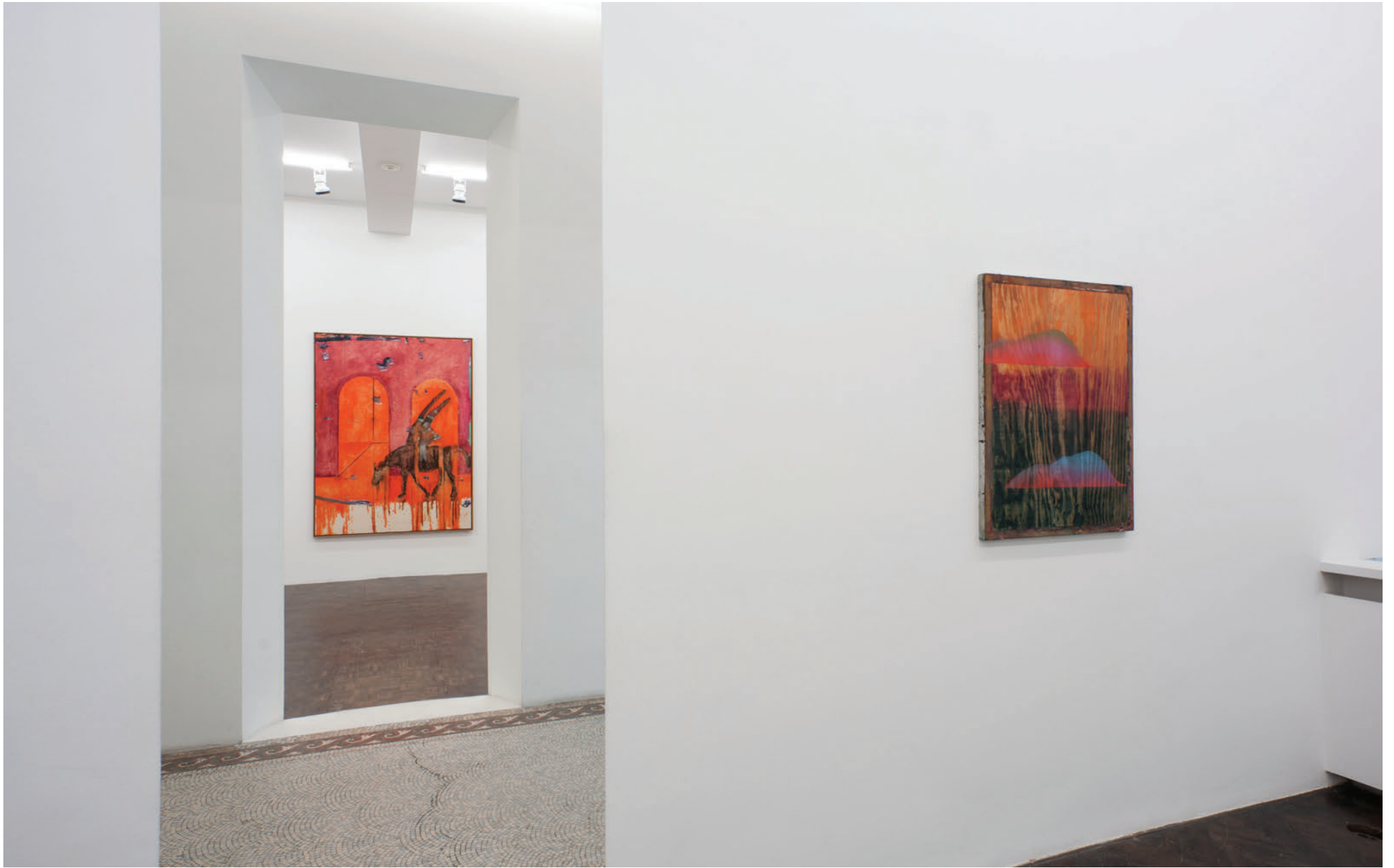
Exhibition view, My Horse for a shore , Meessen De Clercq