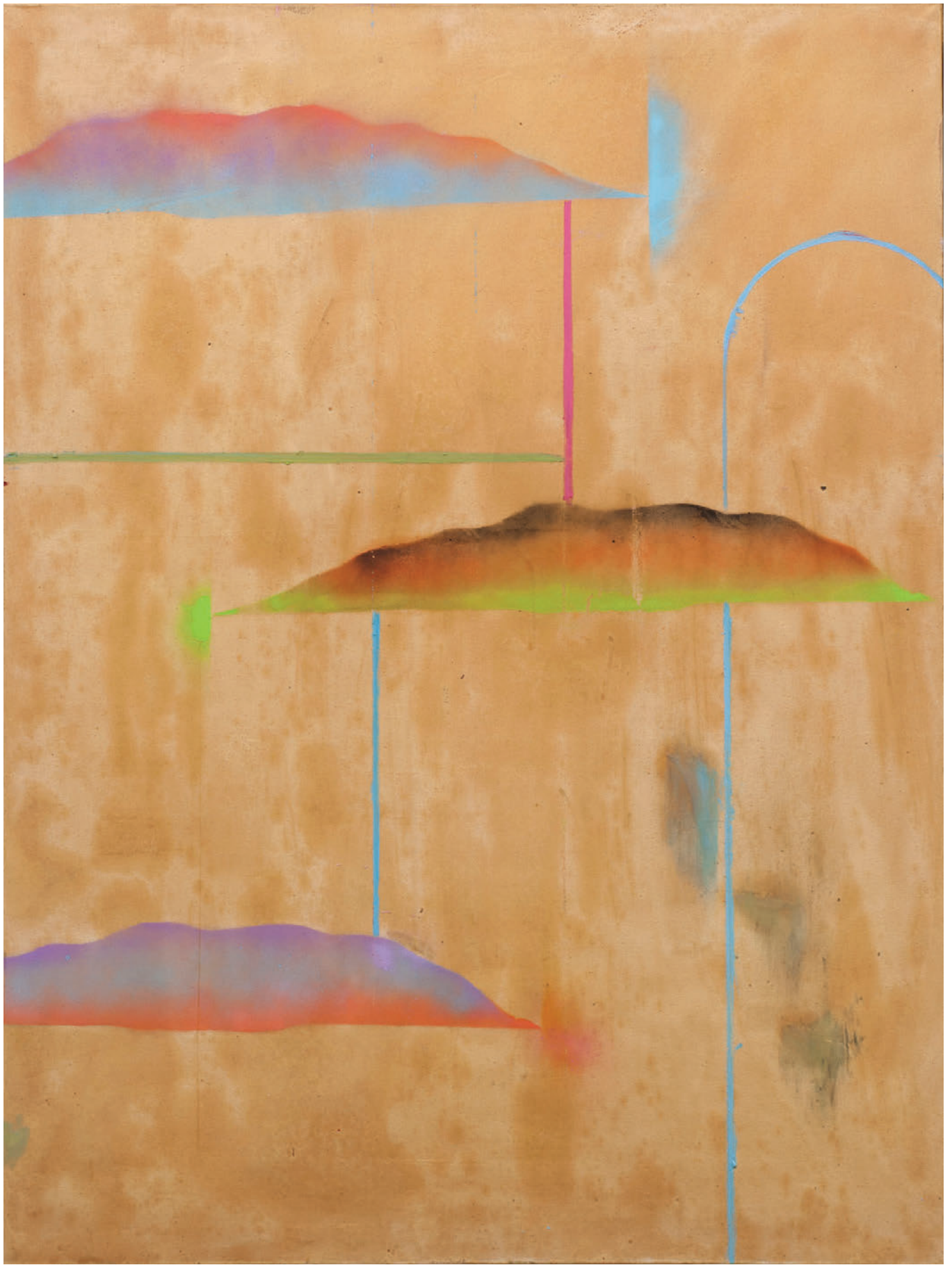
Benoît Maire Peinture de nuages, 2020 Oil on canvas 200 x 150 cm