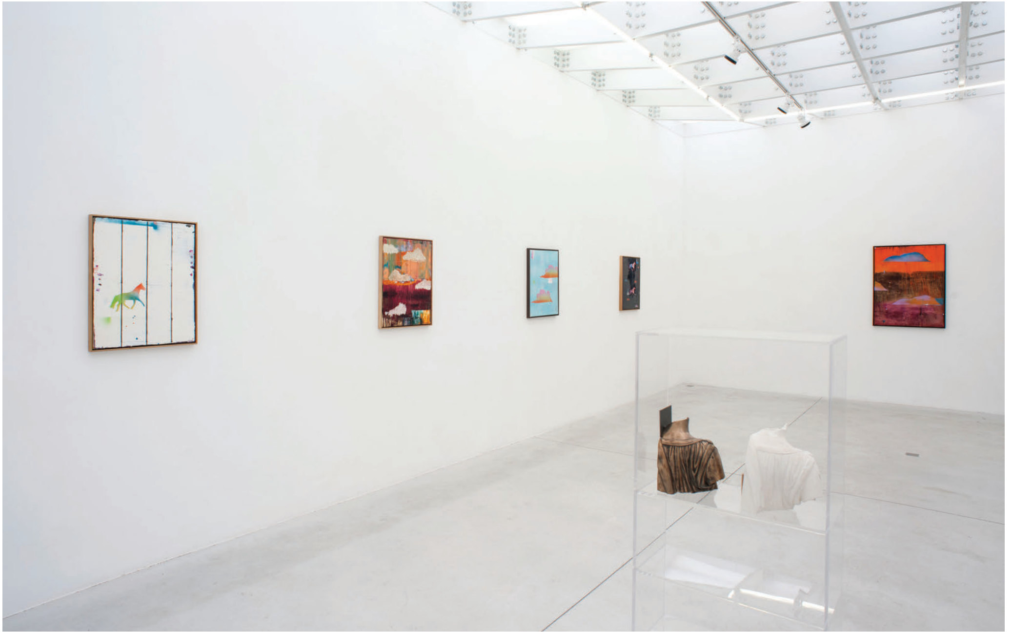
Exhibition view, My Horse for a shore , Meessen De Clercq