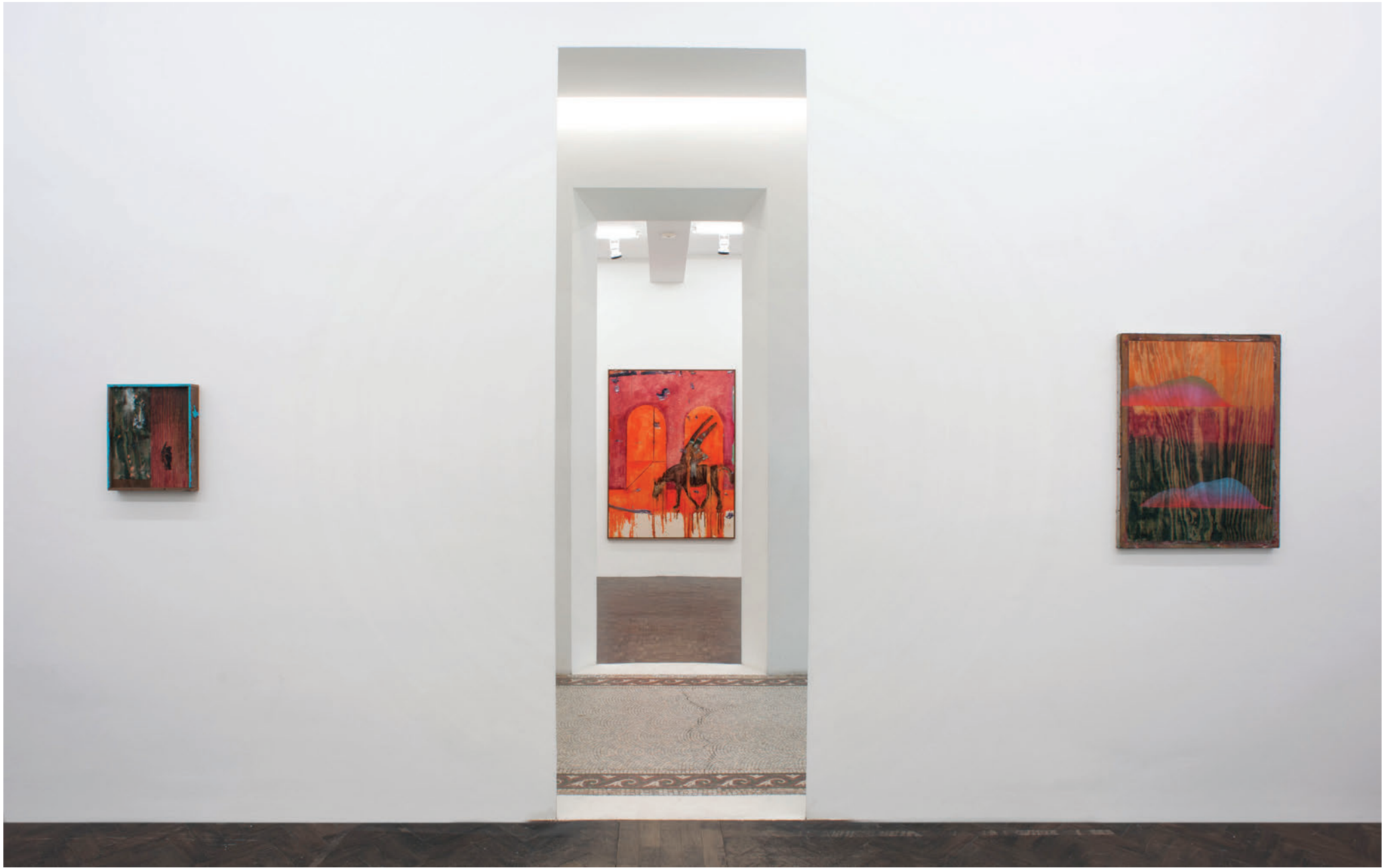
Exhibition view, My Horse for a shore , Meessen De Clercq