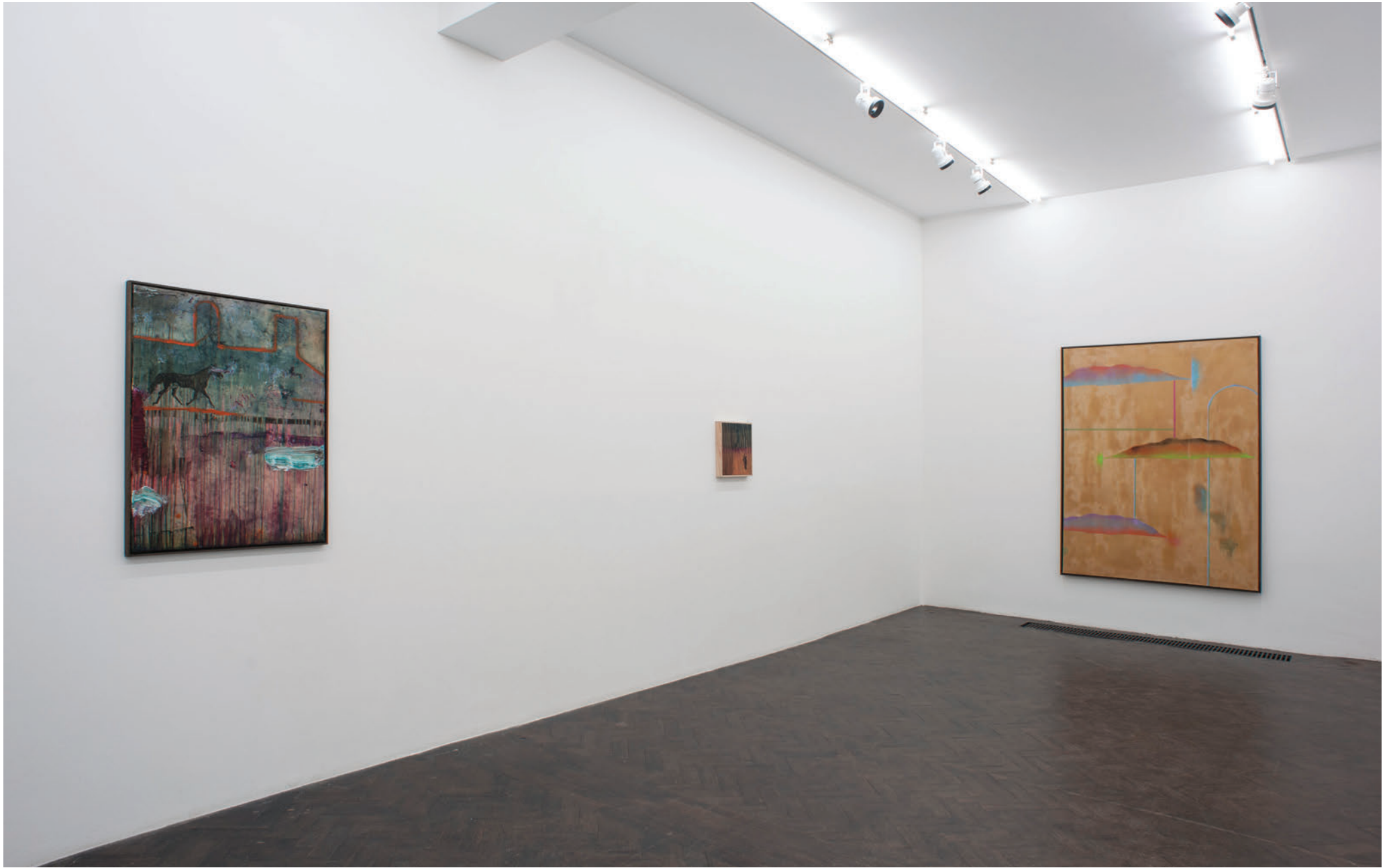
Exhibition view, My Horse for a shore , Meessen De Clercq