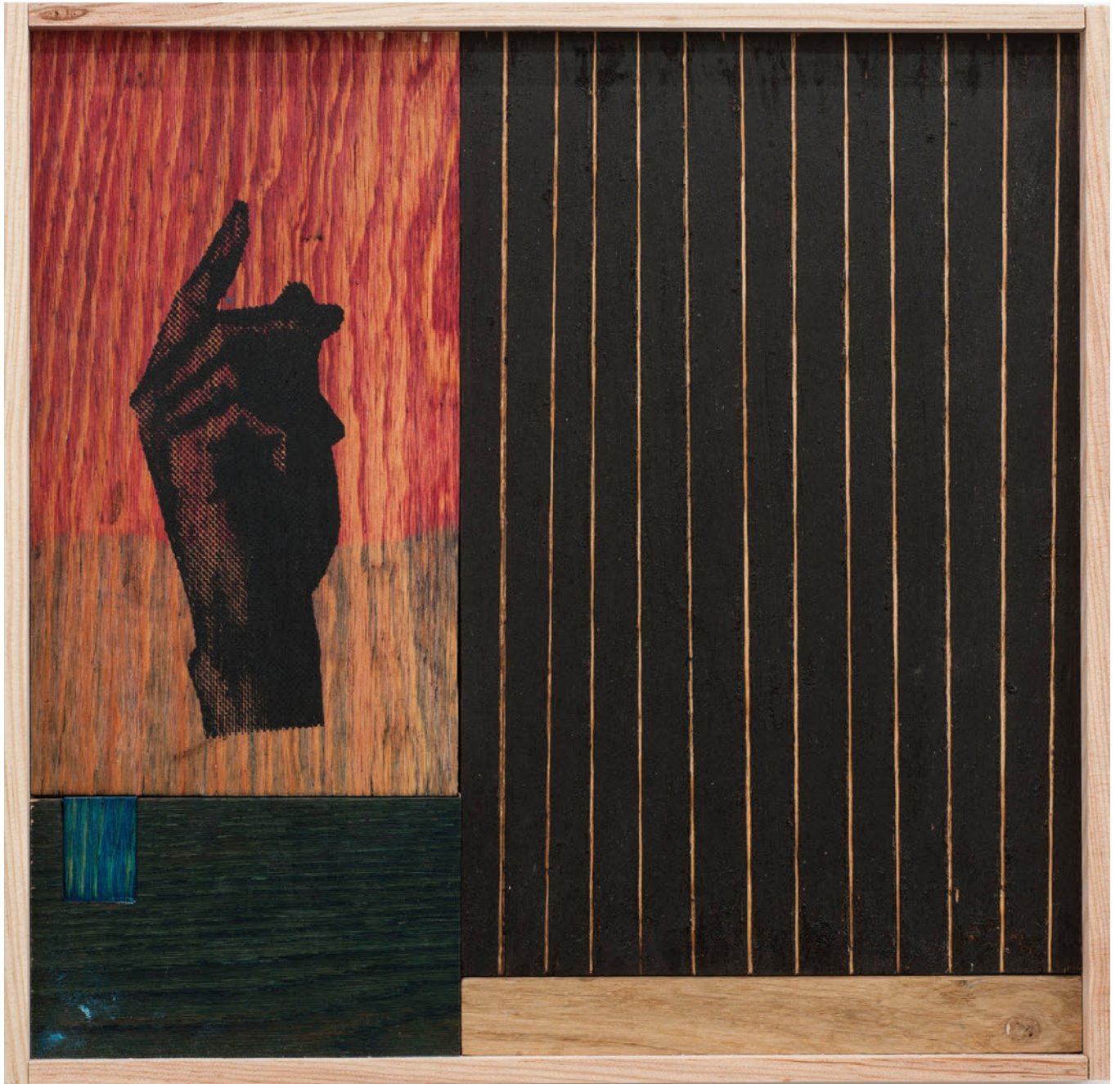
Benoît Maire Icône , 2020 Varnish on wood and oil silkscreen printing 41 x 42 x 5 cm