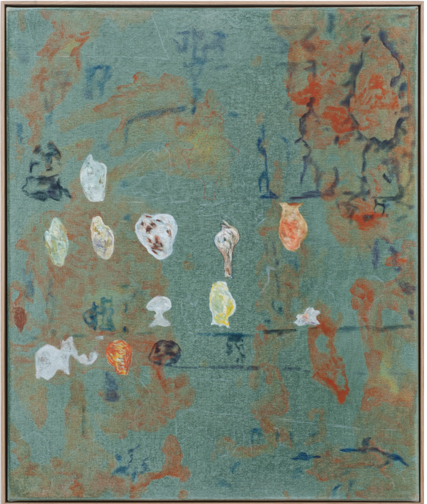
Benoît Platéus Coador, 2020 Oil on canvas 60 x 50 cm