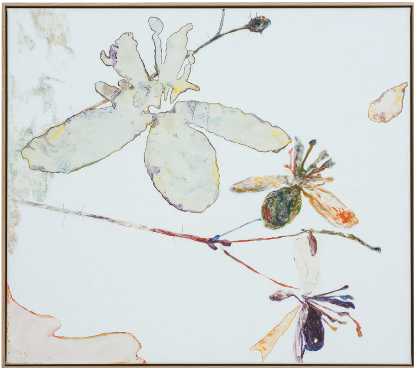
Benoît Platéus Night shop , 2020 Oil and paper on canvas 53 x 60 cm