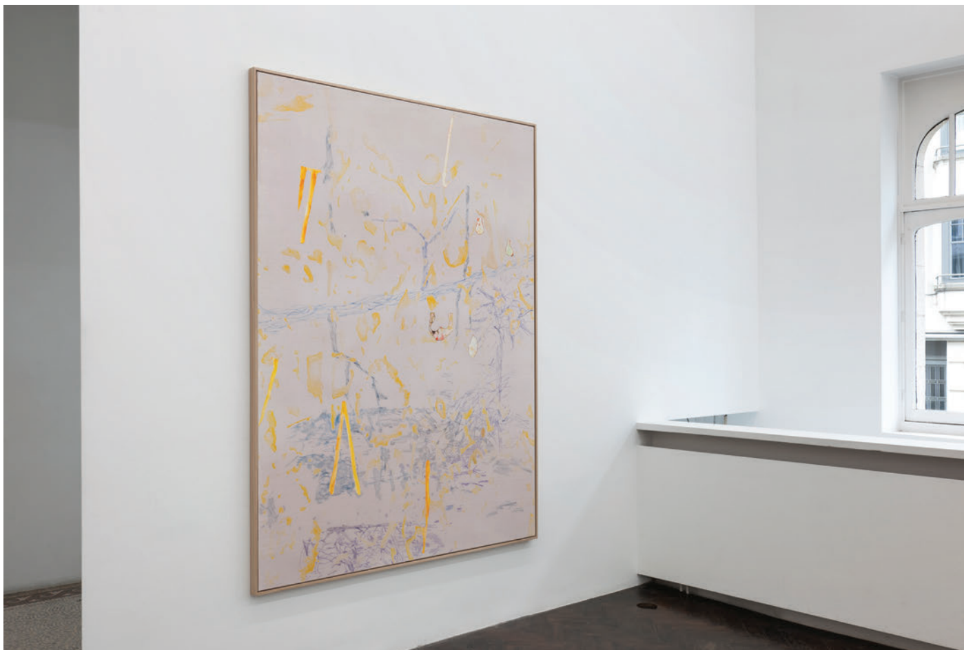
Exhibition view, Algues, tatouages et autres percolateurs , Meessen De Clercq