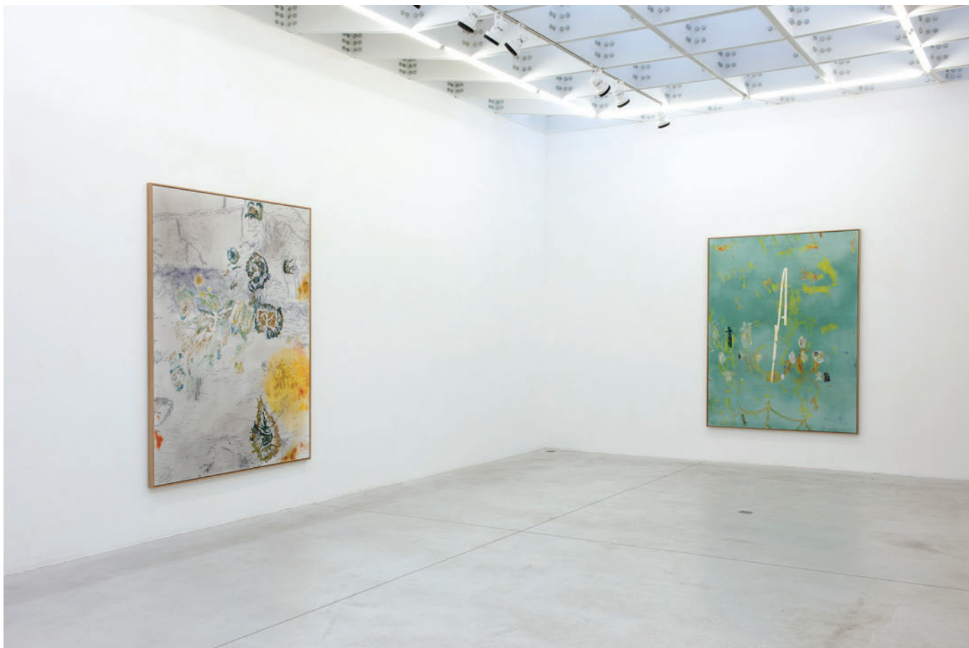
Exhibition view, Algues, tatouages et autres percolateurs , Meessen De Clercq