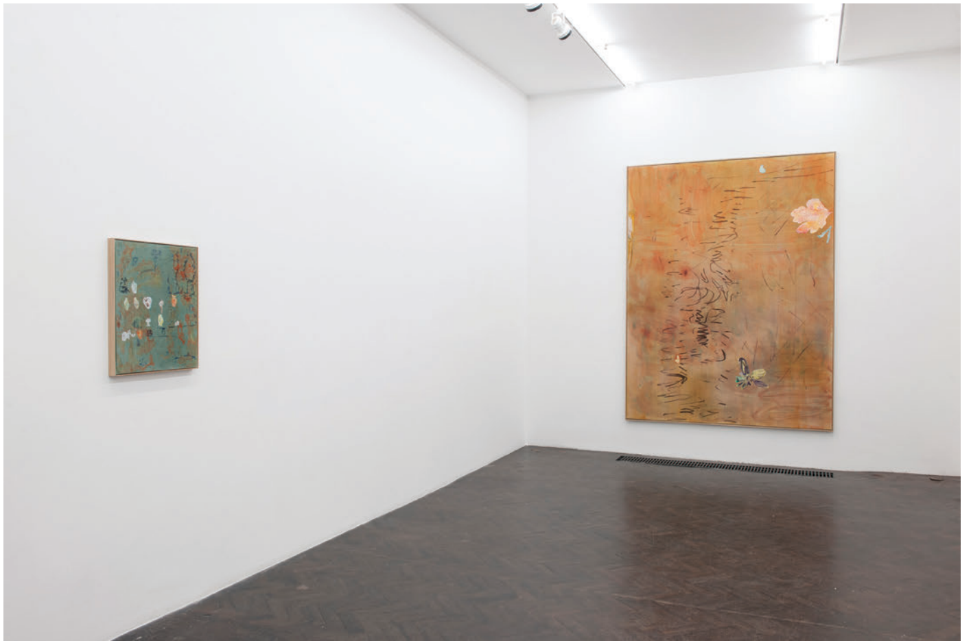
Exhibition view, Algues, tatouages et autres percolateurs , Meessen De Clercq