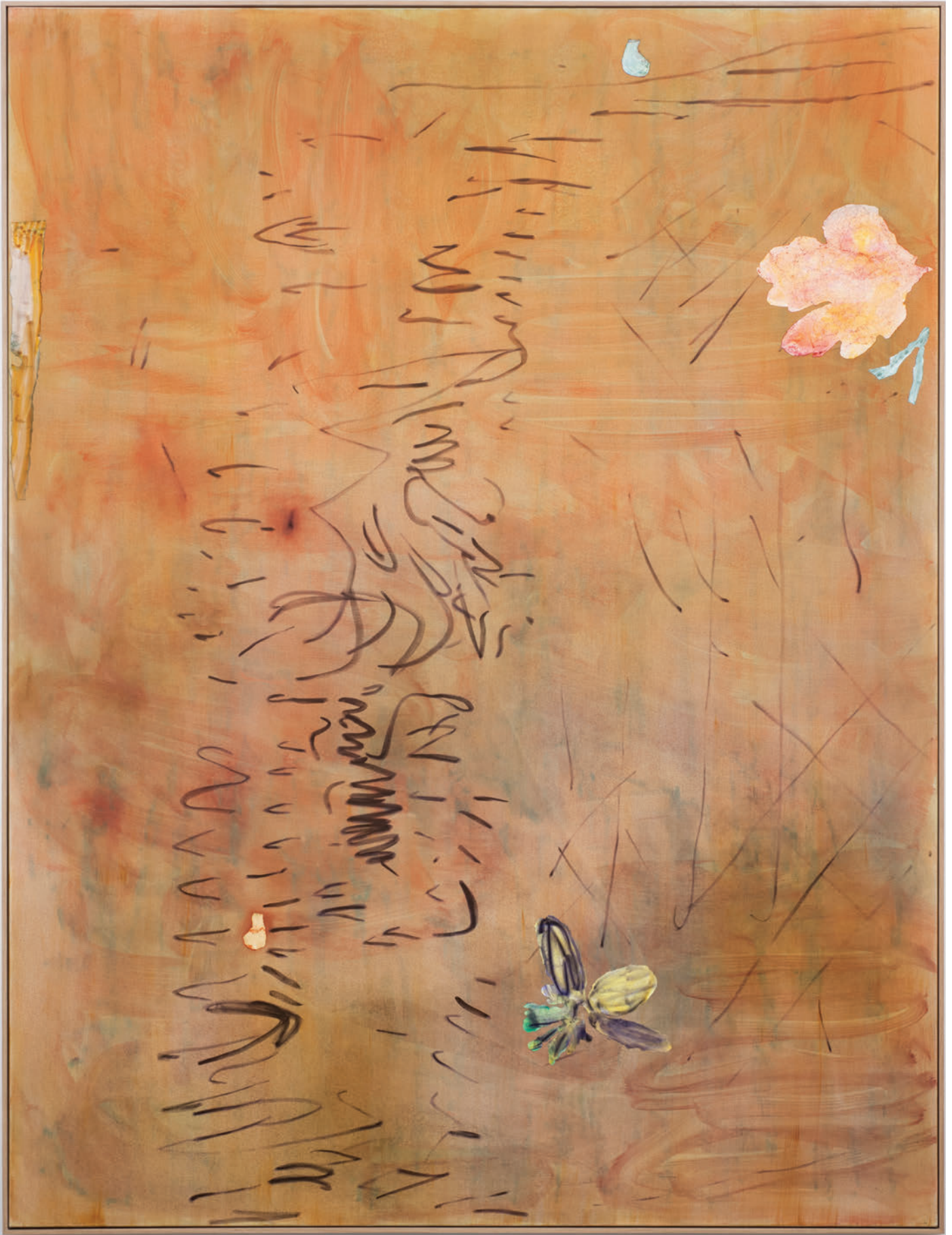
Benoît Platéus The Empathic one, 2020 Oil and paper on canvas 260 x 195 cm