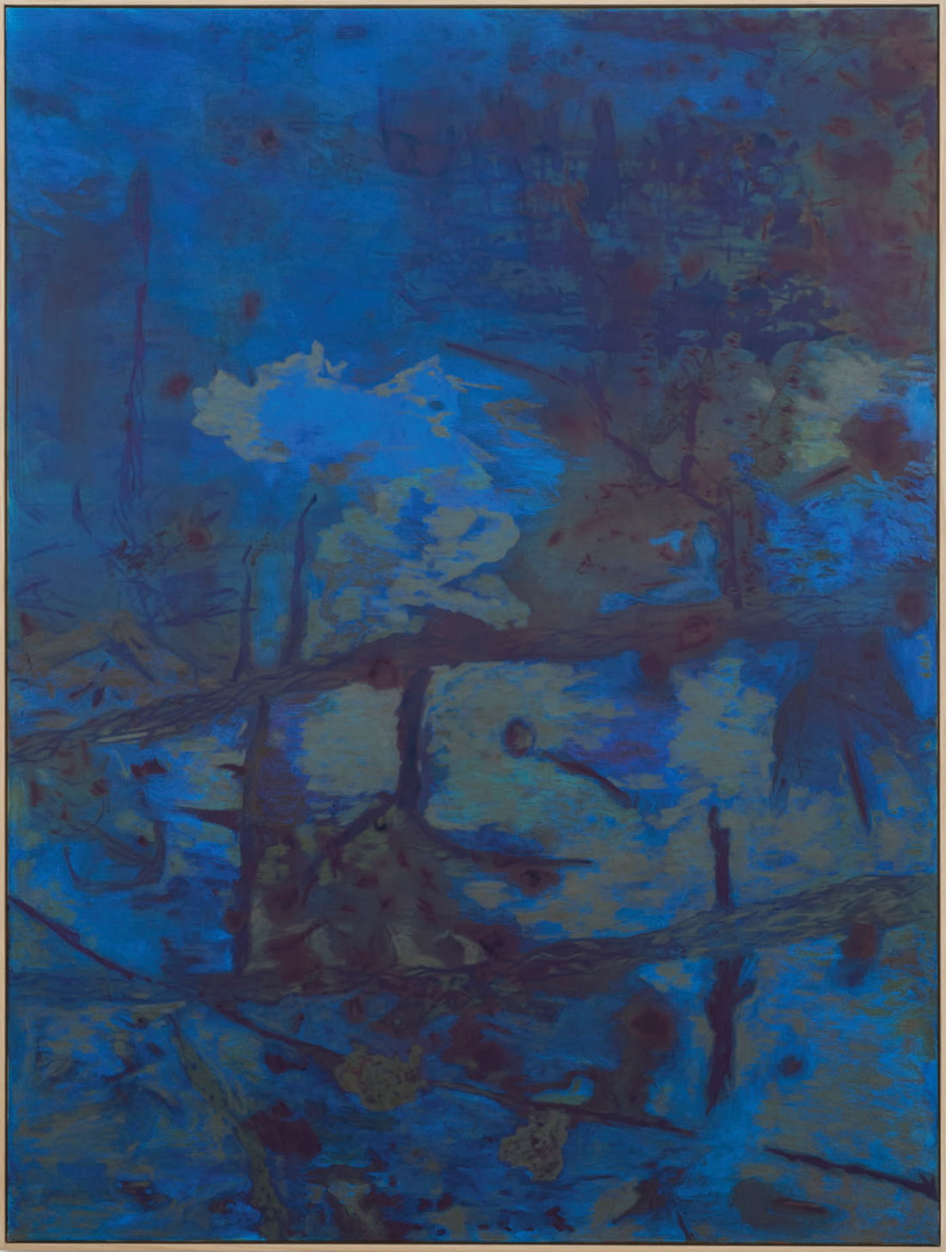
Benoît Platéus Ovozsiz, 2020 Oil on canvas 200 x 150 cm