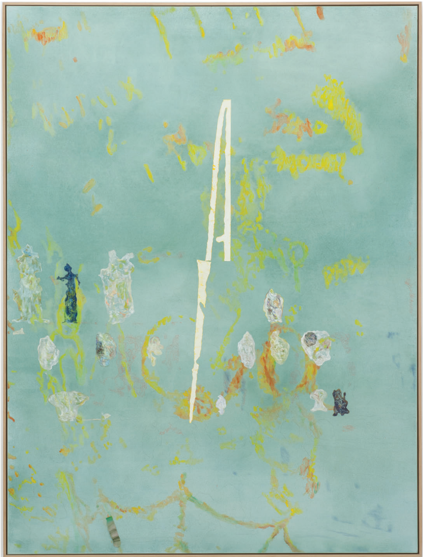
Benoît Platéus The open minded one, 2020 Oil and paper on canvas 200 x 150 cm