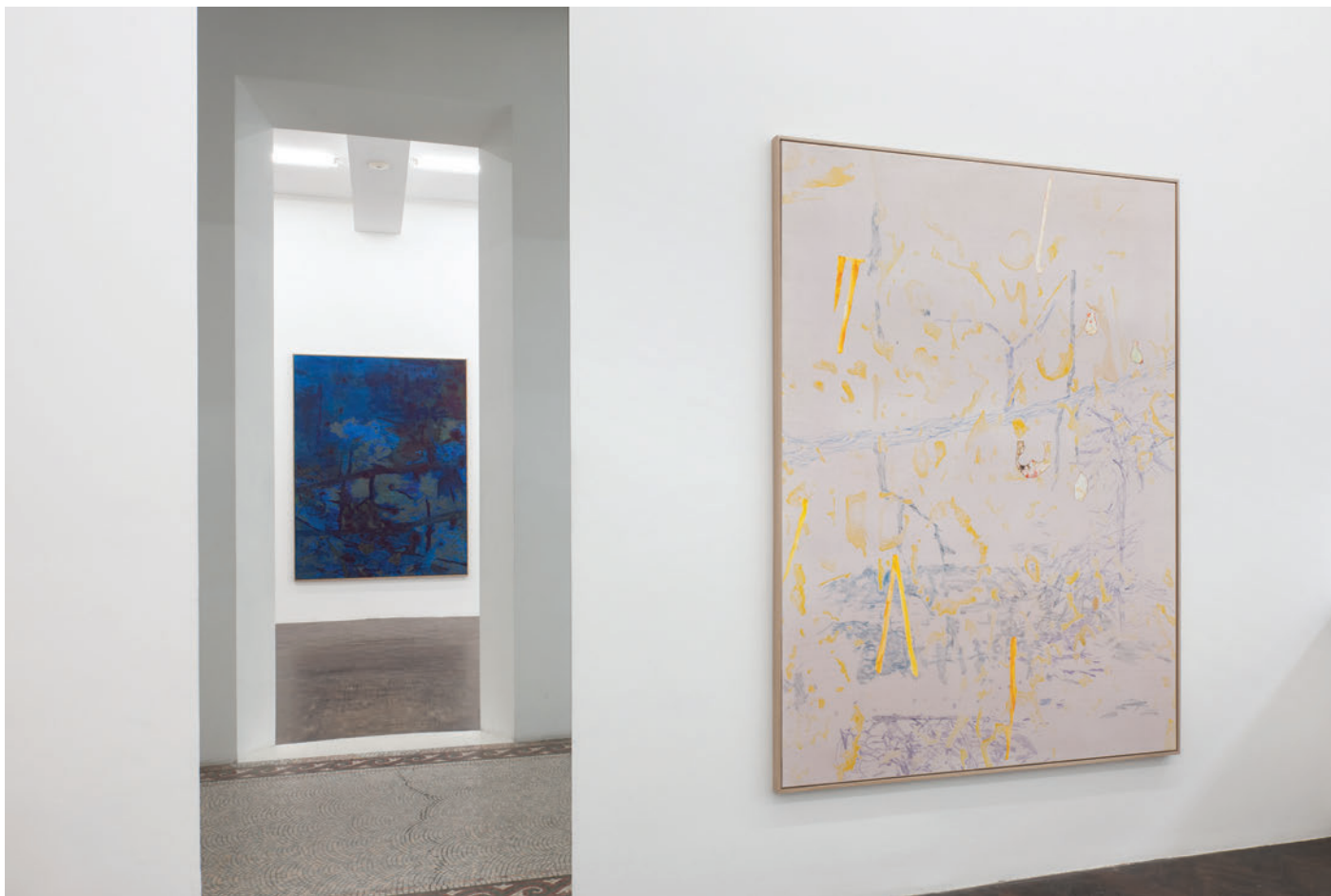
Exhibition view, Algues, tatouages et autres percolateurs , Meessen De Clercq