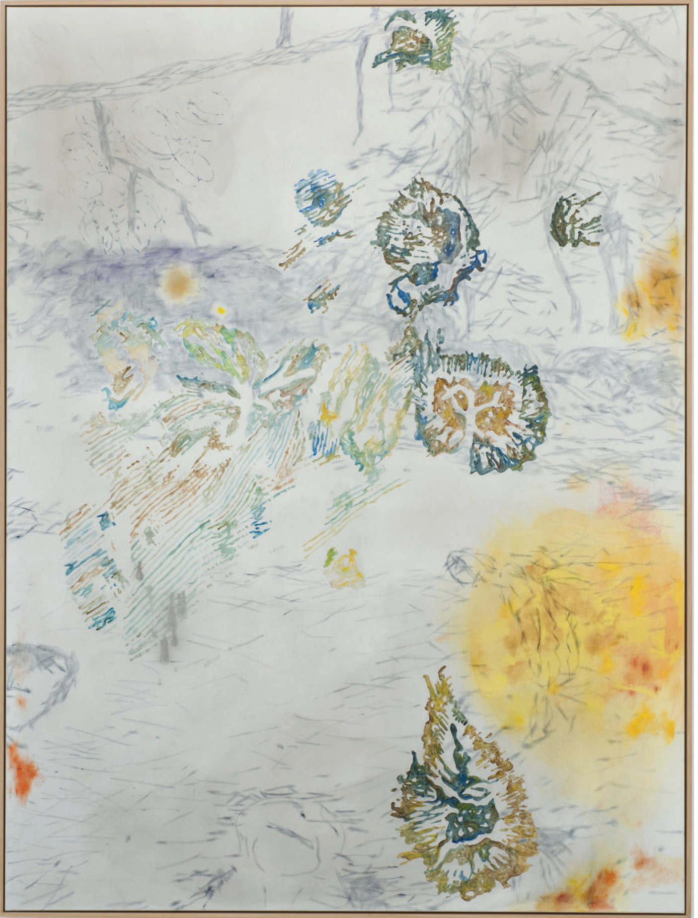
Benoît Platéus Athule, 2020 Oil on canvas 200 x 150 cm