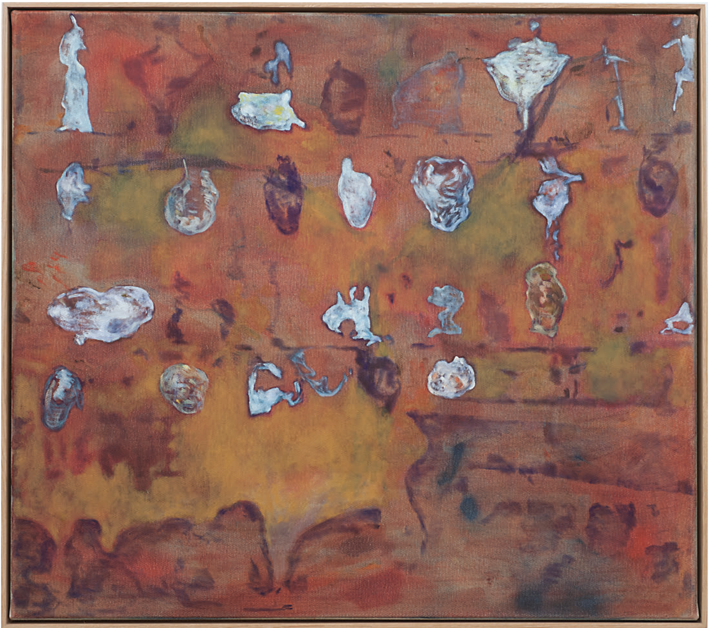
Benoît Platéus Percolador, 2020 Oil on canvas 53 x 60 cm