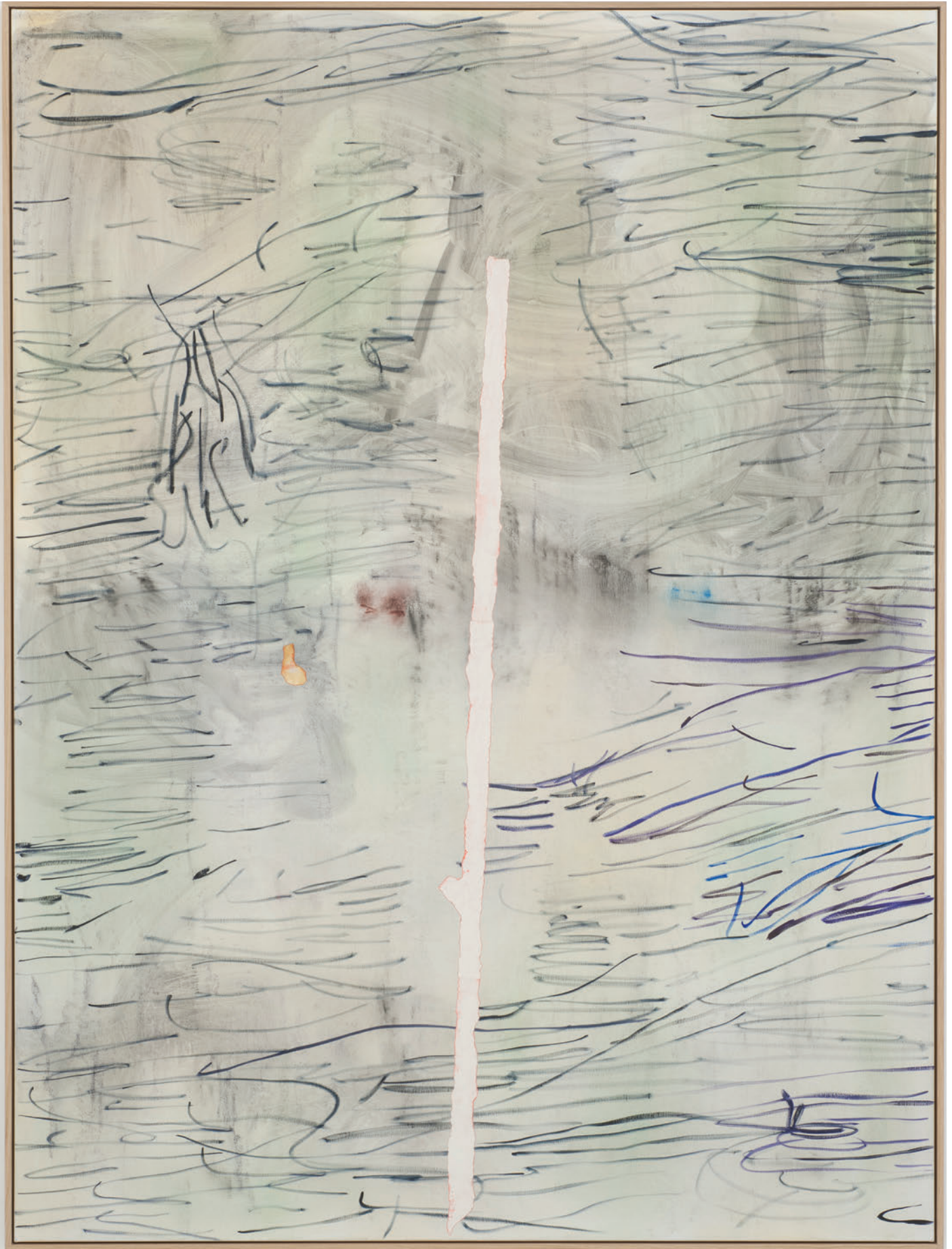
Benoît Platéus The reckless one, 2020 Oil on canvas 200 x 150 cm