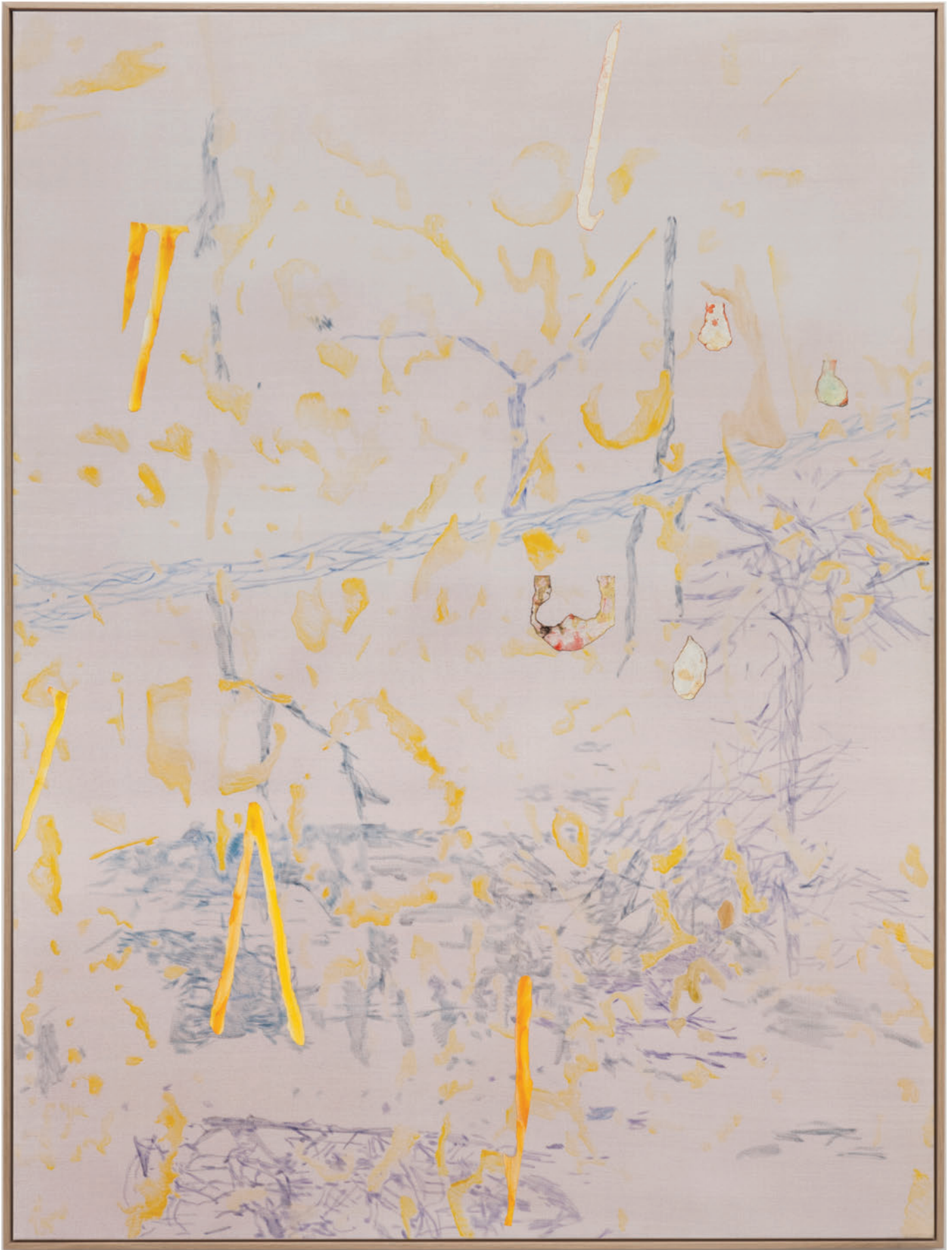
Benoît Platéus Ztlumit, 2020 Oil and paper on canvas 200 x 150 cm