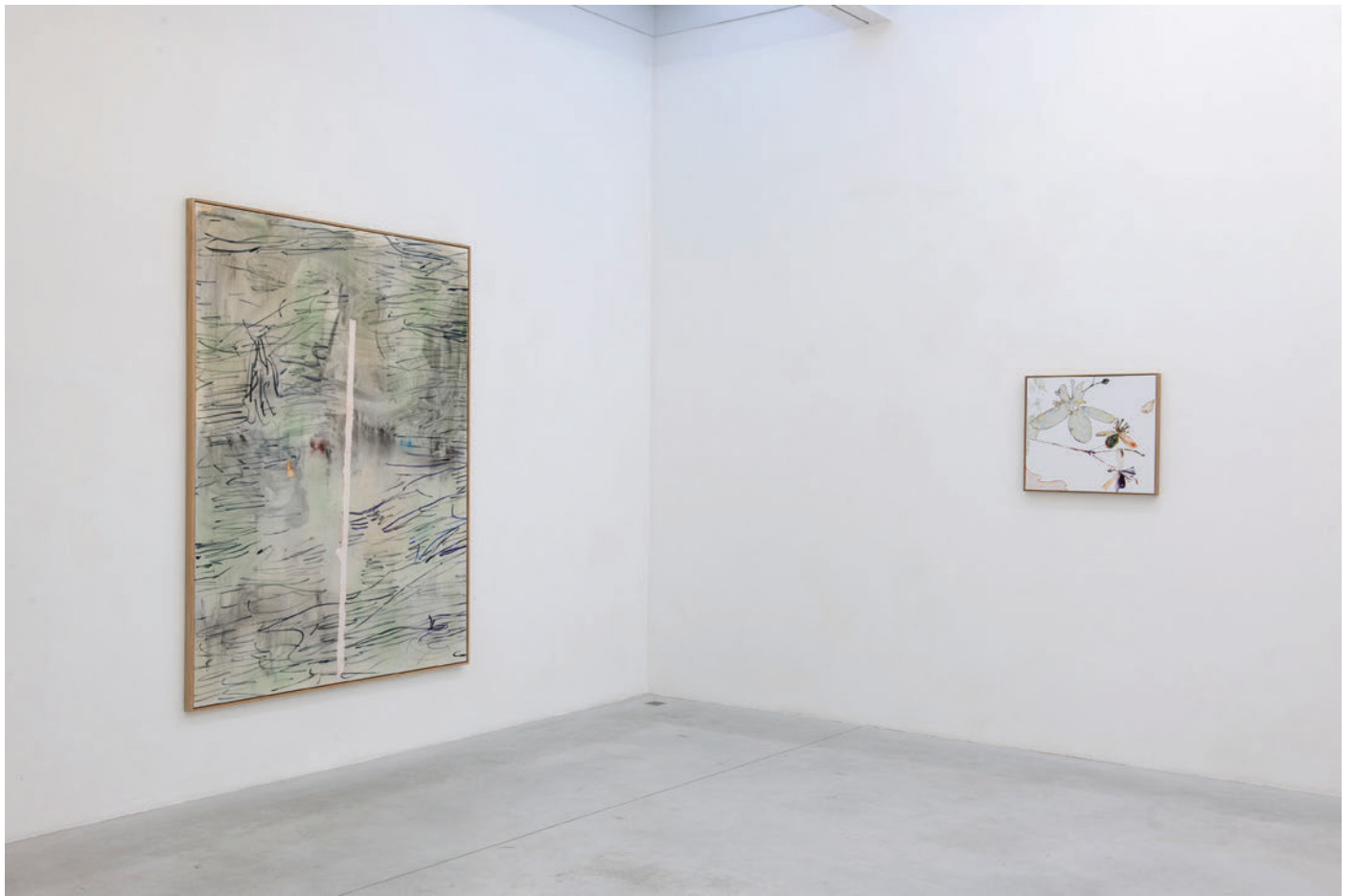
Exhibition view, Algues, tatouages et autres percolateurs , Meessen De Clercq