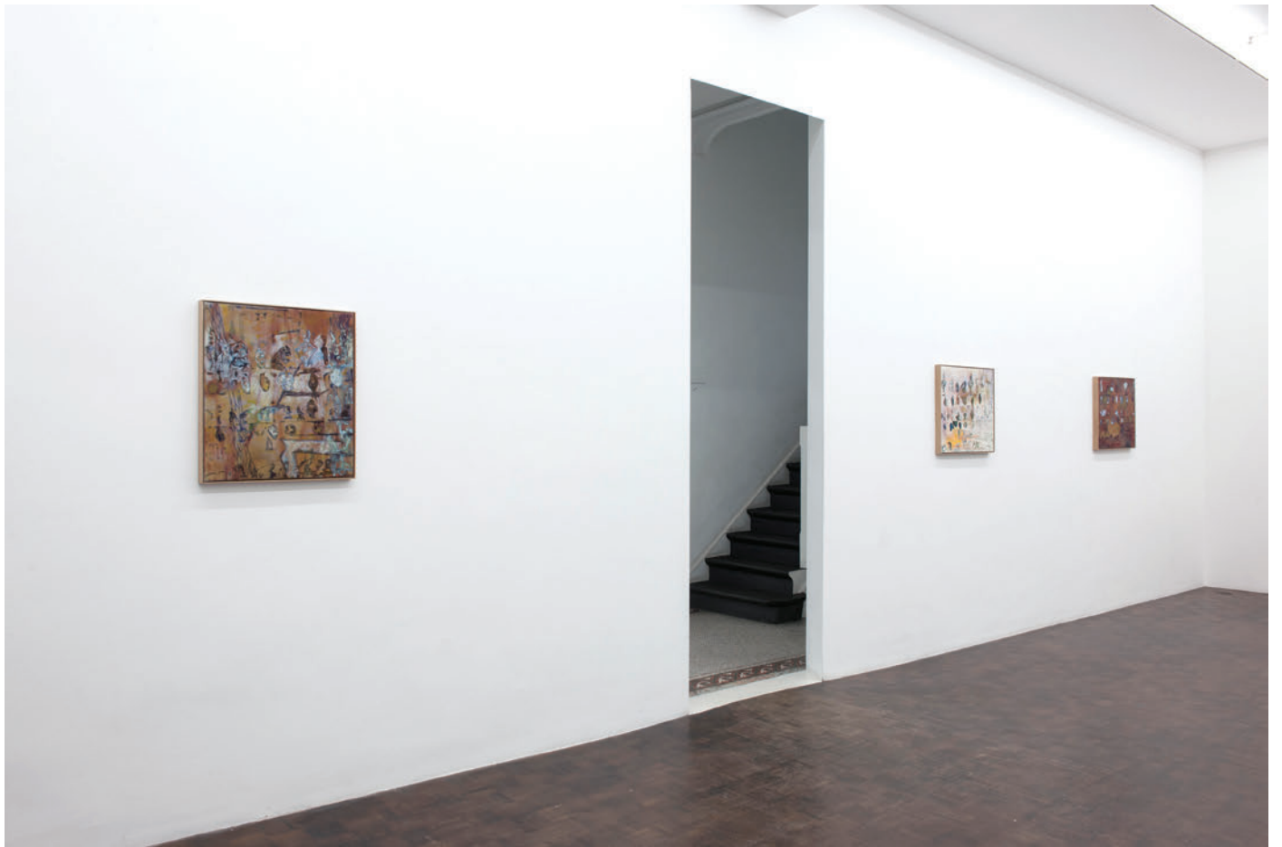
Exhibition view, Algues, tatouages et autres percolateurs , Meessen De Clercq