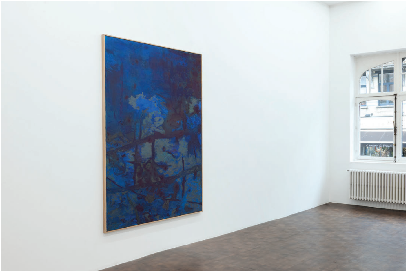
Exhibition view, Algues, tatouages et autres percolateurs , Meessen De Clercq