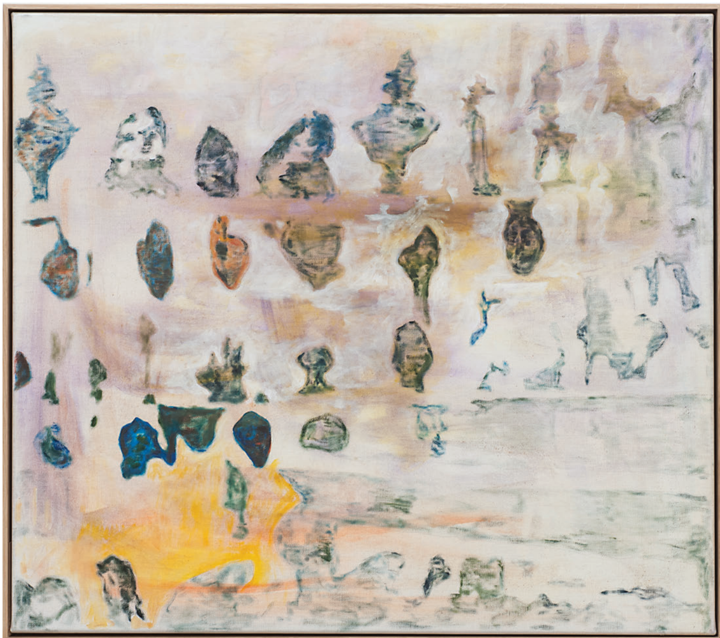
Benoît Platéus Percolatore, 2020 Oil on canvas 53 x 60 cm