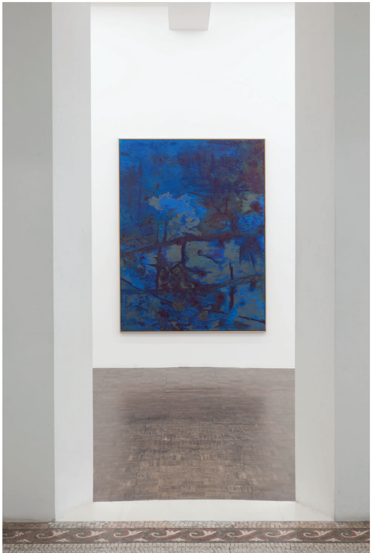
Exhibition view, Algues, tatouages et autres percolateurs , Meessen De Clercq