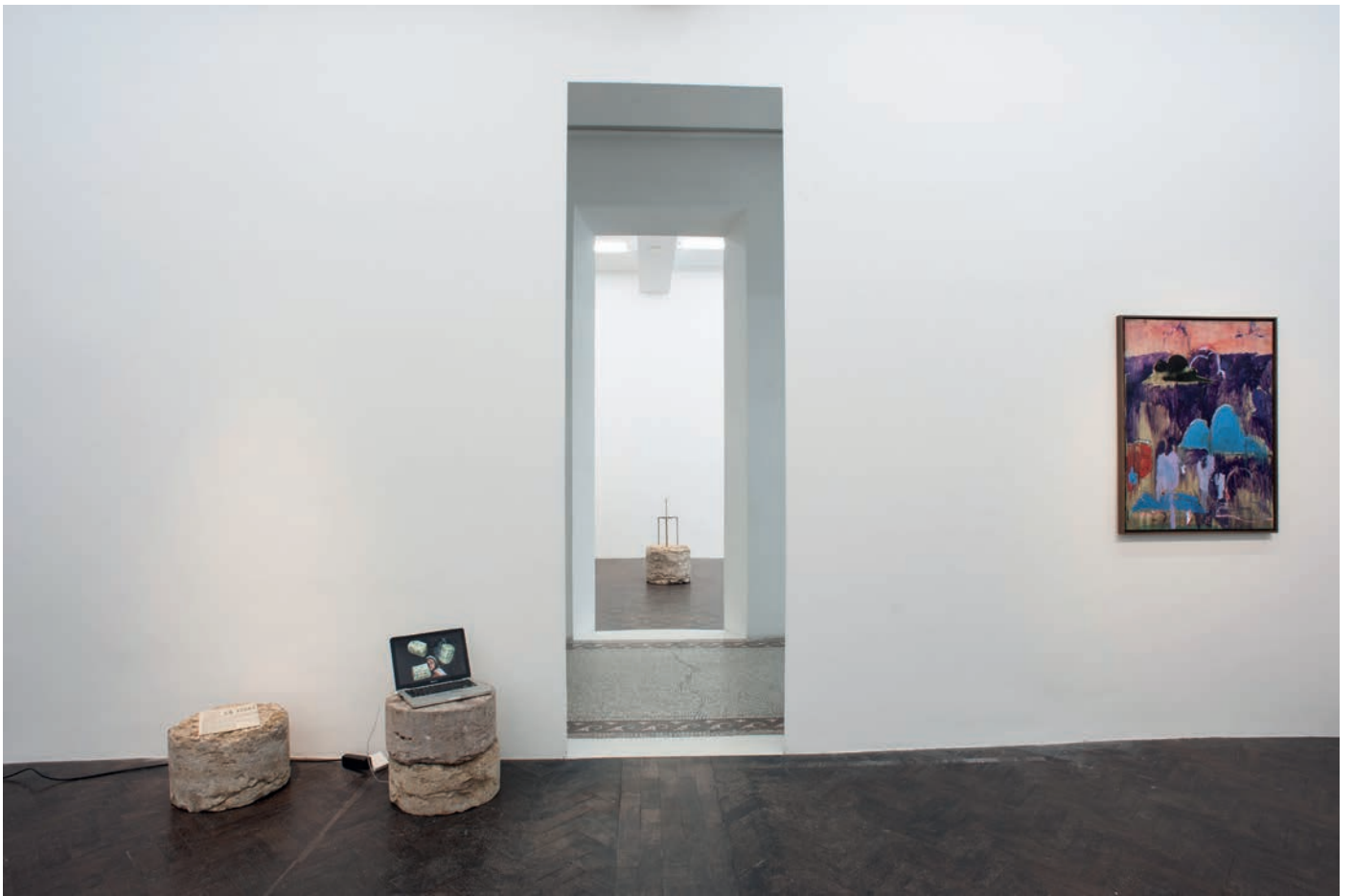
morceaux de soleil, exhibition view, Meessen De Clercq, 2018