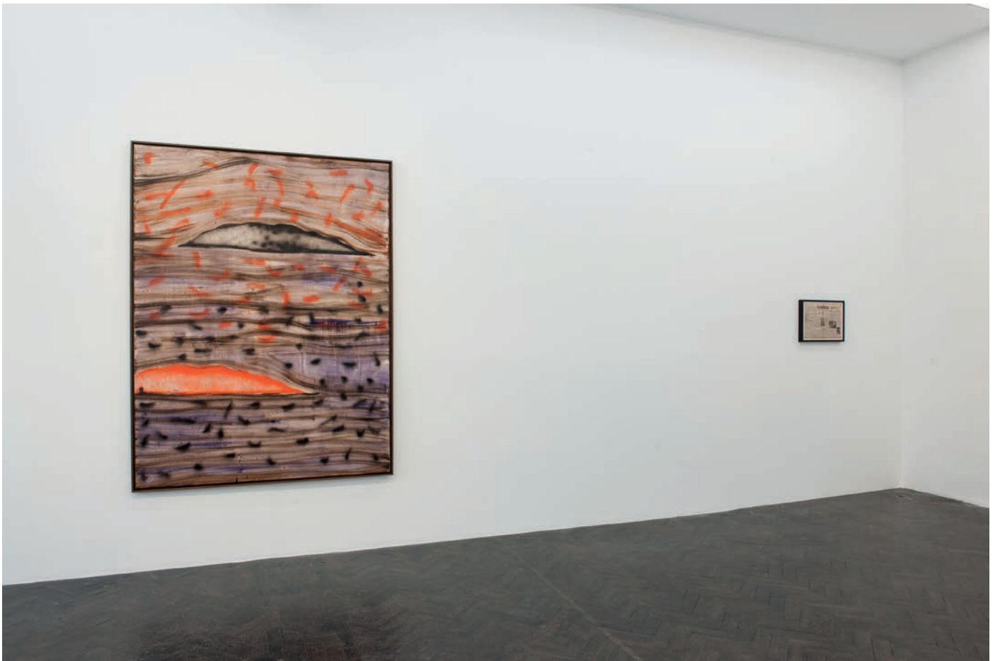
morceaux de soleil, exhibition view, Meessen De Clercq, 2018