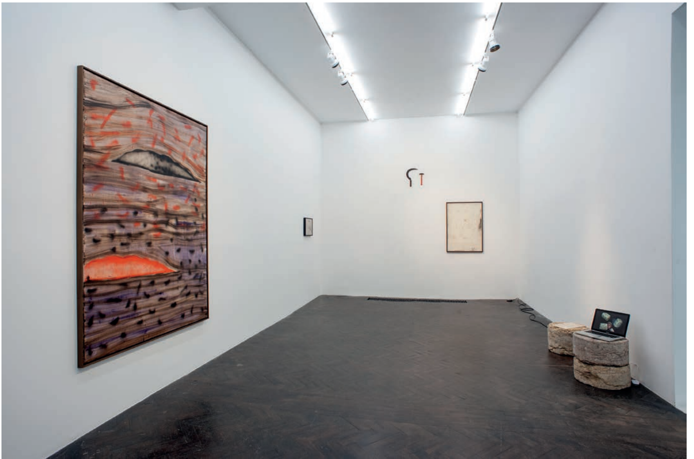
morceaux de soleil, exhibition view, Meessen De Clercq, 2018