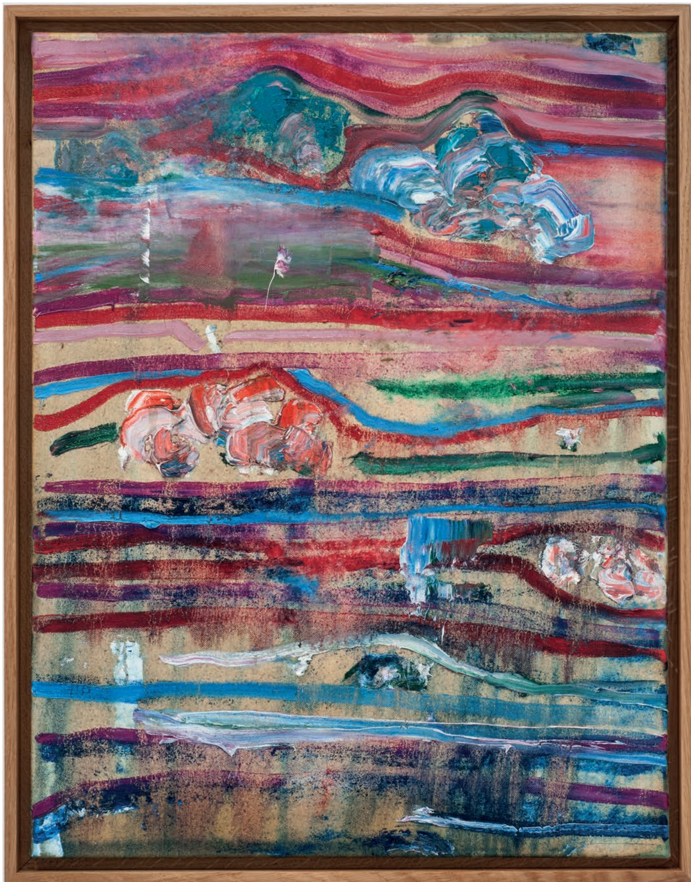
Benoît Maire Peinture de nuages, 2018 Oil on canvas 65 x 50 cm