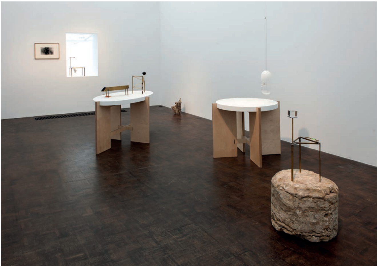
morceaux de soleil, exhibition view, Meessen De Clercq, 2018