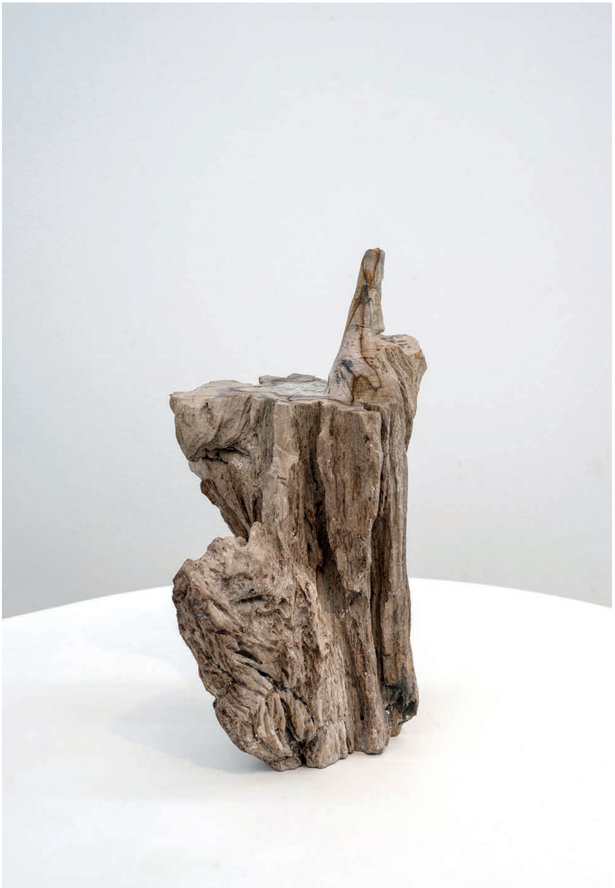
Benoît Maire Main, 2018 Fossilised wood 37 x 23 x 19 cm