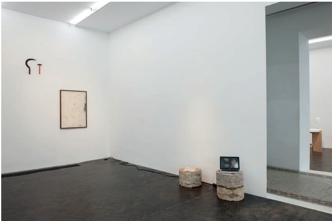
morceaux de soleil, exhibition view, Meessen De Clercq, 2018