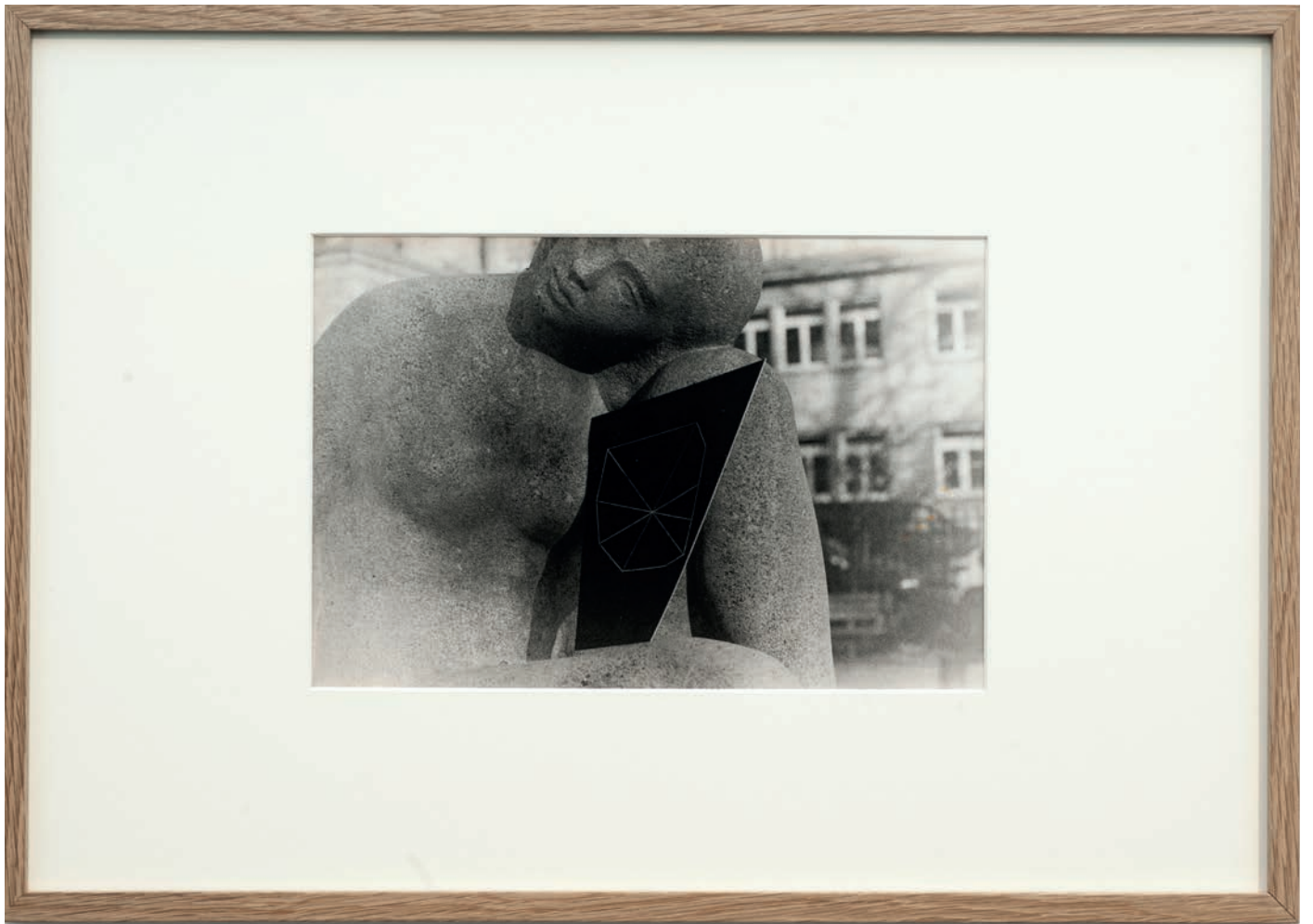
Benoît Maire Portrait incomplet de Falke Pisano , 2008 Silverprint, oak frame 36 x 51,5 cm (framed) Edition of 3 + 1 AP