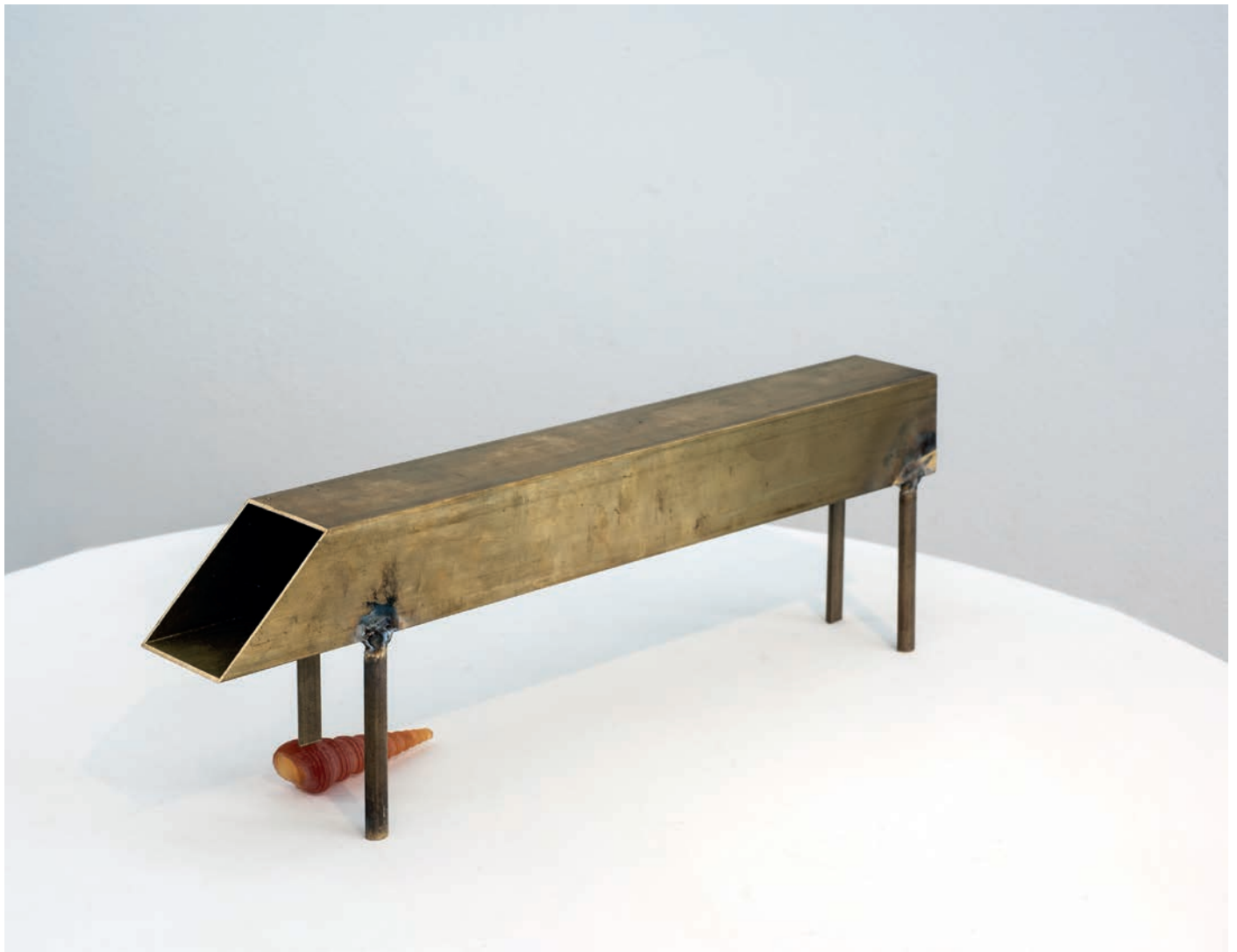
Benoît Maire Château , 2018 Brass and glass shell 16 x 48,5 x 7 cm