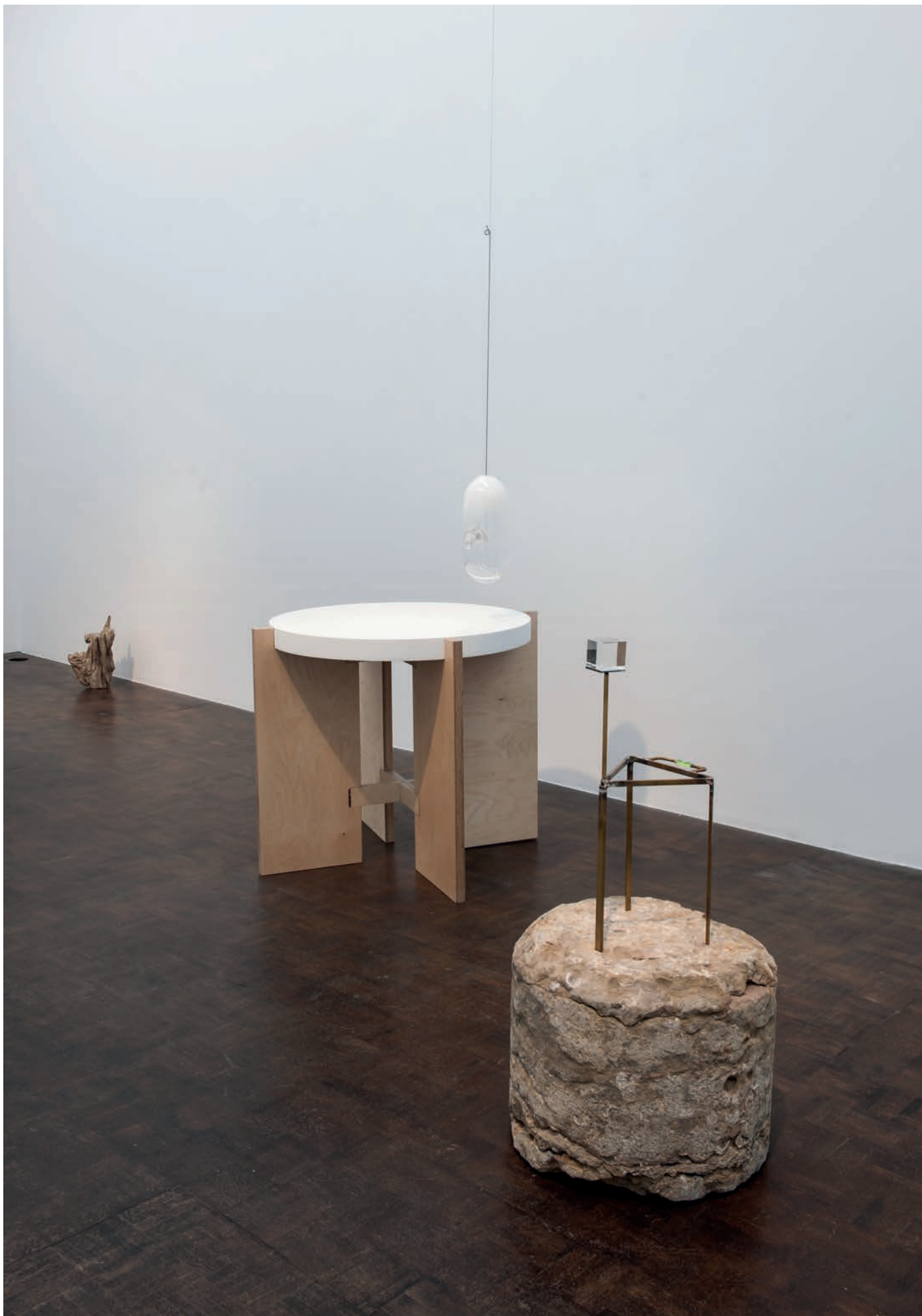
morceaux de soleil, exhibition view, Meessen De Clercq, 2018