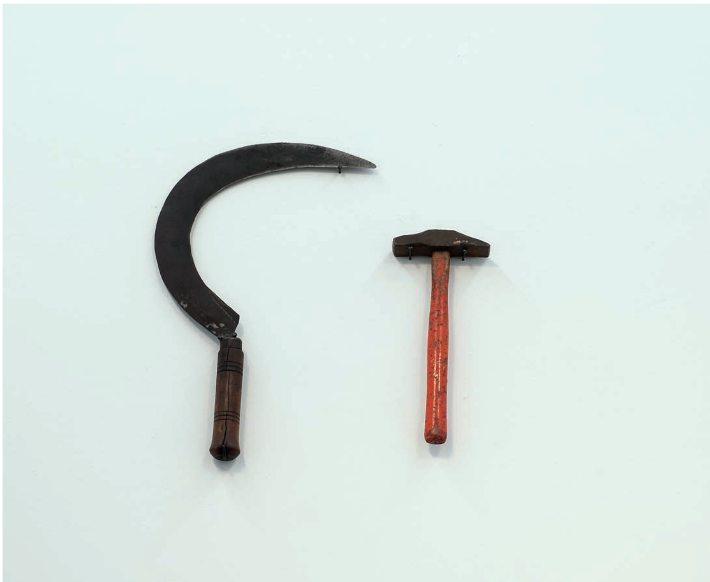
Benoît Maire Désunion , 2018 Sickle and hammer, metal and wood Dimensions variables