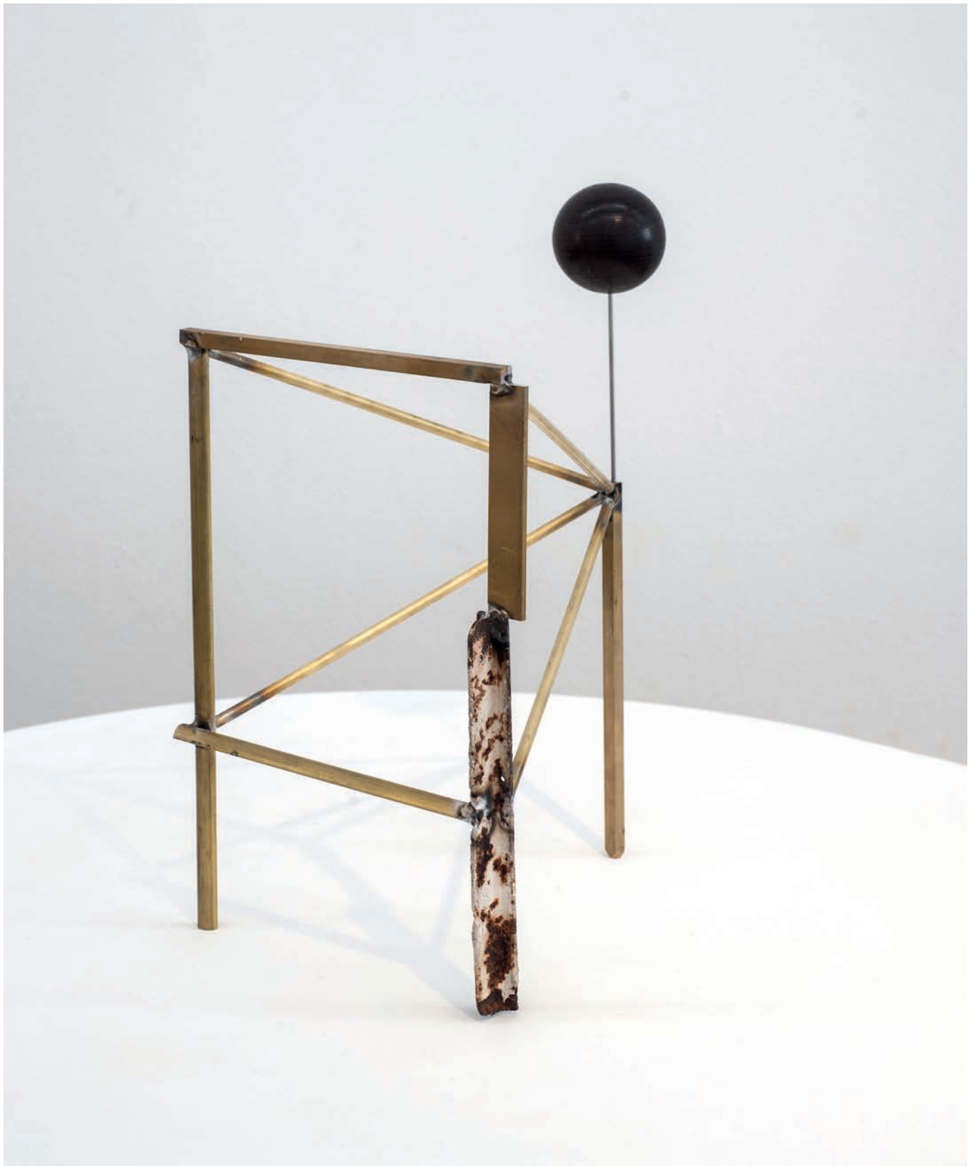
Benoît Maire Château , 2018 Brass, metal and turned wood 37 x 26 x 20,5 cm