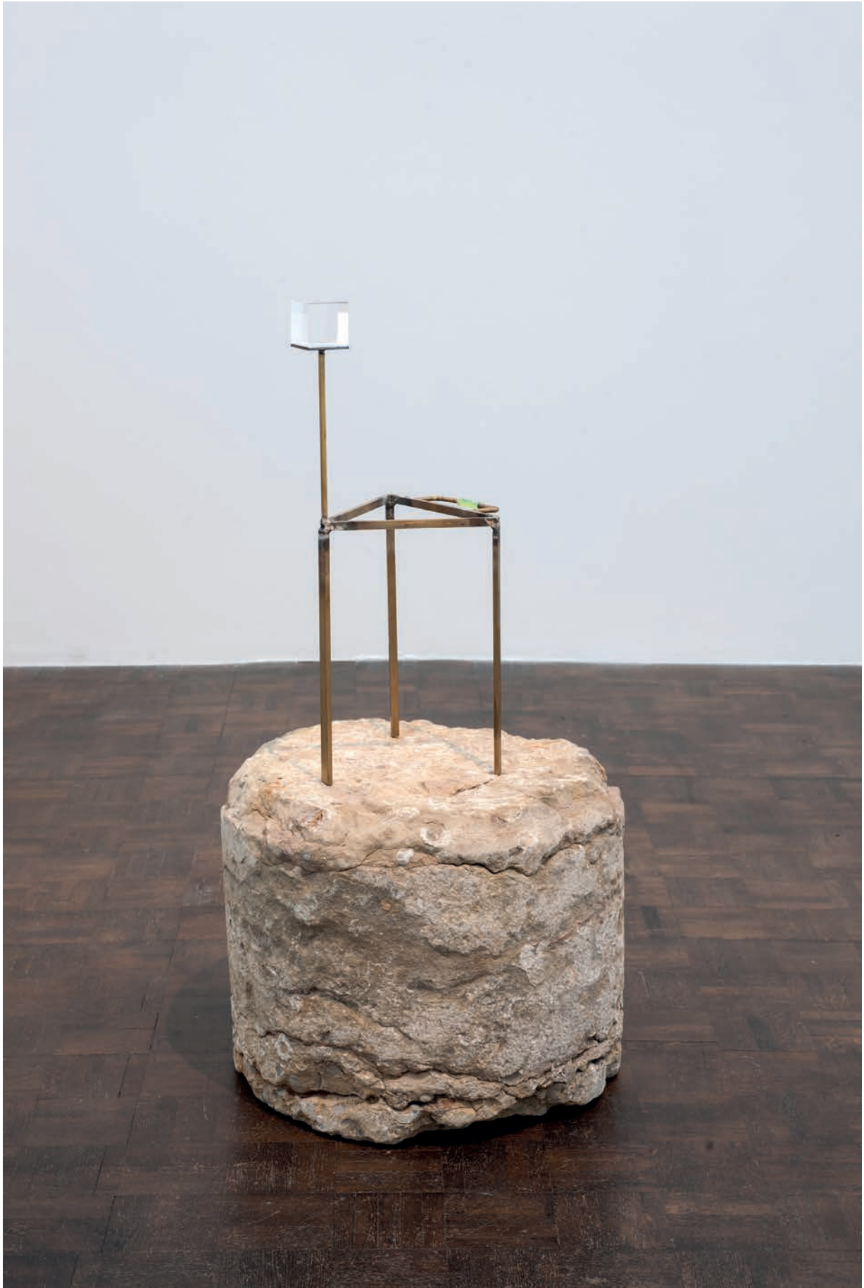
Benoît Maire Château sur tambour , 2018 Brass, optical glass, tambour of a column 95 x 47 x 47 cm