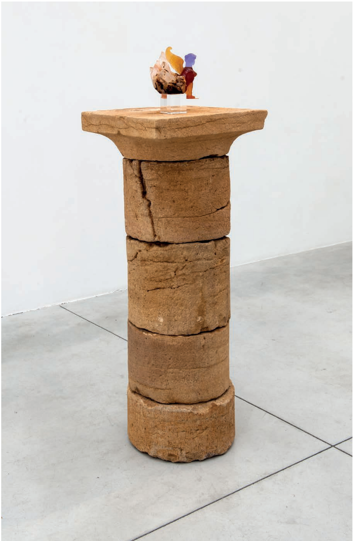
Benoît Maire Sphinx sur colonne , 2018 Optical glass, crystal, smokey quartz, tambour in bourgogne stone 138 x 45,5 x 45,5 cm