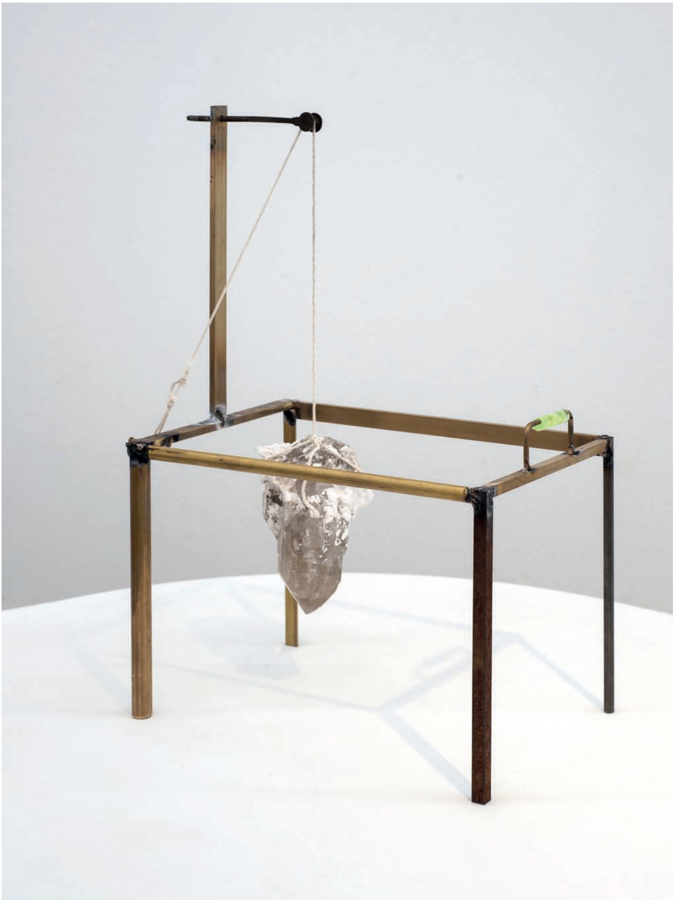
Benoît Maire Château , 2018 Brass, metal, string, quartz and plaster 47,5 x 31 x 21,5 cm