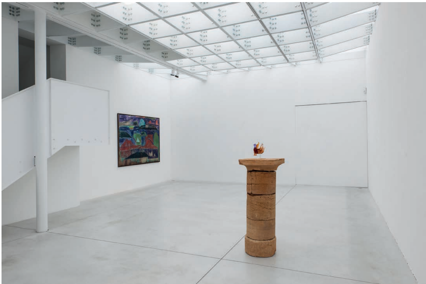
morceaux de soleil, exhibition view, Meessen De Clercq, 2018