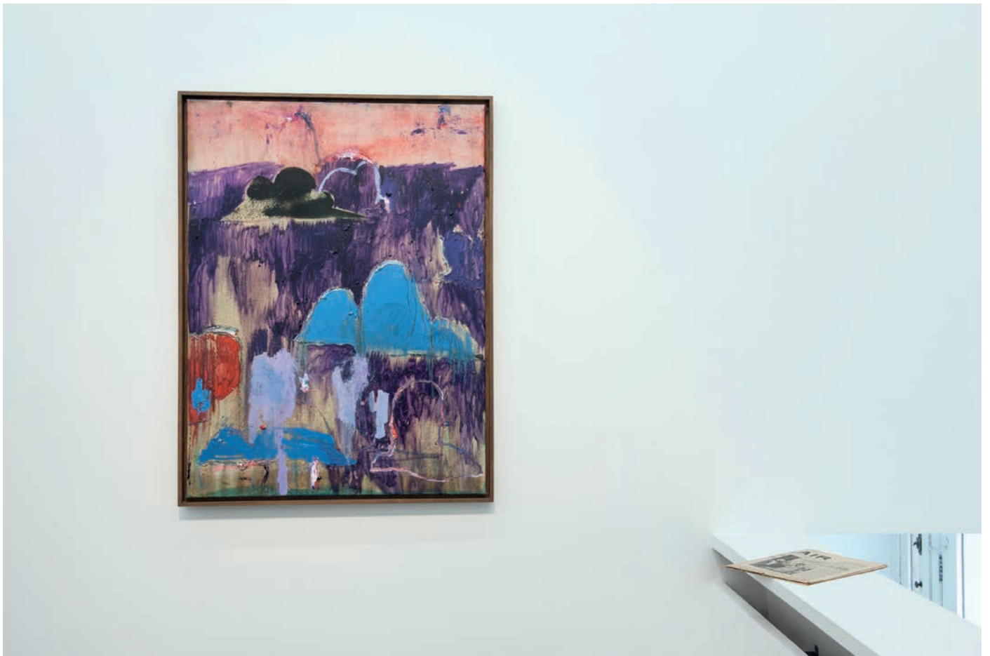
morceaux de soleil, exhibition view, Meessen De Clercq, 2018