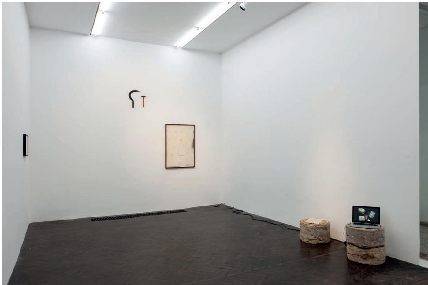
morceaux de soleil, exhibition view, Meessen De Clercq, 2018