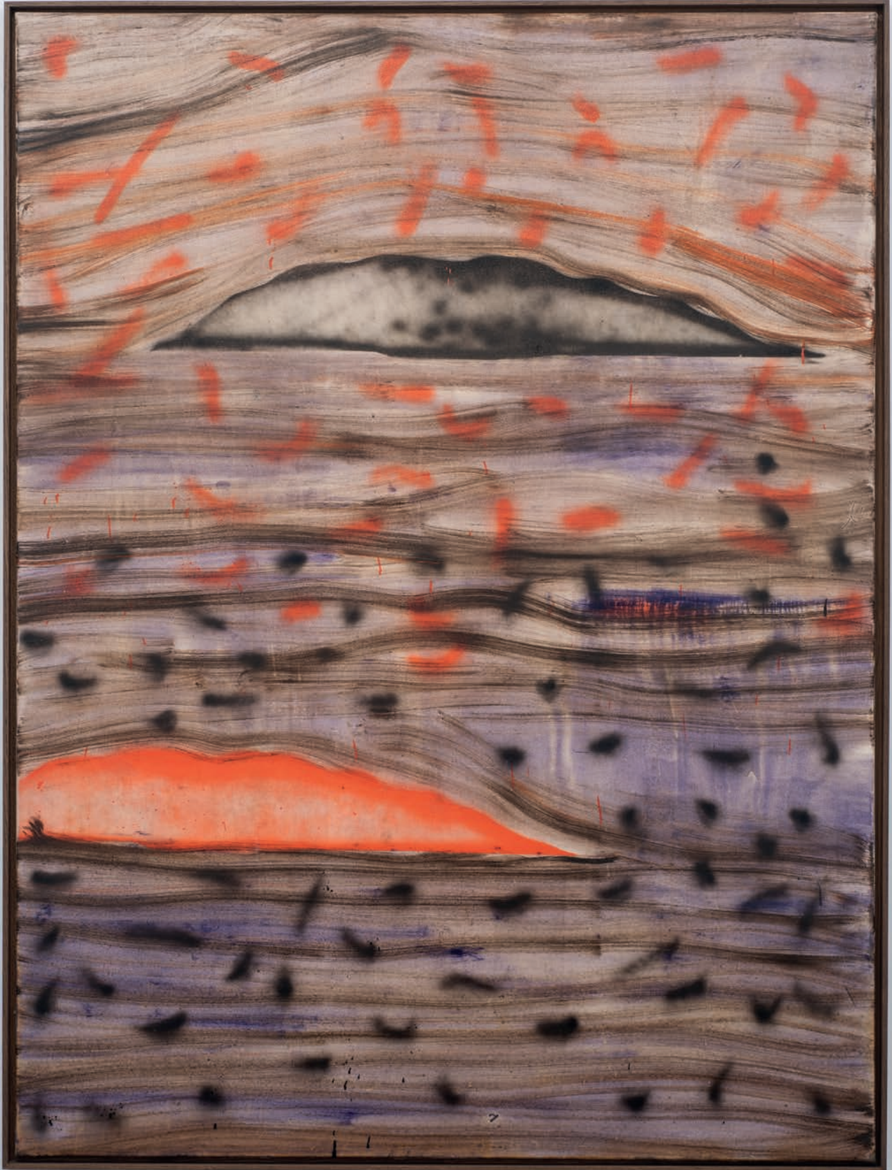
Benoît Maire Peinture de nuages, 2018 Oil on canvas 200 x 150 cm (framed)