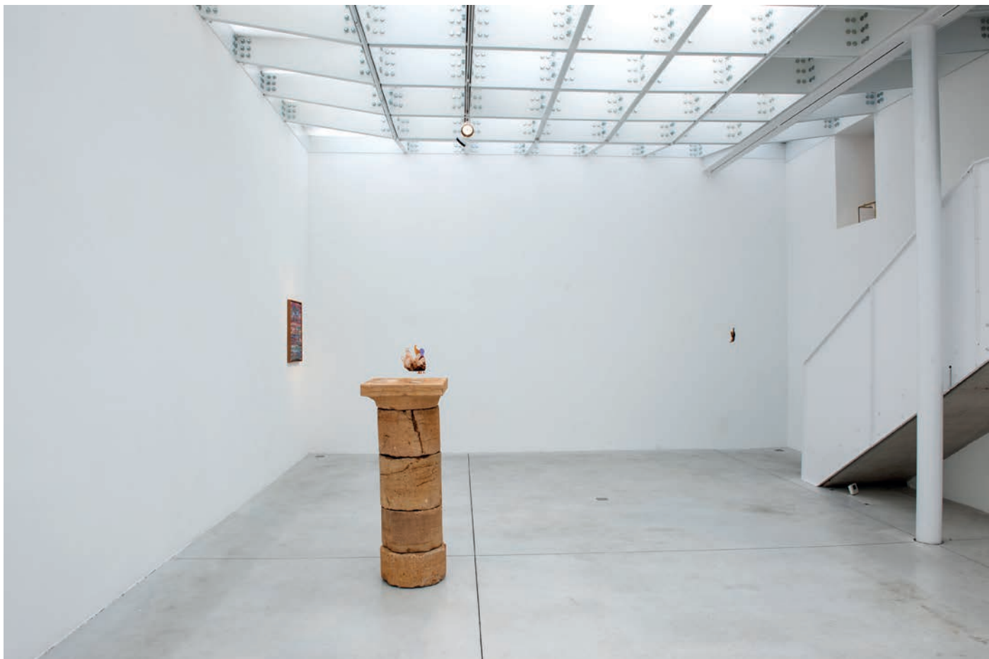
morceaux de soleil, exhibition view, Meessen De Clercq, 2018