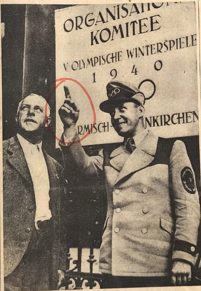
FONCTIONNAIRE DES JEUX OLYMPIQUES D'HIVER ET DÉJÀ EN UNIFORME...

Londres, 15 août. ondoniens autorisés politique du Gou- nique sur la ques- qui a été définie, clairement, n'a qu'il reste ainsi toute solution du grait acceptable serait bien, ac-