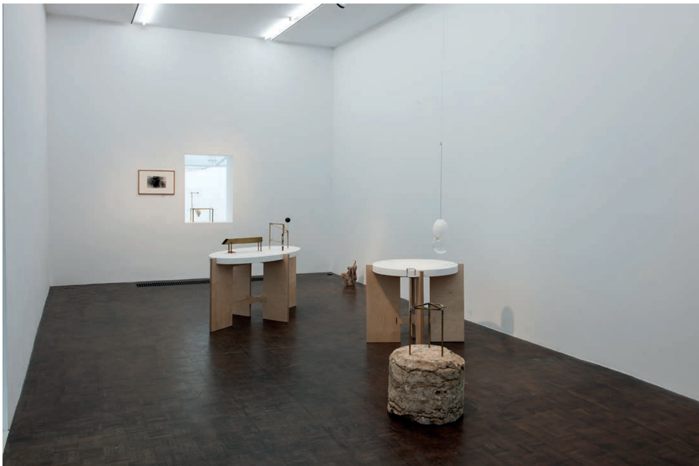
morceaux de soleil, exhibition view, Meessen De Clercq, 2018