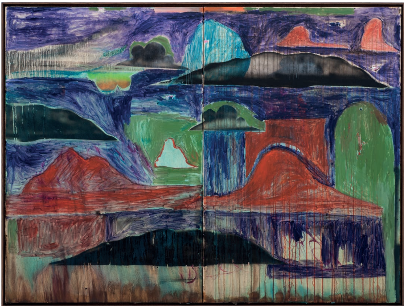
Benoît Maire Peinture de nuages, 2018 Oil on canvas 150 x 200 cm