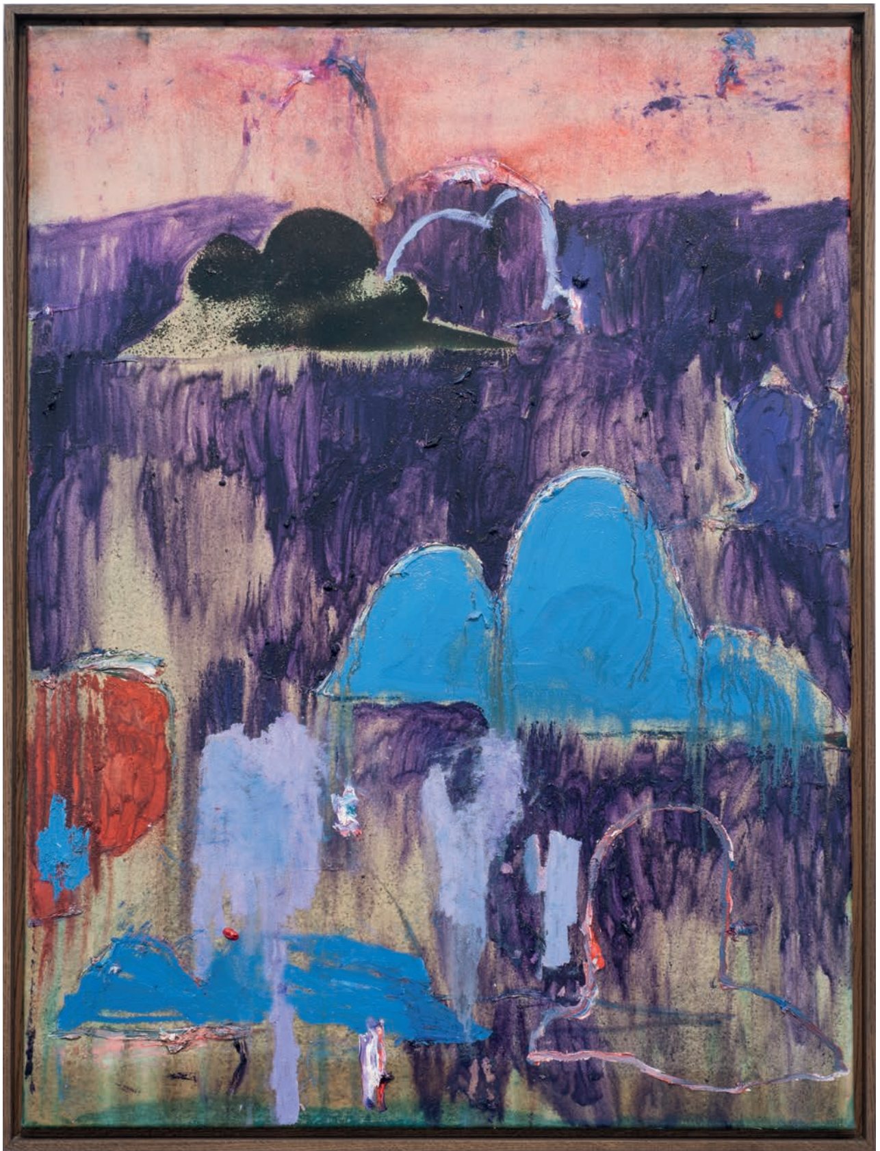
Benoît Maire Peinture de nuages, 2018 Oil on canvas 100 x 75 cm