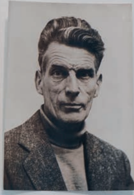
Benoît Maire Portrait de Samuel Beckett, 1957 Black and white photographic print 12 x 9 cm