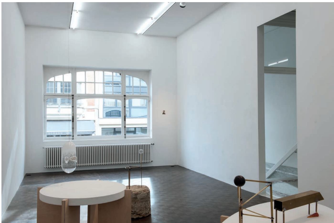
morceaux de soleil, exhibition view, Meessen De Clercq, 2018