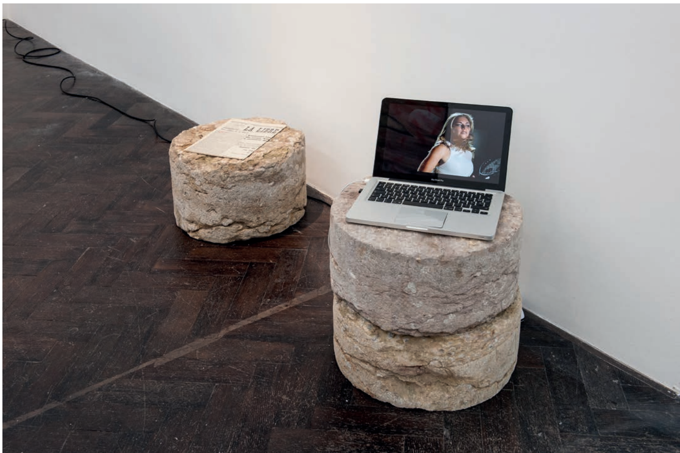
morceaux de soleil, exhibition view, Meessen De Clercq, 2018