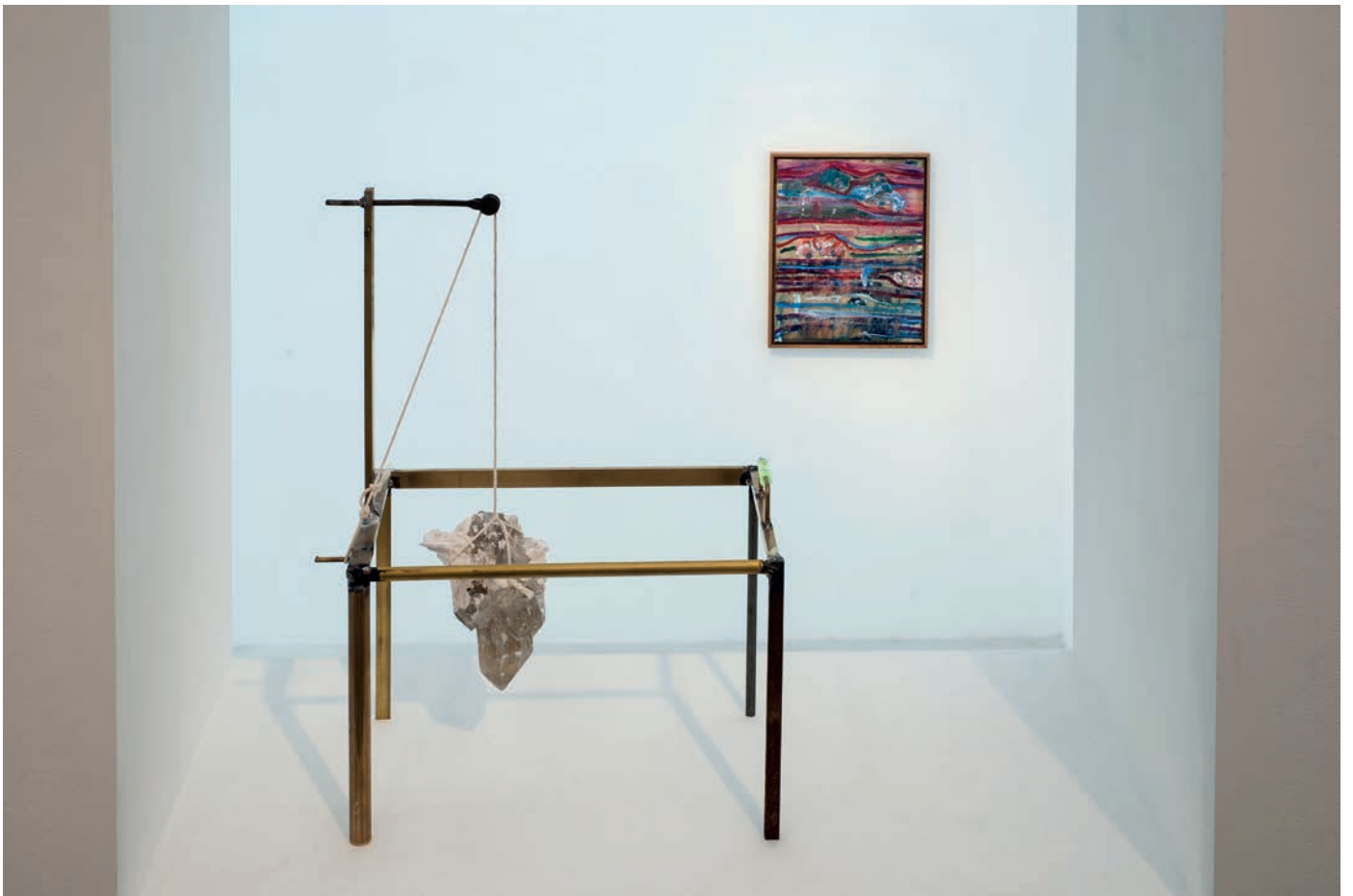
morceaux de soleil, exhibition view, Meessen De Clercq, 2018