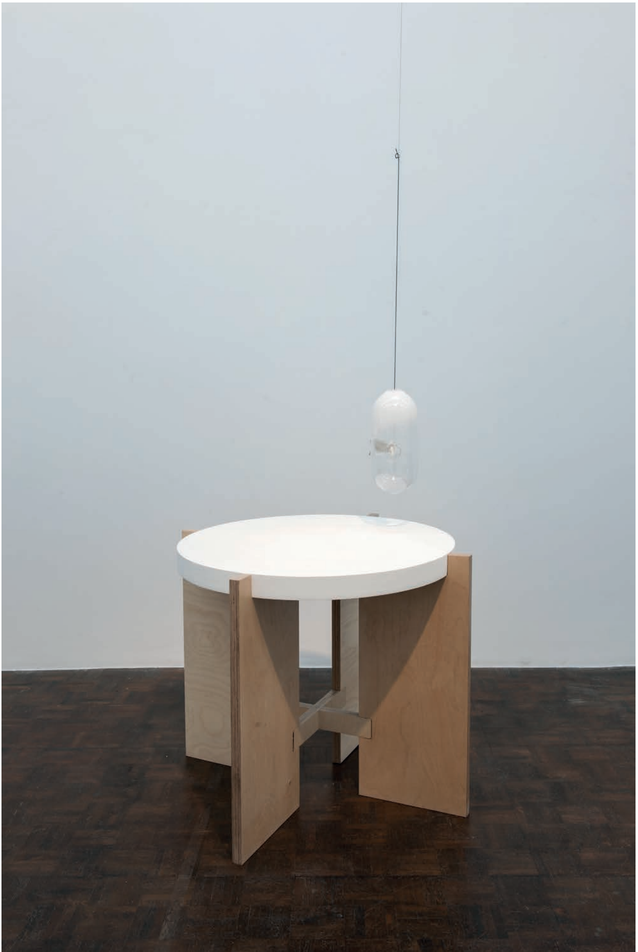
morceaux de soleil, exhibition view, Meessen De Clercq, 2018