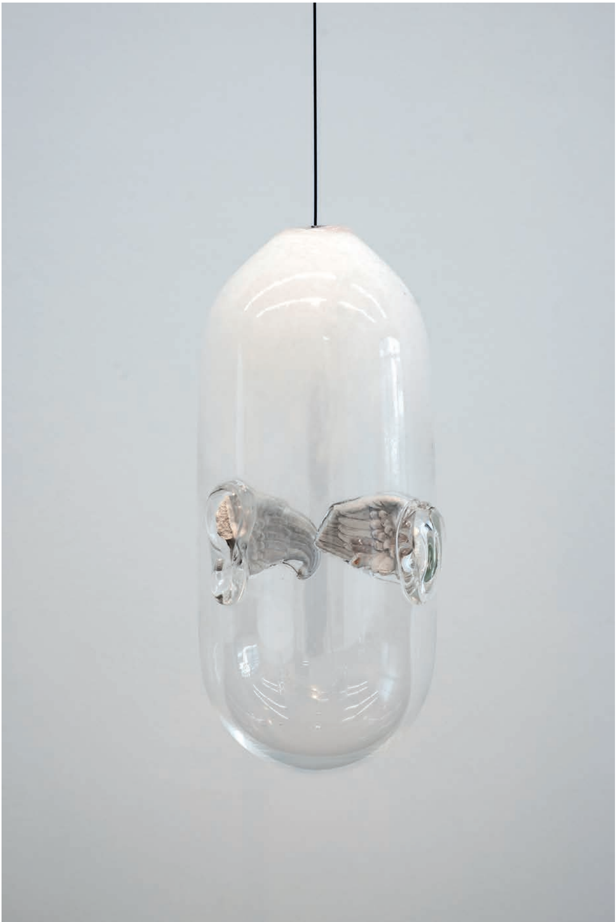
Benoît Maire Sphinx , 2018 Blown glass, plaster 32 x 12 x 15,5 cm