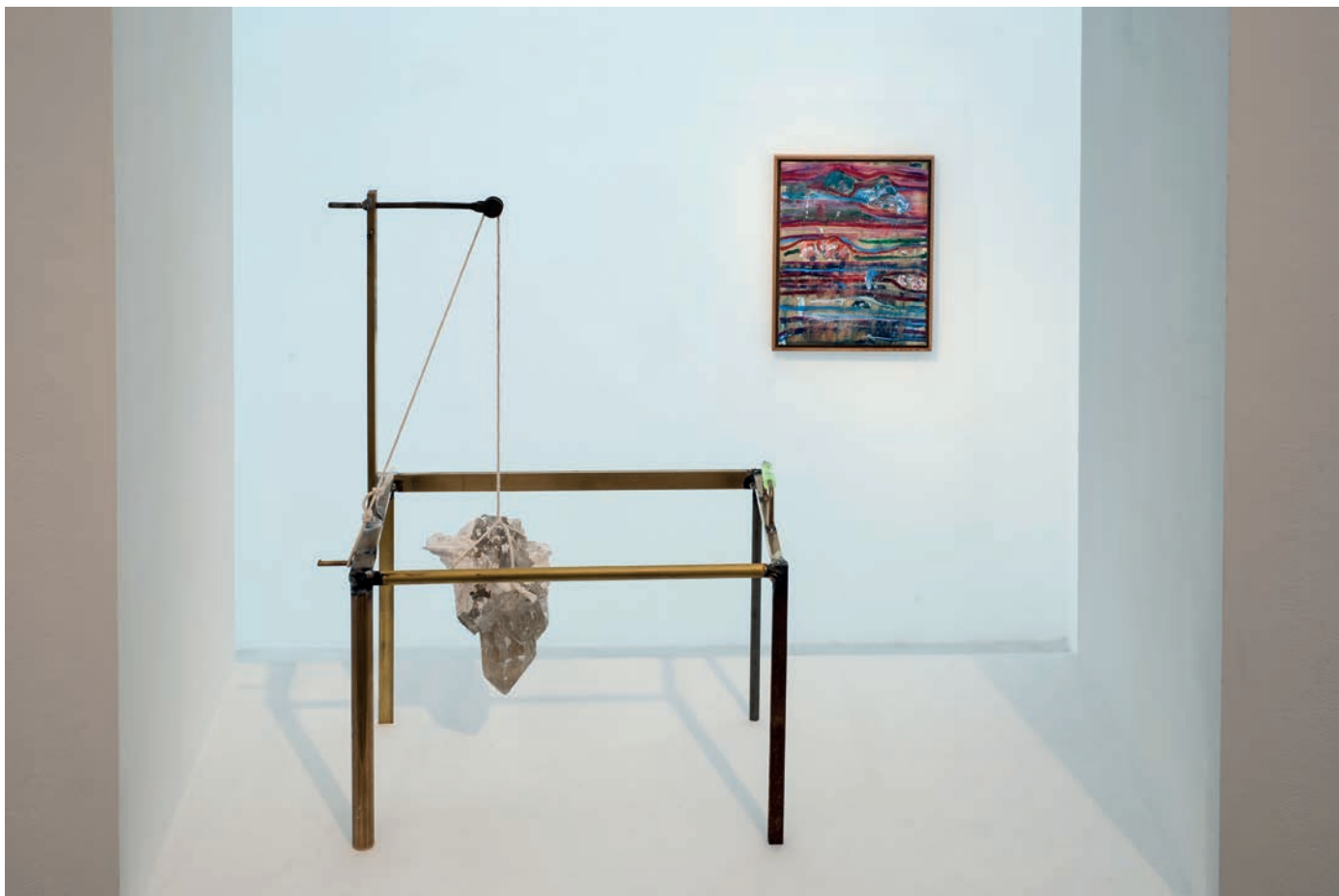
morceaux de soleil, exhibition view, Meessen De Clercq, 2018