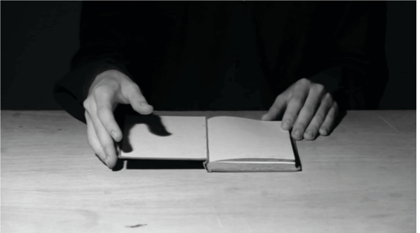
The Last Reader , 2013. Film Still, Single Channel Video, 3'24". Edition 1/3 + 1 AP