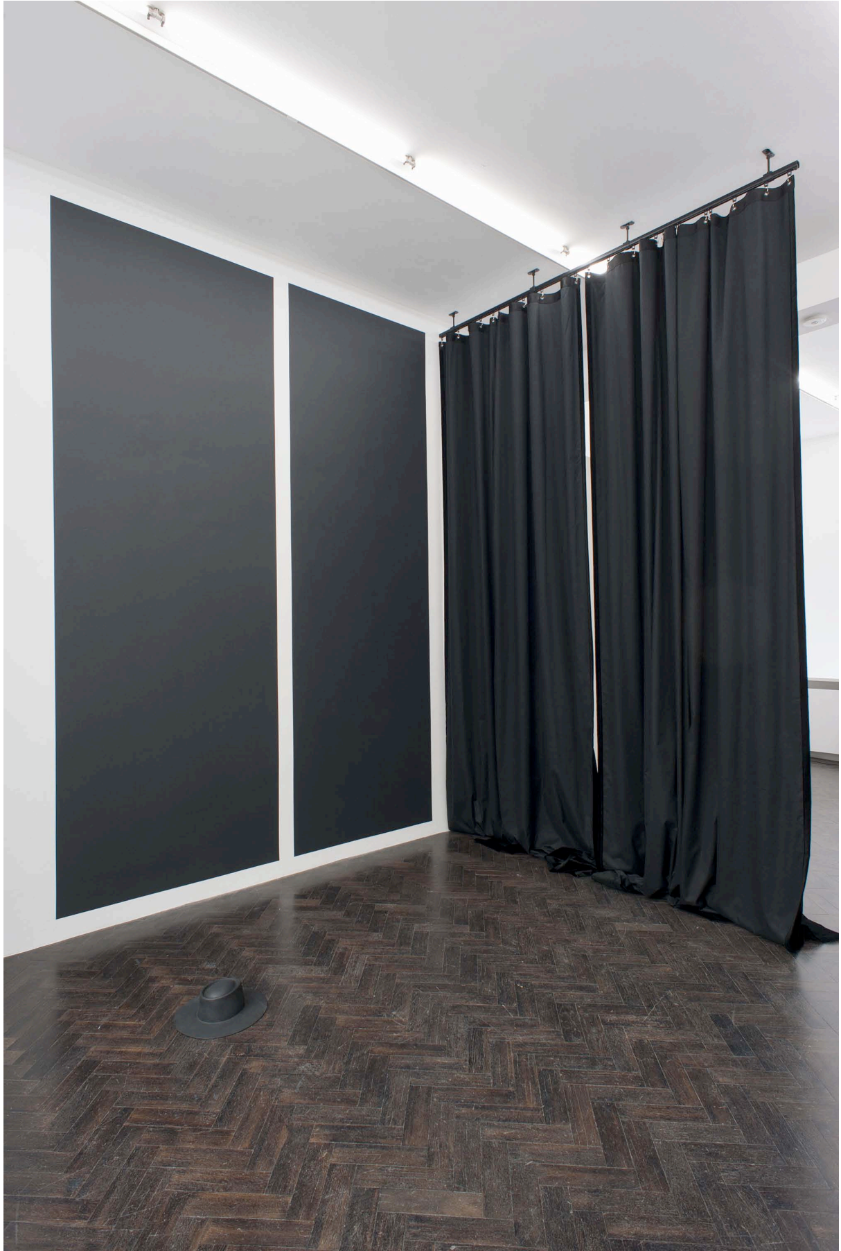
Silence. Five Seconds. Fade Out, 2013. Velvet, metal, paint on wall curtains: 250 x 250 x 350 cm. Unique