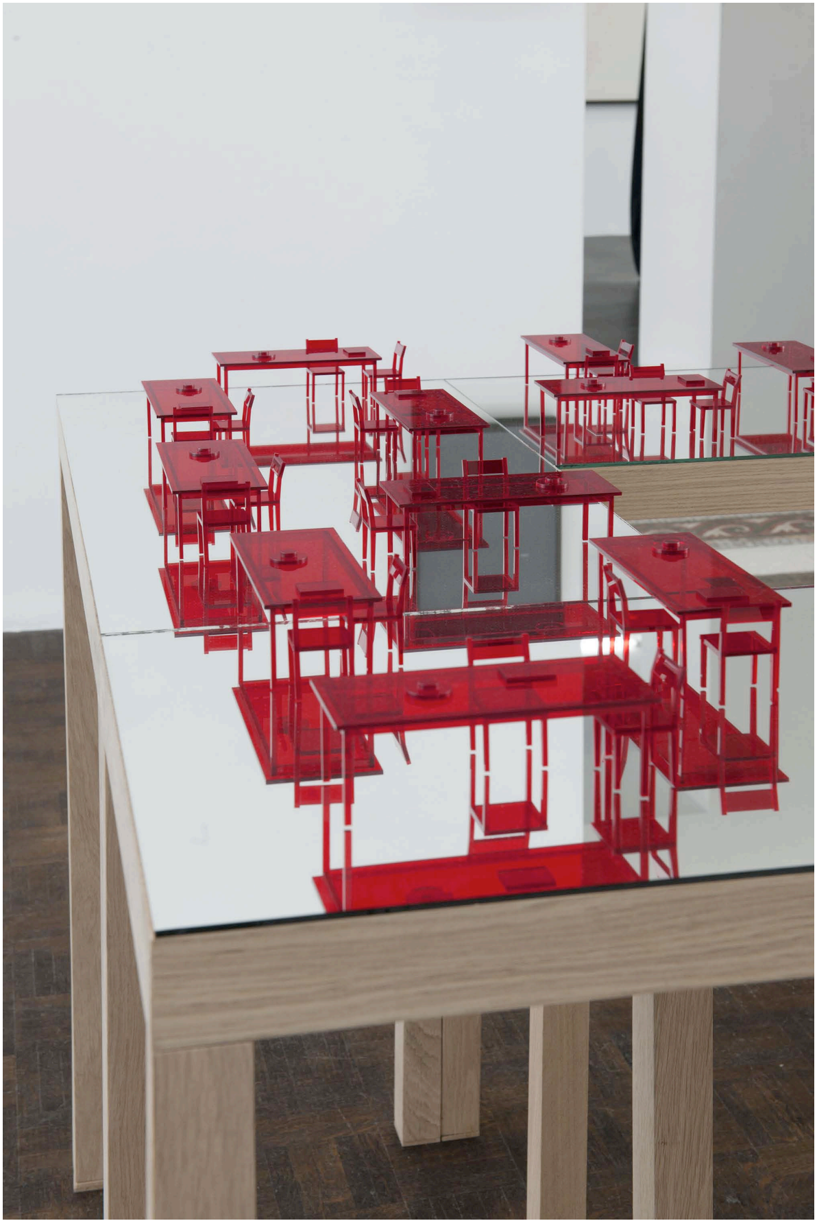
Detail of Unending stage (Ohio Impromptu) , 2013