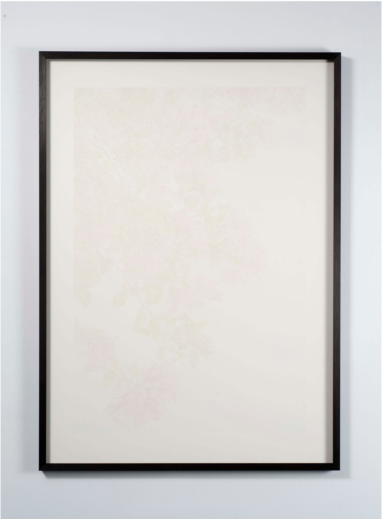
You must go, I can't go on, I'll go on (III) , 2013. Coloured pencil on paper, 144 x 103,5 x 4,5 cm. Unique