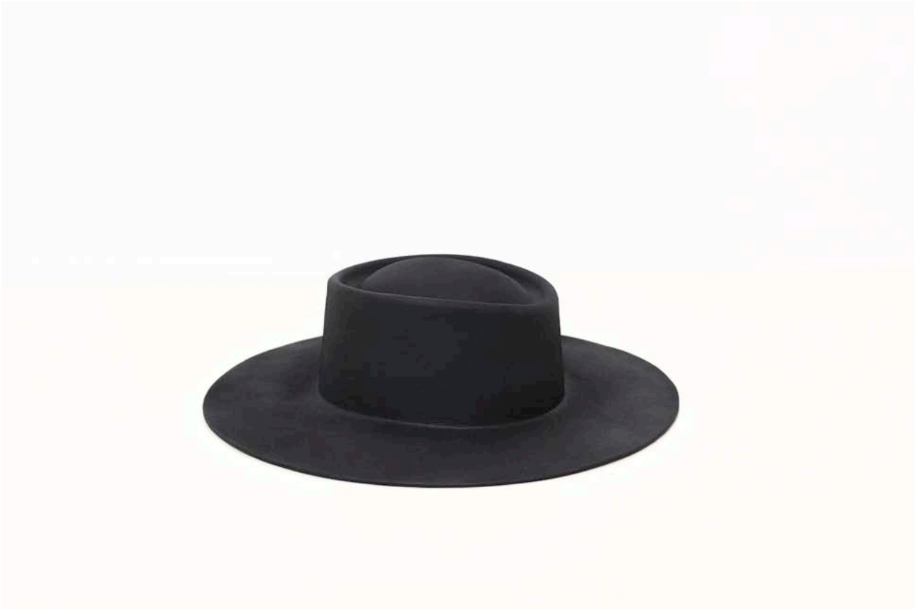
Untitled (Beckett's Hat) , 2013. Bronze, 39 x 31 x 10,5 cm. Edition 1/1 + 1 AP