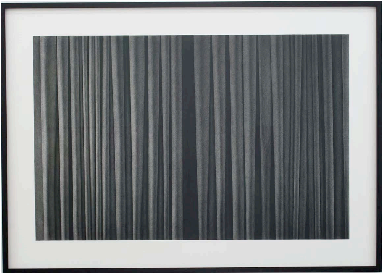
Curtain , 2013. Coloured pencil on paper, 204 x 145 x 2,6 cm. Unique