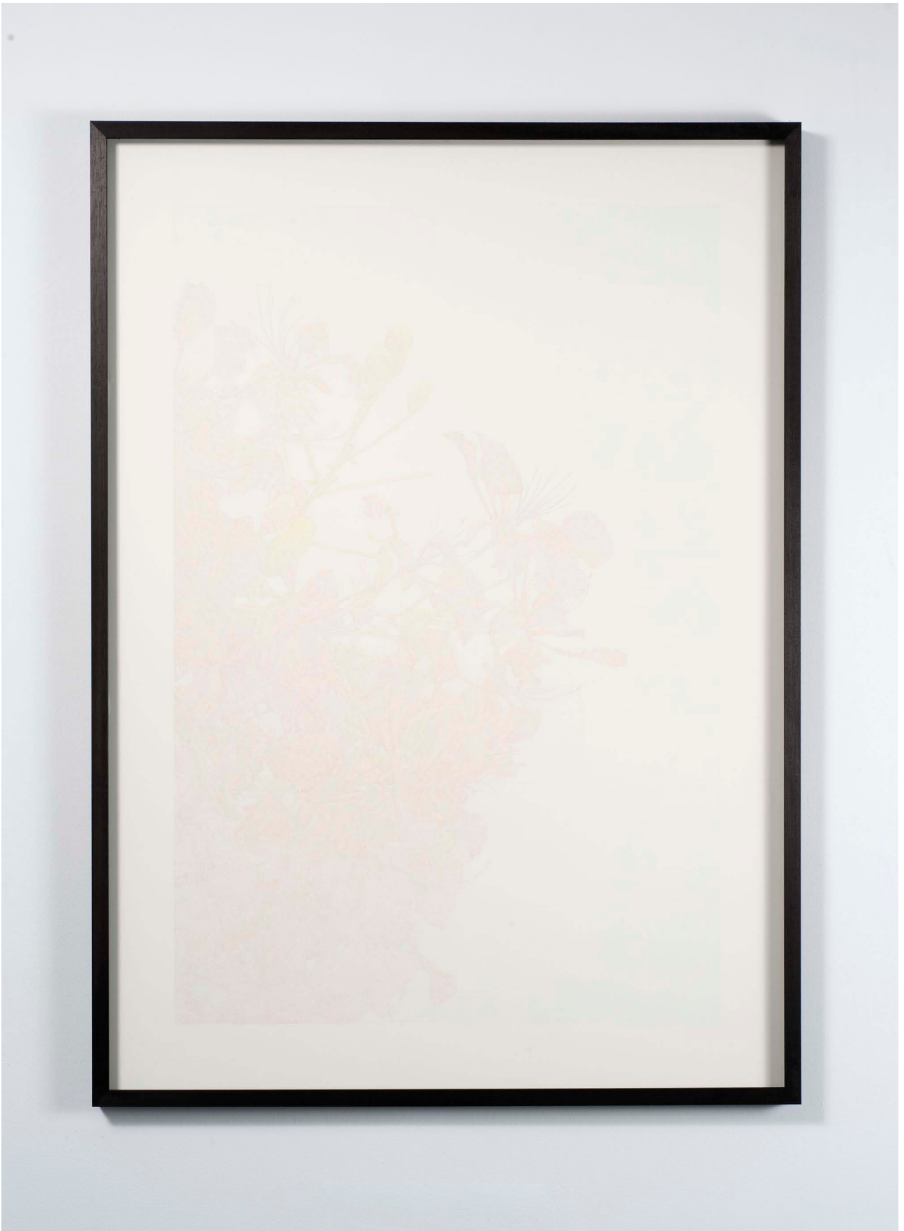
You must go, I can't go on, I'll go on (II) , 2013. Coloured pencil on paper , 144 x 103,5 x 4,5 cm. Unique