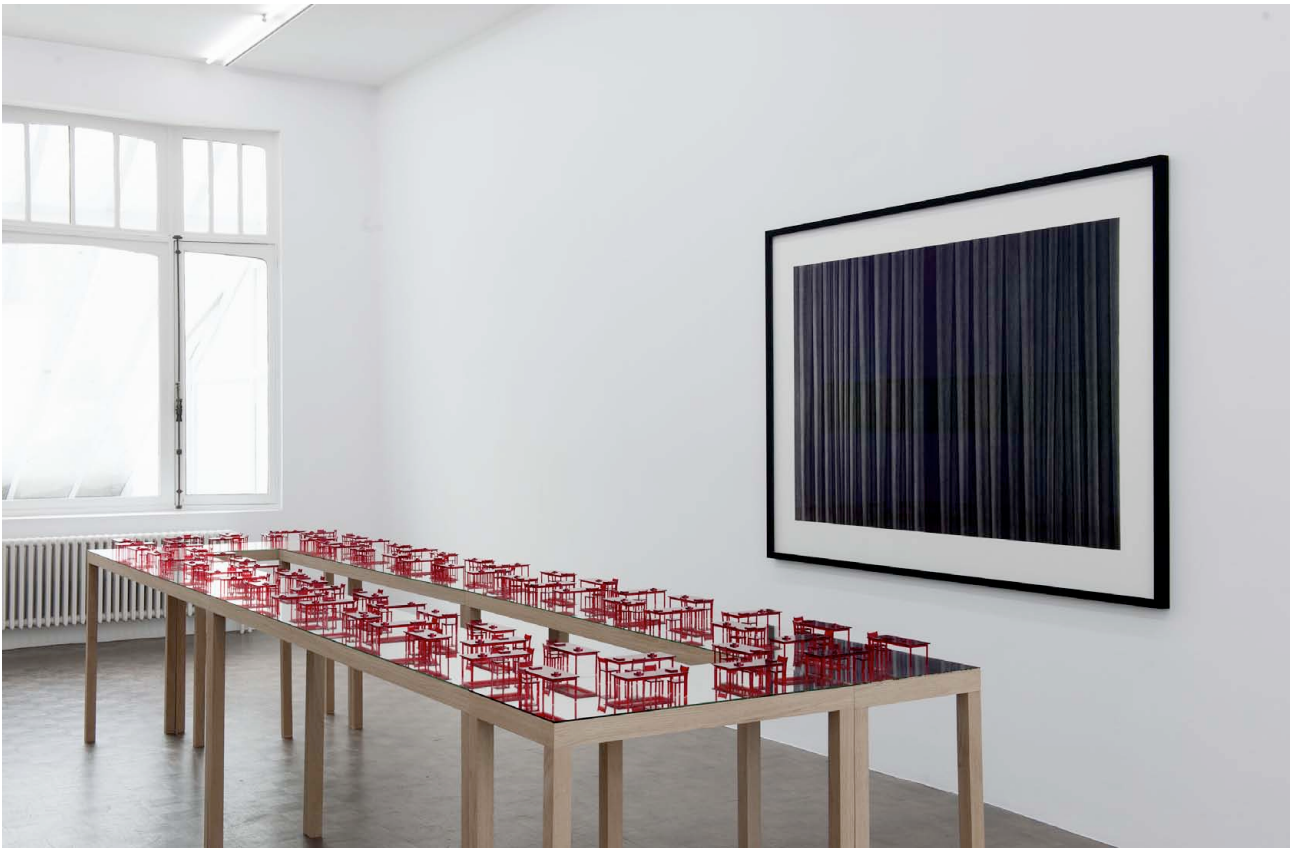
Unending stage (Ohio Impromptu) , 2013. Wood, mirror, plexiglass, ca 438,5 x 112 x 72 cm. Unique