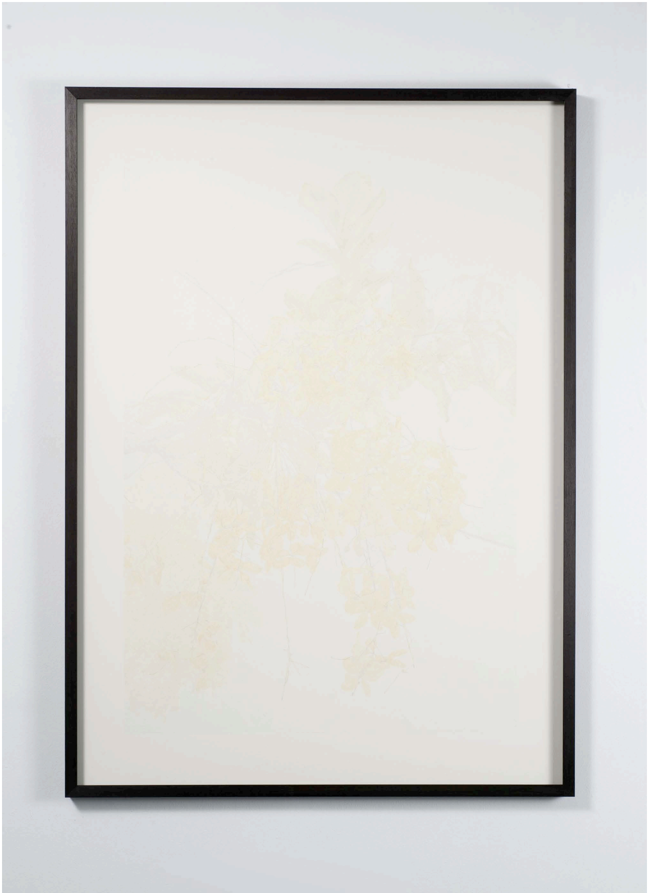
You must go, I can't go on, I'll go on (I) , 2013. Coloured pencil on paper, 144 x 103,5 x 4,5 cm. Unique