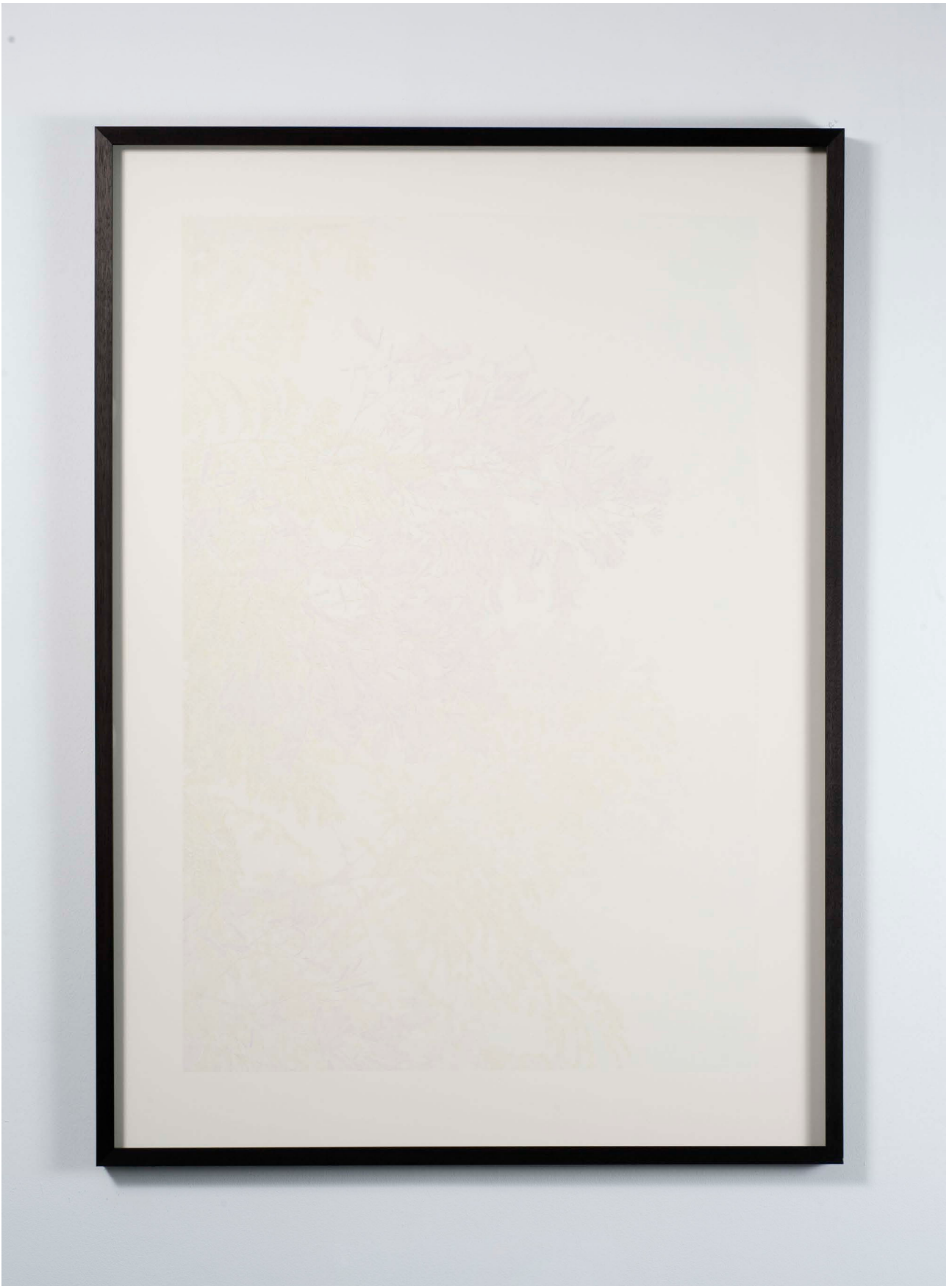
You must go, I can't go on, I'll go on (IV) , 2013. Coloured pencil on paper, 144 x 103,5 x 4,5 cm. Unique