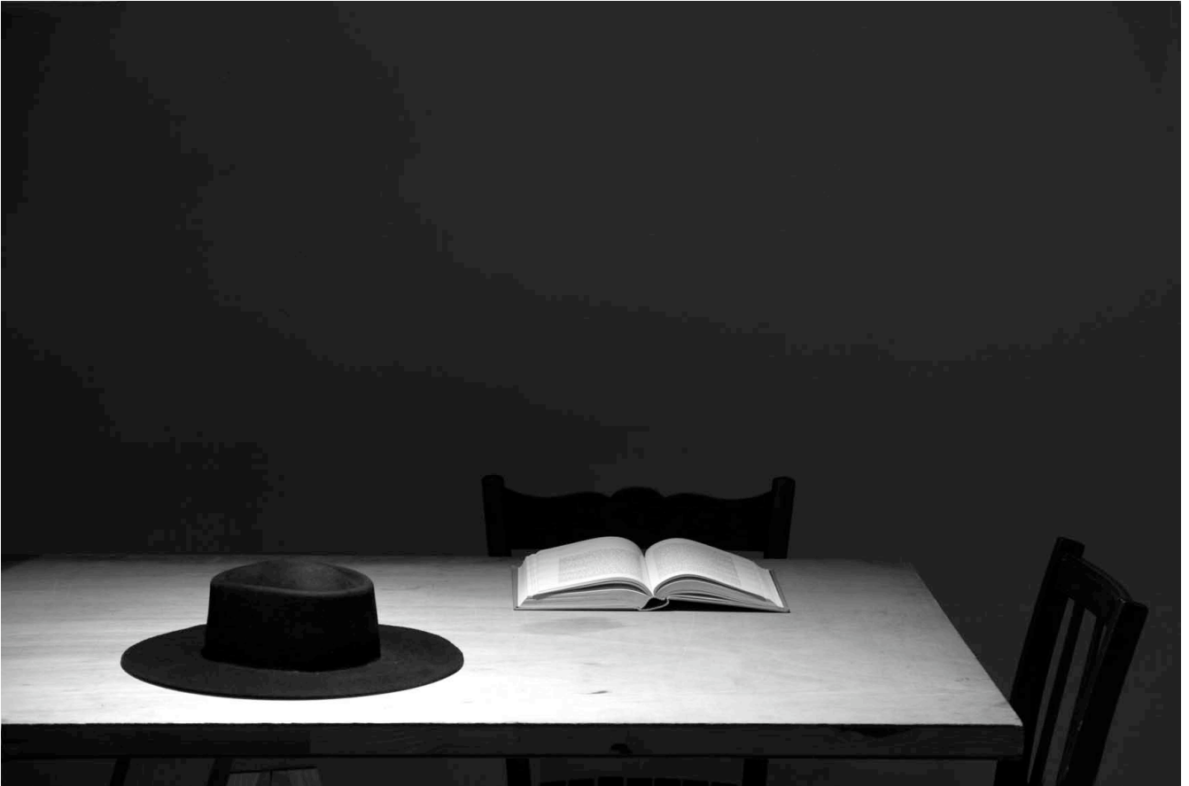
End of the play , 2013. Piezography, diptych, 72,5 x 107 x 4 cm (each). Edition 1/3 + 1 AP