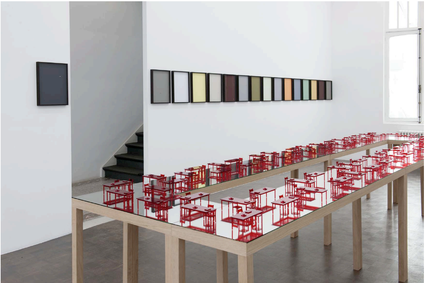
All Beckett's Curtains , 2013. 16 Fine art print, 29,5 x 41,5 x 3,7 cm (each). Edition 1/3 + 1 AP